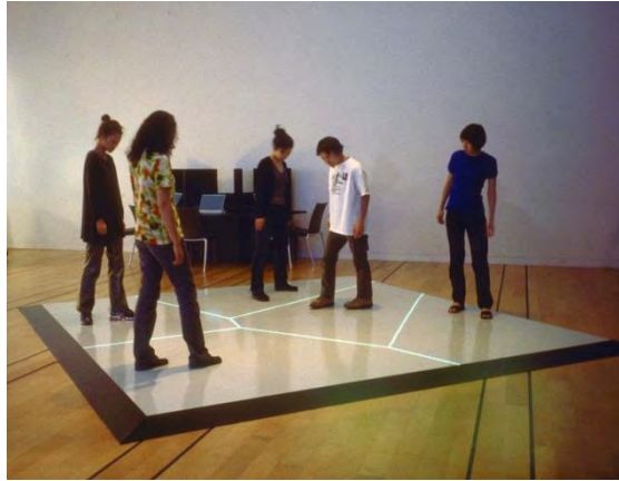
تصویر ۸- اسکات سنا اسنایب، ۱۹۹۸. کارکردهای مرزی.

گری خود با اثر، بل که به رفتارهای دیگران نیز توجه کنند و از آن طریق، معانی و امکانات اثر را دریابند. پس، این اثر و به تبع آن "هنر تعاملی" را می‌توان، مانند دوگونه‌ی قبلی، "تعامل-محور" دانست. اما ویژگی-ایی که "هنر تعاملی" را از هنر نت و دورباشی متمایز می‌کند؛ کنش "فیزیکی و واقعی" مخاطبان آن برای تغییر نمایشگری اثر است.