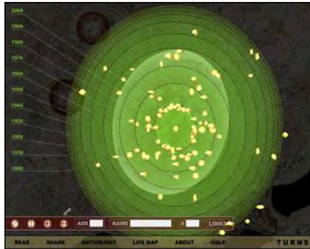
تصویر ۷- مارگت لاجی، ۲۰۰۱. نقاط عطف.

دسترسی داشته باشند. این اثر، هم‌چنین، انعکاسی است از شیوه‌هایی که رسانه‌های جدید بر برداشت‌های فرد در یک بافتار اجتماعی تأثیر می‌گذارند و آن‌ها را تغییر می‌دهند (پایر، ۲۰۰۷، صص. ۳۲۸-۳۲۷).