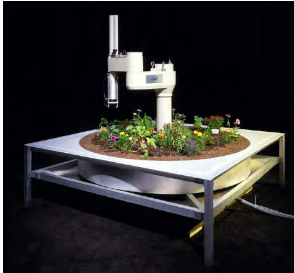
تصویر ۵- کِن گلدبرگ و یوزف سانتارمانا، ۱۹۹۵. تِلِه‌گاردین.

این که در این گونه آثار، واسطه‌ای رایانه-محور وجود دارد و فرمان ۱۰۵ های مخاطبان را رایانش می‌کند و در نهایت موجب تغییر نمایشگری اثر می‌شود، جای هیچ تردیدی نیست؛ و از اینجا باید "تعاملی" (در معنای عام کلمه) بودن "هنر دورباشی" را به رسمیت شناخت. اما به این نکات باریک نیز باید توجه کرد که در این جا؛ از یک سو تعامل مخاطب محدود به فشردن کلیدهای موس و صفحه‌کلید رایانه‌ی شخصی او است، آن چیزی که اِرکی هوتامو ۱۰۶ آن را "تعامل بی‌کنش" ۱۰۷ می‌نامد (هوتامو، ۲۰۰۴)، و نه حرکاتی فیزیکی مثل بالا و پایین پریدن یا راه رفتن؛ و از سوی دیگر، به دلیل آن که در اغلب این گونه آثار، مخاطبان با ابزار شخصی متصل به اینترنت خود، یا با رایانه‌های تهیه دیده شده در محیط گالری در اثر شرکت می‌کنند؛ و در نتیجه اثر قالبی فردی و حتی خصوصی به خود می‌گیرد، فهم کامل اثر نیز به "تعامل" دیگر مخاطبان وابسته نیست. از این رو، می‌توان گفت که یک اثر هنری "دورباشی" اثری است که: (۱) مخاطبانش بتوانند از طریق شبکه (اینترنت) نمایشگری اثر را تغییر دهند، (۲) این تغییر نمایشگری، به واسطه‌ی تعامل بی‌کنش مخاطبان با اثر ایجاد شود و (۳) با در نظر گرفتن خصلت فردی این گونه‌ی هنری، درک کامل اثر منوط به تعامل دیگر مخاطبان نباشد.