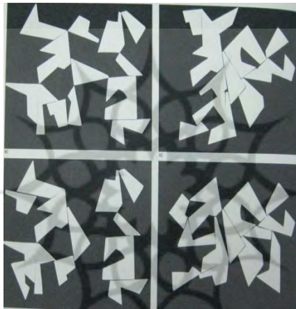
تصویر ۱- یاکف آگام، ۱۹۵۳. سفید و سیاه بر سیاه. منبع: (پاپر، ۱۹۷۶، ص ۳۳)

تصویر شماره ۱، یکی از چهل و پنج اثر دگرگونی‌پذیر آگام است؛ که در این جا، همه‌ی تلاش‌های هنری دهه‌ی پنجاه در جهت درگیر کردن مخاطب اثر هنری را نمایندگی می‌کند. همان‌طور که مشاهده می‌شود، این اثر شامل چند سازمان‌های هندسی است که با میله‌هایی داخل ساپورت ۶۷ سوراخ سوراخ شده فرو رفته‌اند، و مخاطب می‌تواند هر یک از این عناصر هندسی را به دل‌خواه حول محور خودش بگرداند و از این طریق، ترکیب‌بندی جدیدی را به وجود آورد.