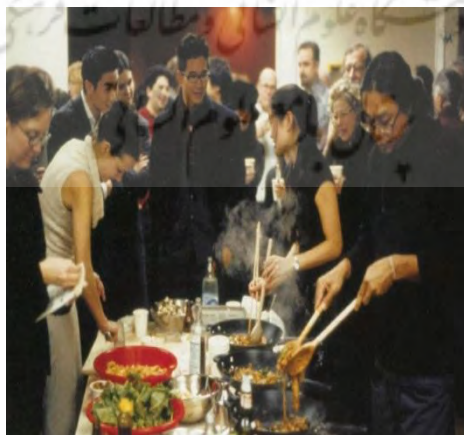
تصویر ۳- ریبرکریت تیراوانیجا، ۱۹۹۲. بدون عنوان (دستگاه تقطیر).

ریبرکریت تیراوانیجا ۸۶ ، در سال ۱۹۹۲ در گالری ۳۰۳ نیویورک، اثر بدون عنوان ۸۷ را به نمایش گذاشت، که در آن برای مخاطبین گالری سوپ کاری می‌پخت. او در این اثر؛ «هرآنچه را که در دفتر گالری و انباری یافته بود به فضای اصلی نمایشگاه منتقل کرد، من جمله مدیر گالری که موظف بود در مقابل همه (در انظار عموم)، در میان بوی پخت - و - پز غذا و هم‌چنین مشتریان کار کند. در انباری گالری، تیراوانیجا، آن چیزی که توسط یک منتقد "آشپزخانه‌ی پناهنده‌ی موقت" نامیده شده بود را برپا کرد؛ بشقاب‌های کاغذی، چاقوها و چنگال‌های پلاستیکی، اجاق‌های گاز، لوازم آشپزخانه، دو میز و چند چهارپایه‌ی تاشو. او در خود گالری کاری‌ها را می‌پخت و آشغال‌ها، وسیله‌ها و پاکت‌های کاغذ، زمانی که هنرمند در گالری حضور نداشت، تبدیل به نمایشگاه هنری می‌شد» (بیشاپ، ۲۰۰۴، ص. ۵۶).