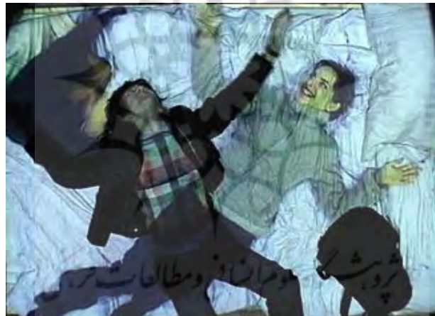
تصویر ۶- پُل سِرْمُن، ۱۹۹۲. رؤیای تله‌ماتیک .

یکی از برجسته‌ترین نمونه‌هایی که این کیفیت هنر تله‌ماتیک را بازتاب می‌دهد، رؤیای تله-ماتیک ۱۱۲ (۱۹۹۲) اثر پُل سِرْمُن ۱۱۳ است. آن‌طور که هنرمند، در تارنمای رسمی خود، در توضیح این اثر می‌گوید؛ این اثر اینستالیشن تله‌ماتیک است، که از شبکه‌ی تلفن دیجیتال آی‌اس دی‌ان ۱۱۴ به عنوان خط ارتباطی بین مخاطبان استفاده می‌کند: در دو اتاق مجزا، که یکی تاریک و دیگری روشن است، دو تخت-خواب دونفره قرار داده شده است. در اتاق روشن؛ یکی از مخاطبان بر روی تخت‌خوابی که دوربینی ویدئویی دقیقاً در بالای آن نصب شده است می‌خوابد و آن دوربین، تصاویر آن تخت‌خواب و مخاطبی که بر آن آرمیده است را به تصویرنمای قرار داده شده در بالای تخت‌خواب دیگر در اتاق تاریک، که مخاطبی نیز بر روی آن خوابیده، ارسال می‌کند و آن تصویرنما، به صورت رایانه‌ای، تصویر مخاطب اتاق روشن را در کنار مخاطب اتاق تاریک قرار می‌دهد. همچنین دوربینی ویدئویی در کنار تصویرنمای اتاق تاریک قرار داده شده است که تصویر مخاطب اتاق روشن که در کنار تصویر مخاطب دیگر خوابیده است را به نمایشگرهای موجود در اتاق روشن ارسال می‌کند. ۱۱۵