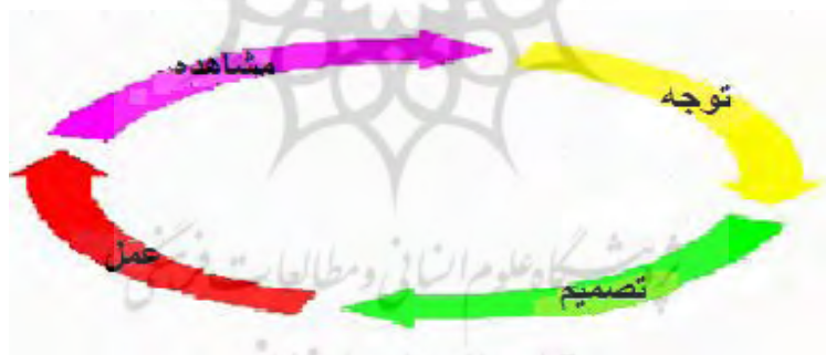
تصویر شماره (۱). حلقه مشاهده، توجه، تصمیم و عمل (کروفورد ۱۴ ، ۱۹۹۴)

یکی از مفاهیمی که اغلب برای به تصویر کشیدن مفهوم نبرد اطلاعاتی مورد استفاده قرار می‌گیرد مدل او.اودی.ای ۱۳ است. این مدل از چهار مرحله مشاهده، توجه، تصمیم و عمل تشکیل شده است. تصویر شماره (۱)، این مدل را نشان می‌دهد: