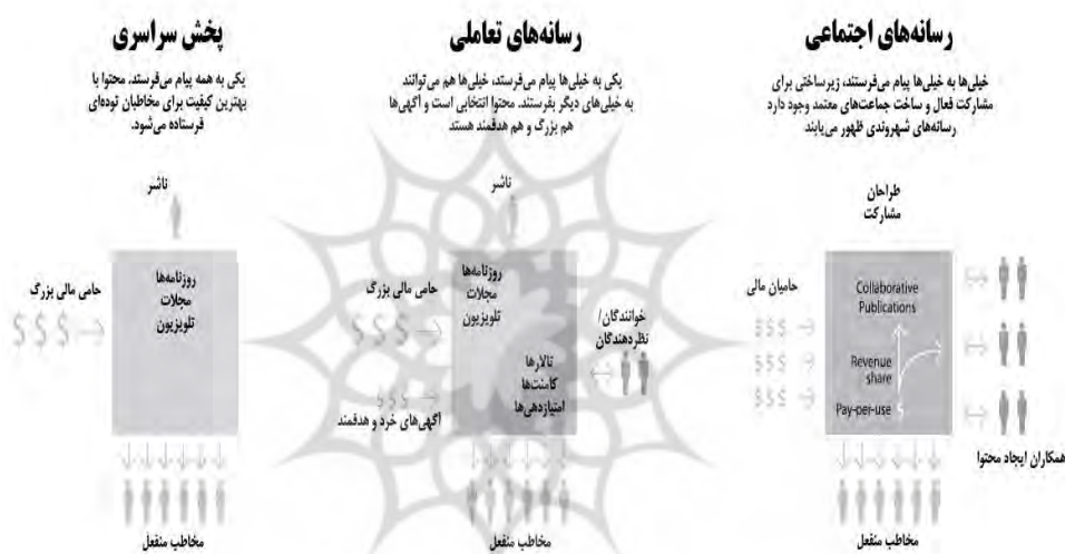
شکل ۱- تولید محتوا و گردش اقتصادی رسانه‌های اجتماعی مبتنی بر مشارکت

تأثیر گرفته از ابزارهای تعاملی قرار می‌دهد. نقش مخاطب فعال در تولید محتوای رسانه‌ای را در رسانه‌های اجتماعی از اساس با مدل‌های پیشین متفاوت می‌داند و محتوای تولید شده توسط کاربر را - که پیش‌تر درباره‌اش سخن گفته شد- برجسته می‌کند. این مدل از رسانه‌های تعاملی نیز چشم‌پوشی نمی‌کند و اثر فناوری‌های جدید ارتباطی بر فضای رسانه‌ای را نیز در قالب این فضا می‌بیند.