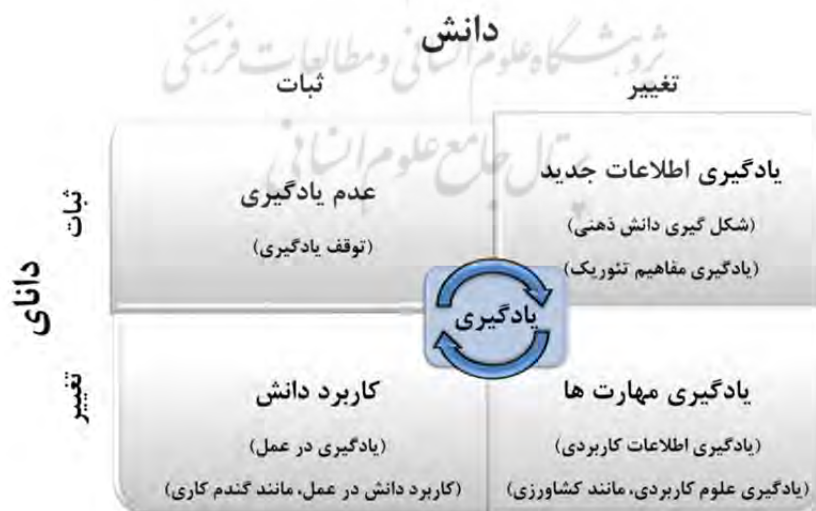
شکل ۱. ماتریس تحلیل فرایند دانش و دانایی و تاثیر آن بر یادگیری (اسپندر، ۱۹۹۶الف و ۱۹۹۶ب)

دانش می‌تواند به عنوان یک محصول پویا در نظر گرفته شود که افراد و سازمان‌ها در تولید آن دخیل می‌باشند. از طرف دیگر، دانایی از طریق فرایند جذب دانش حاصل شده و عامل کاربرد دانش در عمل می‌شود (کوک و براون، ۱۹۹۹). بطور متقابل، فرایند شکل‌گیری و تحقق دانایی، منجر به ایجاد دانش خواهد شد. به عبارت دیگر، دانش محصول عملکردی است که