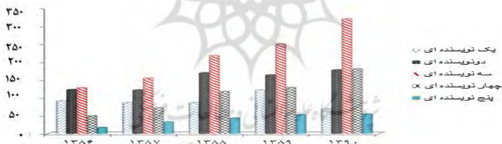
نمودار ۲. تعداد مقاله‌های تولید شده در حوزه روانشناسی در پایگاه آ‌اس‌سی به تفکیک سال بر اساس الگوی هم‌تألیفی

درجه همکاری پژوهشگران ایرانی در حوزه روانشناسی در تولید مدارک نمایه شده در پایگاه استنادی علوم جهان اسلام در سال‌های ۱۳۸۶-۱۳۹۰ چه مقدار بوده است؟ درجه همکاری ۱ برای محاسبه نسبت مقاله‌های دارای چند نویسنده (چند نویسندگی)، از شاخص درجه همکاری استفاده شد. این شاخص نشان دهنده نسبت مقاله‌های دارای چند