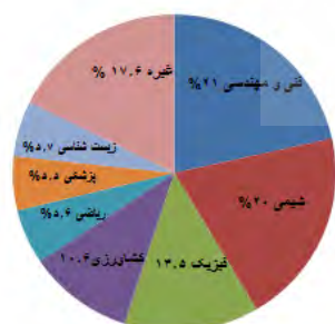
نمودار ۲. درصد پوشش حوزه‌های موضوعی در همکاری علمی دانشگاه تبریز با دانشگاه‌های خارجی

حوزه‌های موضوعی در همکاری دانشگاه تبریز با کشورهای خارجی در نمودار ۲ ارائه شده است. همان‌طور که در نمودار ۲ مشاهده می‌شود حوزه فنی و مهندسی بیشترین همکاری را با ۲۱ درصد به خود اختصاص داده است و حوزه‌های شیمی با ۲۰ درصد، فیزیک با ۱۳/۵ درصد و کشاورزی با ۱۰/۶ درصد رتبه‌های بعدی را در میزان پوشش موضوعی تولیدات علمی به خود اختصاص داده‌اند. به طور کلی همکاری علمی دانشگاه تبریز با مؤسسات و دانشگاه‌های خارجی بیشتر در حوزه‌های فنی مهندسی و علوم پایه است و در حوزه‌های علوم انسانی همکاری کمتری را با آنها دارد.