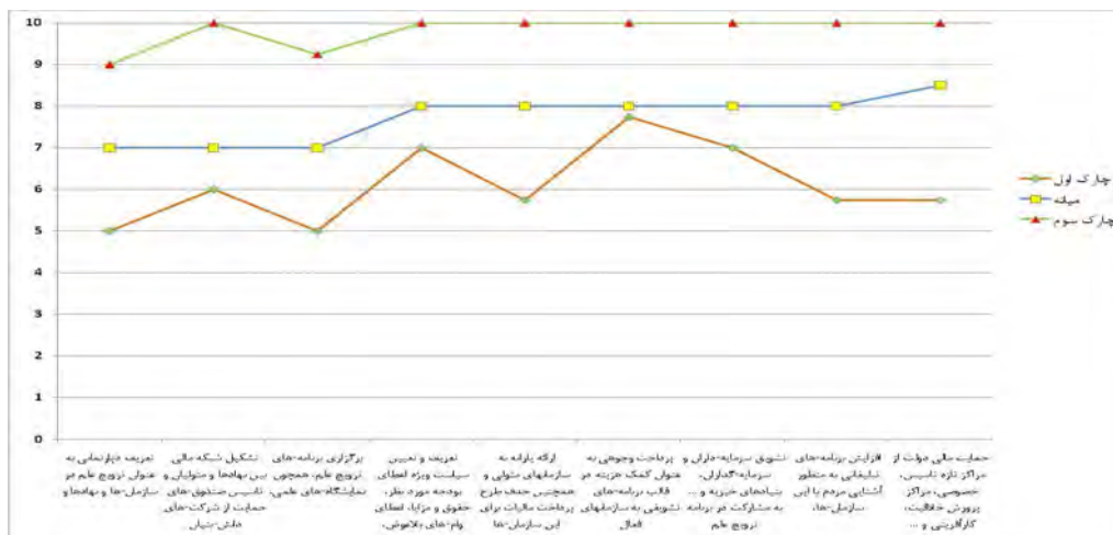
نمودار 2: مقایسه میزان تأثیر راهکارهای رفع مشکلات مالی در ترویج علم

همان‌طور که در نمودار فوق مشاهده می‌شود، حمایت مالی دولت از مراکز تازه تاسیس، خصوصی، مراکز پرورش خلاقیت، کارآفرینی و . . . که در راستای ترویج ایده‌ها و خلاقیت‌هایی خود با امکانات محدود تلاش می‌کنند، با بالاترین میزان تأثیر به عنوان یک راهکار در رفع مشکلات مالی، با توجه به مقدار میانه یعنی عدد 8/5 نشان از این است که پنجاه درصد از پاسخگویان تأثیرگذاری این راهکار را در حد زیاد ارزیابی کرده‌اند. سؤالی که در این بخش پیش می‌آید که آیا از دید پاسخگویان هر یک از راهکارهای رفع مشکلات مالی مورد بررسی به یک میزان در ترویج علم موثر هستند یا خیر؟ در صورتی که میزان تأثیر هر یک از راهکارها به یک اندازه نباشد، بیشترین اثر مربوط به کدامیک از راهکارهاست؟ برای پاسخ به این سؤالات آزمون فریدمن برای فرض صفر و مقابل آماری بکار برده شد.