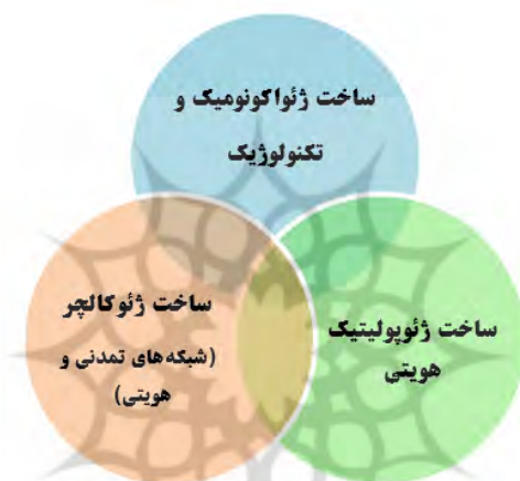
شکل ۲. ساخت سه گانه گسله‌های ژئواستراتژیک (آسیابان، ۱۴۰۱: ۷۴)

از یکدیگر نوعی سازمان اجتماعی یافته‌اند. این شبکه‌ها در گستره ژئواستراتژیک از طریق الگوهای مکرر ارتباطی در زمینه‌های اجتماعی در جهت گسترش و تحکیم ساختار افقی و عمودی خود هستند؛ بنابراین شبکه گسترده ژئواستراتژیک به‌عنوان یکی از ارکان مهم نظم در وضعیت پیچیدگی ساختاری محسوب می‌شود. این شبکه به‌عنوان یک صحنه استراتژیک به تمامی کنشگران و واحدهای سیستم بین‌الملل این امکان را می‌دهد تا ساختارهای هنجاری و هویتی خودشان را در روابط اجتماعی گسترش دهند (سانگیوانی، ۲۰۰۵: ۸).