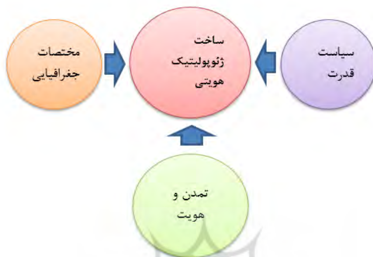
شکل. Error! No text of specified style in document. عناصر ژئوپولیتیک هویتی (آسیابان، ۱۴۰۱: ۷۵)