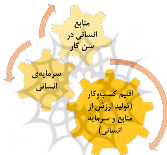
شکل ۲- زنجیره‌ی تبدیل جمعیت به سرمایه‌ی انسانی مولد و ارزش‌ساز

لذا جهت از دست نرفتن پنجره‌ی فرصت جمعیت‌نگاری، به موازات سیاست‌های افزایش نرخ رشد جمعیت، بایستی برای پیشگیری از وقوع سناریوهای «زاینده‌ویران» و «نازاویران»، (فارغ از اینکه افزایش جمعیت به چه سمتی خواهد رفت) زنجیره‌ی تبدیل جمعیت در سن کار به نیروی انسانی مجهز به سرمایه‌ی انسانی و تولید ارزش اقتصادی رشد‌دهنده و توسعه‌ی اقتصادی کشور، ساخته شود.