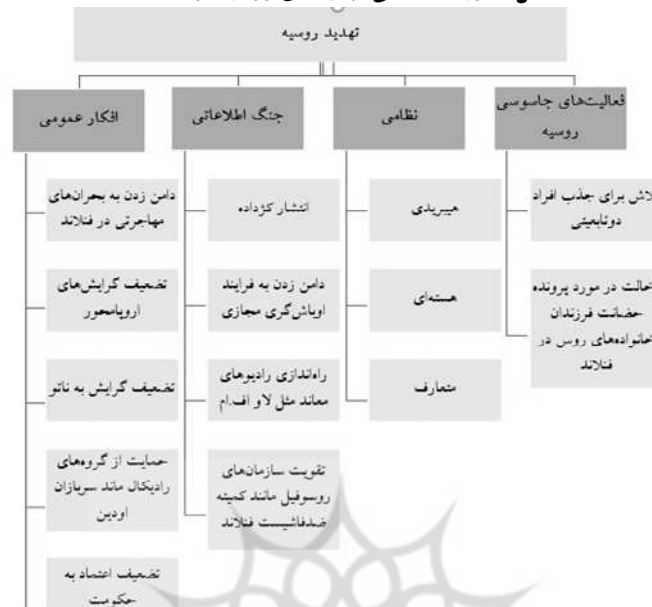
شکل ۲. ریخت‌شناسی تهدیدهای روسیه در فنلاند