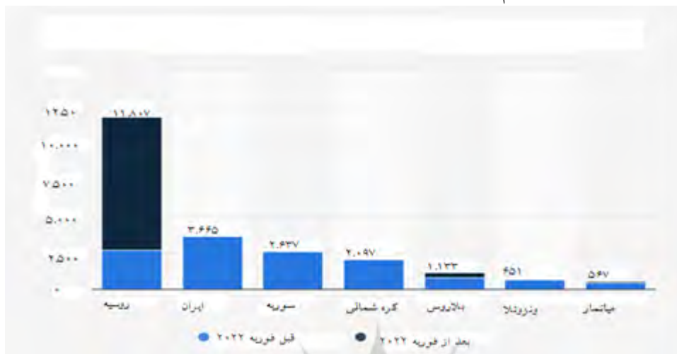
Source: Number of International Sanctions Imposed Worldwide by Target Country, 2022

با توجه به این داده‌ها می‌توان سیاست همراهی ایران با روسیه را بنابر سیاست دنباله‌روی شویلری، بررسی و تحلیل کرد. در این دیدگاه دولت ایران نه به‌عنوان کنشگری امنیتی که به‌دنبال بقا است، بلکه به‌عنوان کنشگری اقتصادی عمل می‌کند که به‌دنبال سود و دستاوردهای بیشتر از پیش همراهی با قدرت بزرگی چون روسیه است. در نتیجه‌گیری به تفاوت‌های تحلیلی دو دیدگاه اشاره می‌کنیم.