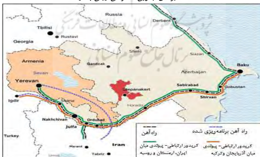
نقشه ۲: مسیرهای جنوبی دسترسی ریلی به ارمنستان

افزون بر مسیر جاده‌ای، خطوط ریلی ارمنستان در بخش‌های شمالی این کشور به گرجستان وصل شده است، اما در بخش‌های جنوبی خط ریلی وجود ندارد. البته یک خط ریلی میان جمهوری آذربایجان و نخجوان وجود دارد که در زمان اتحاد شوروی ساخته شده است. این خط آهن با عبور از استان سیونیک ارمنستان (۴۳،۴ کیلومتر) به نخجوان و سپس به ایروان می‌رسد. ایران با راه آهن جلفا به این مسیر ریلی متصل است و از این راه به ارمنستان دسترسی ریلی دارد. اما بعد از جنگ اول قره‌باغ در سال ۱۹۹۴ این خط آهن از سوی جمهوری آذربایجان و ترکیه بسته شد (Huseynov, 2021). نقشه ۲ مسیر ریلی اشاره شده و راه‌گذرهای احتمالی پس از جنگ دوم قره‌باغ در سال ۲۰۲۰ را نشان می‌دهد.