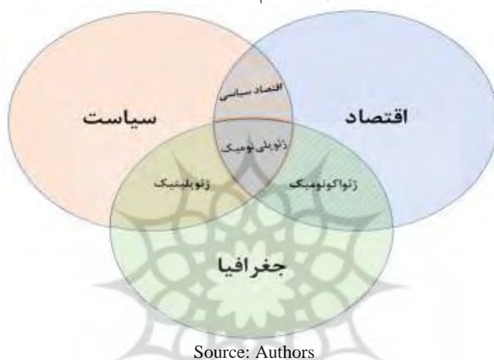
شکل ۱: مفاهیم تحلیلی پژوهش

است (Kazi, 2007: 3-5). بنابراین اصطلاح «ژئوپلی‌نومی» در درون خود مفهوم «ژئواکونومی» و «ژئوپلیتیک» را نهفته دارد و از ترکیب عوامل اقتصادی و سیاسی با مرکزیت جغرافیا شکل گرفته است. همچنین ژئوپلی‌نومی بیانگر افزایش اهمیت اقتصاد سیاسی در معادله‌های جغرافیایی است. شکل ۱ جایگاه هر کدام از این مفاهیم را نشان می‌دهد.