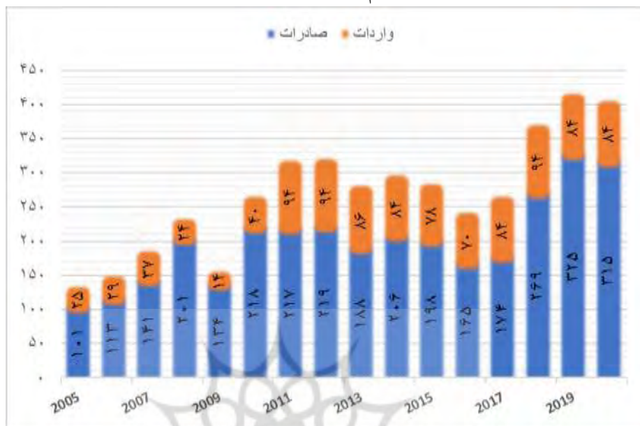
نمودار ۱: حجم صادرات و واردات ایران به/ از ارمنستان