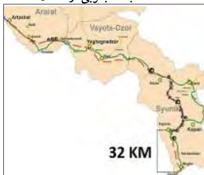
نقشه ۱: جاده جنوبی ارمنستان