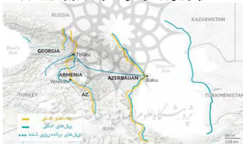
نقشه ۳: مسیرهای ریلی و جاده‌ای اصلی میان ایران با جمهوری آذربایجان و ارمنستان

از سوی دیگر، ارمنستان با روسیه مرز مشترک ندارد و به دلیل اختلاف‌های مسکو و تفلیس دشواری‌هایی برای اتصال این راه‌گذر به روسیه وجود دارد. برخی تحلیلگران این محدودیت‌ها را بدین معنا تفسیر کرده‌اند که تهران مسیر جمهوری آذربایجان را به ارمنستان در راه‌گذر شمال- جنوب ترجیح داده است (Dolaberidze, 2018). در حالی که به نظر می‌رسد انتخاب‌های تهران در این دوره زمانی بیش از اینکه سیاسی باشد اقتصادی بوده است و بر مبنای فرصت‌های اقتصادی موجود تنظیم شده است. شایان توجه اینکه جمهوری آذربایجان علاوه بر اینکه در مسیر راه‌گذر شمالی- جنوبی قرار دارد؛ در چارچوب برنامه تراسیکا بخشی از راه‌گذر جنوبی- غربی نیز محسوب می‌شود (TRACECA, 2021b). یعنی با اتصال شبکه ریلی ایران و جمهوری آذربایجان، علاوه بر دسترسی به روسیه، دسترسی به بندرهای پوتی و باتومی گرجستان به وسیله راه آهن باکو- تفلیس نیز فراهم می‌شود. البته ارمنستان نیز به طور بالقوه می‌تواند ایران را به این بندرها وصل کند. نقشه ۳ این مسیرها را نشان می‌دهد.