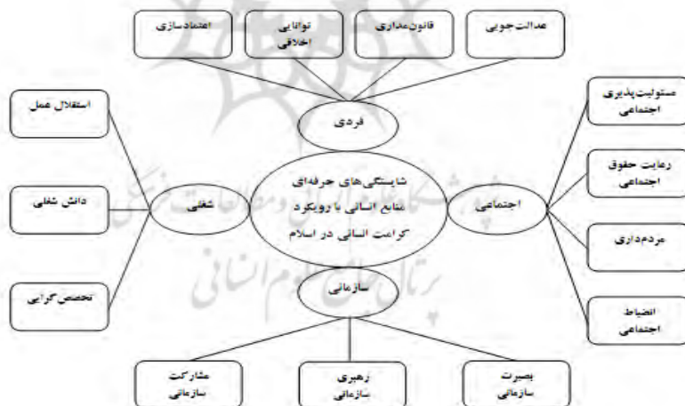
شکل ۱: الگوی شایستگی‌های حرفه‌ای منابع انسانی با رویکرد کرامت انسانی در اسلام

مبتنی بر نظر پژوهشگران در خصوص تحلیل‌های کیفی، می‌توان نتایج حاصل از چنین تحلیل‌ها را به‌صورت الگوی تشریحی، نموداری و ترسیمی نشان داد. در شکل شماره ۱ الگوی حاصل از یافته‌های کیفی پژوهش حاضر به‌صورت ترسیمی آورده شده است.