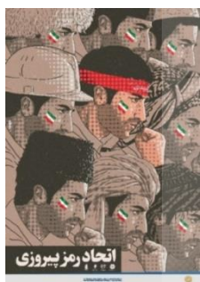
پیروزی، طراحان: ثارالله فرخ، مأخذ:

نشانه‌ها نهادهایی اجتماعی می‌یابند. (Nöth, 1990: 60) درخت سرسبز و زنده به معنای زندگی جاوید و روح فناپذیر و جاودانه است و در اینجا جانشین انقلاب ایران است. رنگ سفید تنه و شاخه‌های درخت نیز به معنای پاکی و رستگاری است. تبر، وسیله‌ای است جهت قطع درختان که دسته آن از جنس درخت است؛ در واقع، بخشی از تبر از جنس چوب است و خود عاملی جهت قطع درختان می‌شود که تداعی کننده مفهوم تضاد است و در انتقال معنای خیانت تأثیرگذار است. همان‌گونه که در تصویر ۳ دیده می‌شود، جمله‌ای کوتاه به زبان انگلیسی بیان شده که معنای فارسی آن «نه به خیانت» است؛ افزون بر آن، سخنی از مقام معظم رهبری جمهوری اسلامی ایران نگاشته شده که بدین شرح است: «دست‌های خیانت‌کار قطع می‌شود و کارایی نظام اسلامی بیشتر و بسیاری از مشکلات فعلی حل خواهد شد».