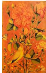
تصویر شماره ۲: گل و مرغ، محمدزمان، قرن ۱۳ هجری قمری (شهادی، ۱۳۸۴: ۱۳۱)

است. دلیل دیگر این است که در انتظار باز شدن گل (نمادی از تجلی جلوه حق) مانده است و به محض دریافت بارقه‌ای از تجلیات ظهورش شروع به ذکر ثنا و راز و نیاز با معشوق می‌کند. در واقع از یار می‌خواهد اسراری را با او در میان بگذارد تا با کاسته شدن اندکی از بی‌قراری‌هایش، راه‌های نهانی برایش باز شود؛ بستان به بستان پیش رود تا جایی که صورت الهی بر او متجلی شود.