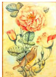
تصویر شماره ۷: گل و مرغ، لطفعلی شیرازی قرن ۱۳ هجری قمری (شهدادی، ۱۳۸۴: ۲۲۱)

نقاشان دوره قاجار در اغلب نقوش خود سعی در القای جایگاه رفیع‌تر گل (در نقش معشوق، جلوه حق و مظهر ناز) داشته‌اند. گل‌ها در قسمت بالای نگاره با رنگ‌های دلربا، جذاب و درشت‌تر و پرنده (در نقش عاشق و مظهر نیاز) در پایین نگاره با رنگ‌های خنثی و گاهی نخودی (به رنگ پوست انسان به‌دلیل نماد روح انسانی بودن) کوچک‌تر از حد معمول، درحالی‌که رو به گل دارد، ترسیم شده است (رک. تصویر شماره ۷).