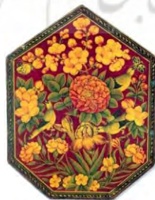
تصویر شماره ۴: قاب آینه با درپوش، گل و مرغ، علی اشرف ۱۱۶۶ هجری قمری (خلیلی، ۱۳۸۶: ۶۸)

مرغانی که در تصاویر گل و مرغ در حال شکار پروانه یا سایر حشرات نشان داده شده‌اند، سالکین اهل قیل وقالی هستند که خیلی در راه خود استوار نبوده‌اند و گاهی گریزوار به لذت‌های دنیای مادی توجه می‌کنند. این تصویر که اغلب نزد هنرمندان به گرفت و گیر معروف بوده است، معمولاً سالکان نوپا را مد نظر دارد که هنوز قابلیت مکاشفات را ندارند و با کم‌طاقتی خود از رفتن بازمی‌مانند؛ گوششان اغلب سرگرم بانگ و گفتارهای این جهانی است و هوش و حواسشان متوجه گل نیست (رک. تصویر شماره ۴).