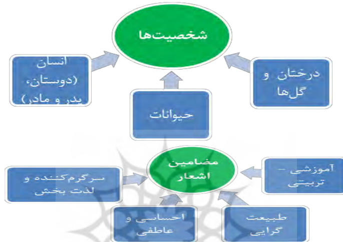
شکل ۱: شخصیت‌ها و مضامین در اشعار ناصر کشاورز

با توجه به جدول شماره دو، مضامین موجود در اشعار کودکانه ناصر کشاورز را می‌توان در دسته مضامین آموزشی و تربیتی، احساسی و عاطفی، طبیعت‌گرایی و بازی و سرگرمی قرار داد. همچنین شخصیت‌های موجود در آثار کشاورز شامل درختان و گیاهان و اسباب‌بازی‌ها، حیوانات و انسان است. در شکل دو، اهداف والای انسانی ارائه شده است که در مضمون‌های آموزشی و اجتماعی اشعار کشاورز وجود داشت.