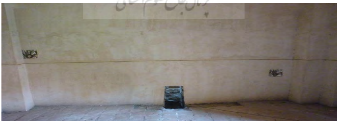
شکل ۱۳- سردابه

برخی از مورخین عقیده دارند که این بنا به جای آتشکده‌ای از دوره ساسانی احداث شده است، ولی هیچ گونه سند معتبری مبنی بر صحت این ادعا وجود ندارد. دلایلی که این مورخان ارائه می دهند این است که این بنا در سه طبقه و شبیه دوره ساسانی ساخته شده که دو طبقه اصلی آن یک سردابه و در طبقه دوم محل عبادت بوده که بر روی گنبد، گنبد کوچکتری است که این بنا را به سه گنبد تبدیل کرده است. همچنین دلایلی که احتمال می دهند این بنا از دوره ساسانی است یک پلکانی بودن ورودیه به محل عبادتگاه است که در بناهای اسلامی نظیر آن دیده نمی شود. دلیل دیگر احتمال وجود آتش در طبقه سوم و دلیل سوم اثر دست معمار زن که موردی نادر در بناهای اسلامی است. معمولا در زمان ساسانی معماران اثر دست خودشان را به مانند یک امضا در جایی که بنا می کردند می گذاشتند. البته دو اثر دست مردانه هم در این بنای زیبا وجود دارد. به هر حال در دوره سلجوقیان این نوع بنا ها رواج پیدا کرده است و در بعضی از شهر ها هم نمونه های باقی مانده آن موجود است و در دوره ایلخانی هم نمونه هایی ساخته شده است. هر چند همانطوریکه اشاره شد تمام تزئینات مربوط به دوره سلجوقی است.