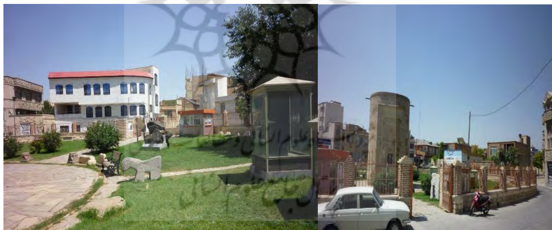
شکل ۱۸-نمایی از محوطه ی بیرونی بنا/شکل ۲۰-نمایی از داخل محوطه ی بنا

آرامگاه سه گنبد در مرکز بافت قدیمی شهر ارومیه، میدان جانبازان ، یکی از کوچه‌های منشعب از خیابان استاد برزگر قرار گرفته است به منظور محصور کردن حریم و جلوگیری از هرگونه صدمه به تزئینات آن، پیرامون محوطه سه گنبد با نرده‌های فلزی و محوطه سازی محصور شده است. سه گنبد در زمینی که اطرافش را قبور زیادی اشغال نموده ساخته شده است، و احتمالاً زمین مزبور صحن آن بنا بوده که عده ای را به لحاظ قدسیت محل در آنجا دفن کرده اند.