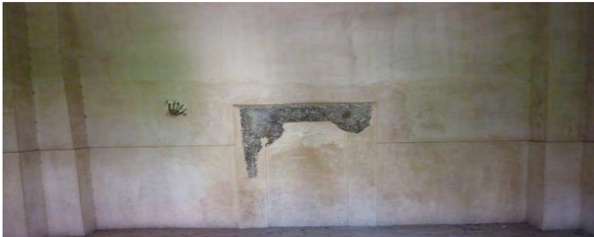
شکل ۱۴-محل عبادت

بنای سه گنبد شهرستان ارومیه به عنوان مقبره یا آرامگاهی از نوع دایره‌ای شکل است. دلیل مهارت معمار سه گنبد آن است که در برجی استوانه‌ای شکل قبلاً اتاقی مربع تعبیه کرده و مجدداً تربیع بنا را با تدابیر معماری مبدل به تدویر کرده آنگاه گنبد را بر آن برافراشته است. نکته مهم هنری این بنا گذشته از گنبد رفیع و مقرنس کاری که در حدود ۹ متر ارتفاع دارد، رنگ آمیزی و تزئینات سنگی است که جلوه خاص به این بنا داده است. بر اساس این گزارش تا قرن نوزدهم به این اثر توجهی نشده بود و برای اولین بار در سال ۱۸۵۲ میلادی از طرف "ن. خانیکوف" این برج به دنیای هنر شناسانده شد و تحت شماره ۲۴۲ جز آثار باستانی ثبت شده است.