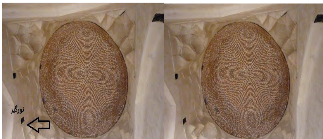
شکل ۱۲- نورگیر ها