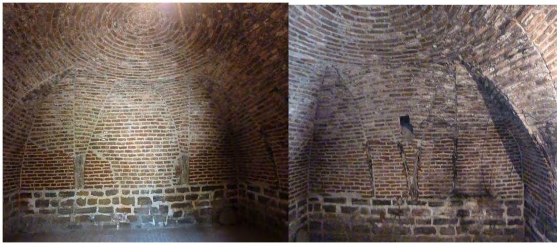
شکل ۱۷-نمای دیگر از اتاق مربعی