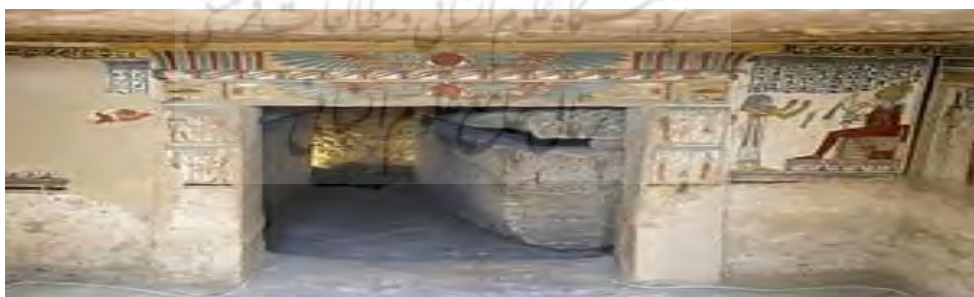
شکل ۵- نمایی از سرداب

بنای تاریخی سه گنبد عبارت است از سکوی بلندی که به شکل استوانه و مدور با دو نوع مصالح سنگ و آجر ساخته شده است. بخش‌های تحتانی بنا تا ارتفاع حدود \frac{3}{6} از سنگ‌های تراش خورده خاکستری رنگ بوده و از این بخش به بالا تمامی مصالح بنا از آجرهای چهار گوش است. این بنا از دو بخش سرداب (محل دفن) و شیون گاه (معبد) تشکیل شده است و دو ورودی مستقل دارد.