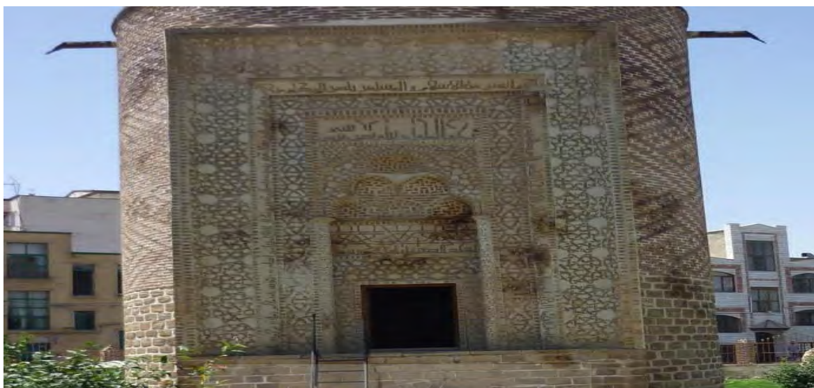
شکل ۸- نمایی از اجر کاری بنا

اما نکته ای که تا حدی رفع اعجاب می کند این است که حروف، خطوط و نقوش هندسی سه گنبد را با سنگ ساخته اند، به این دلیل که معماران عادت داشته اند بعضی قسمت های تزئینی را نسبت به خود بنا متفاوت بسازند، حال اگر این اختلاف را با کاشی مجسم نکرده اند چنانکه در مراغه یا نخجوان چنین بوده است. شاید بدین دلیل که در ارومیه وسایل کار موجود نبوده است.