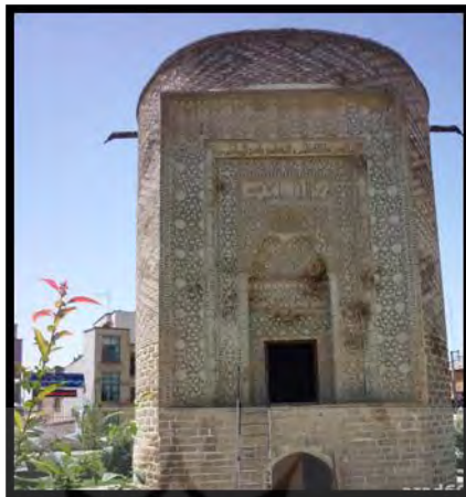
شکل ۴- نمایی از سکو و آجرهای تراش خورده بنا

بنای تاریخی سه گنبد عبارت است از سکوی بلندی که به شکل استوانه و مدور با دو نوع مصالح سنگ و آجر ساخته شده است. بخش‌های تحتانی بنا تا ارتفاع حدود \frac{3}{6} از سنگ‌های تراش خورده خاکستری رنگ بوده و از این بخش به بالا تمامی مصالح بنا از آجرهای چهار گوش است.