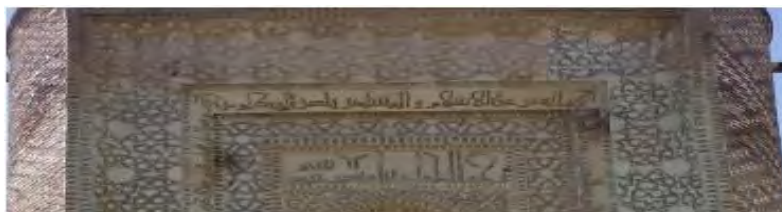
شکل ۳- کتیبه ی سردر بنا