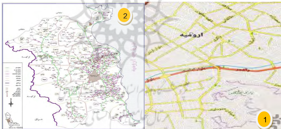
شکل ۱- مشخصات تمام مکان های مهم شهر شکل

مقبره تاریخی سه گنبد که امروزه در میان بافت مسکونی شهر ارومیه قرار دارد ، این بنا در خیابان استاد برزگر ارومیه واقع است روزگاری خارج از برج و باروی شهر ، مجاور دروازه بازارباش درجنوب شرقی شهر ارومیه واقع شده بود، که اکنون به علت گسترش شهر در داخل شهر قرار گرفته است .این بنای ارزشمند متعلق به دوره سلجوقیان و در دوره حکومت اتابکی محمد جهان پهلوان ( ۵۸۱ - ۵۷۰ ه . ق) از اتابکان آذربایجان احداث گردیده است . برخی از مورخان عقیده دارند که از این بنا به عنوان آتشکده استفاده می کرده اند اما هیچ گونه سندی مبنی بر این ادعا وجود ندارد وجه تسمیه ی این بنا موضوعی است که ذهن هر مخاطب را به خود مشغول می کند زیرا در بالای دخمه و اتاق مقبره گنبد سوم نمایان نیست و بازدید کنندگان همواره به دنبال گنبد سوم می باشند.