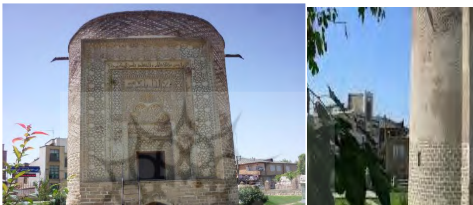
شکل ۶-دریچه شکل ۷-دو ورودی

قطر بنا ۵ متر و ارتفاع آن ۱۳ متر می باشد. ساختمان فعلی دو طبقه است و در چهار سمت آن دریچه‌هایی وجود دارد. طبقه اول به نام سردابه خوانده می شود که دارای پوششی قوس دار است و بدین وسیله از طبقه دوم مجزا می شود. مقبره دارای دو در در طبقه پایین و بالا است که در پایینی آن از جنس آهن در دوره های بعدی به بنا الحاق شده و در طبقه بالایی آن نیز از نوع درهای دو لنگه چوبی است که با توجه به عکس‌های قدیمی این در نیز جزء الحاقات دوره های بعدی بنا به شمار می رود. درب کوچک طبقه اول ۱ متر و ۷۰ سانتیمتر ارتفاع دارد. طبقه دوم که اتاق مقبره خوانده می شود دارای دری به ارتفاع دو و نیم متر است.