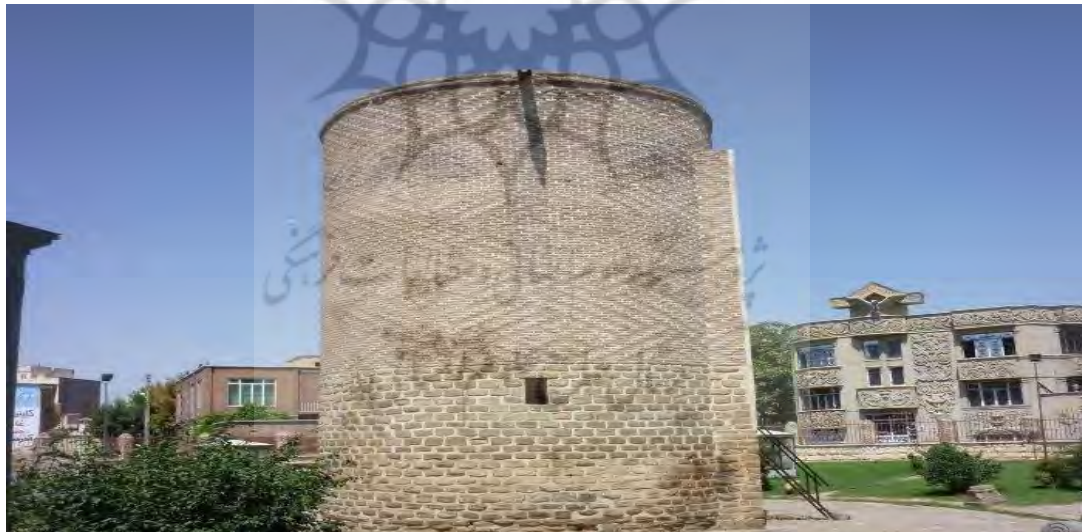
شکل ۱۵-نمایی از ساخت دایره ای این بنا

بنای سه گنبد شهرستان ارومیه به عنوان مقبره یا آرامگاهی از نوع دایره‌ای شکل است. دلیل مهارت معمار سه گنبد آن است که در برجی استوانه‌ای شکل قبلاً اتاقی مربع تعبیه کرده و مجدداً تربیع بنا را با تدابیر معماری مبدل به تدویر کرده آنگاه گنبد را بر آن برافراشته است. نکته مهم هنری این بنا گذشته از گنبد رفیع و مقرنس کاری که در حدود ۹ متر ارتفاع دارد، رنگ آمیزی و تزئینات سنگی است که جلوه خاص به این بنا داده است. بر اساس این گزارش تا قرن نوزدهم به این اثر توجهی نشده بود و برای اولین بار در سال ۱۸۵۲ میلادی از طرف "ن. خانیکوف" این برج به دنیای هنر شناسانده شد و تحت شماره ۲۴۲ جز آثار باستانی ثبت شده است.