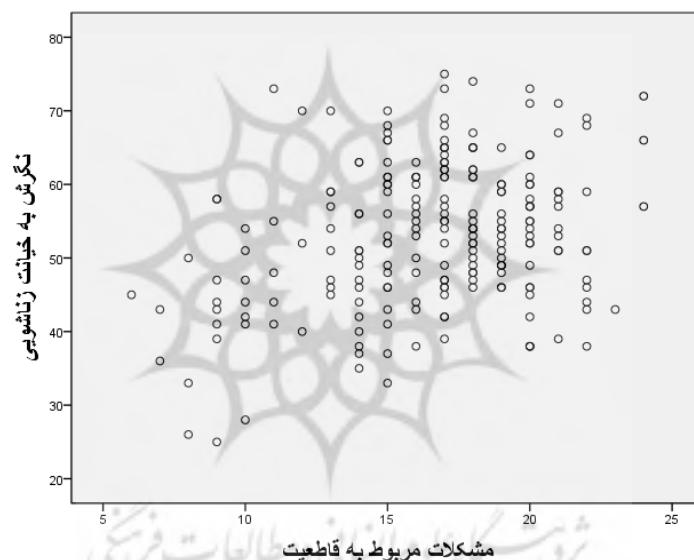
شکل ۱. نمودار نقطه‌ای رابطه نگرش به خیانت زناشویی و مشکلات مربوط به قاطعیت

مفروضه‌های آزمون همبستگی گشتاوری پیرسون، بهنجاری توزیع داده‌ها و خطی بودن رابطه متغیرها است. بنابراین پیش از اجرای آزمون، مفروضه‌ها بررسی شد. رابطه خطی بین متغیرهای این پژوهش (نگرش به خیانت زناشویی، زیرمقیاس‌های مشکلات بین شخصی و اعتیاد به گوشی همراه) با استفاده از نمودار نقطه‌ای بررسی شد. با مشاهده نمودار نقطه‌ای در شکل (۱)، تراکم نقاط حول یک استوانه است و در نتیجه نگرش به خیانت زناشویی و مشکلات مربوط به قاطعیت، رابطه خطی است.