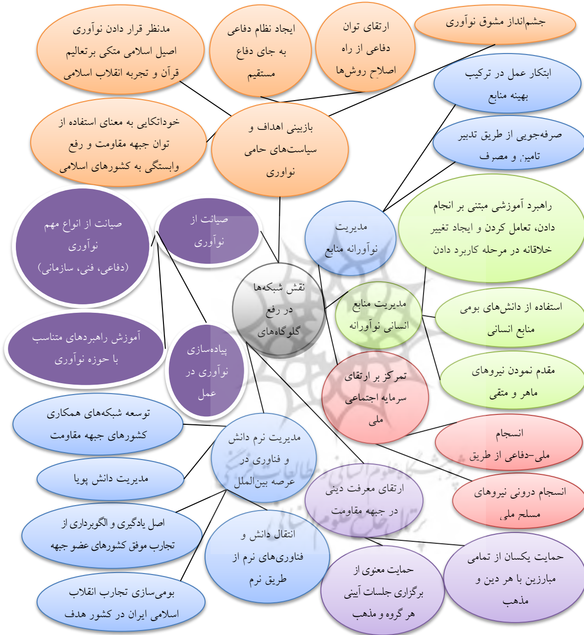
شکل ۴: مضامین استخراج شده شناسایی نقش شبکه‌ها در رفع گلوگاه‌های نوآورانه در دفاع مقدس