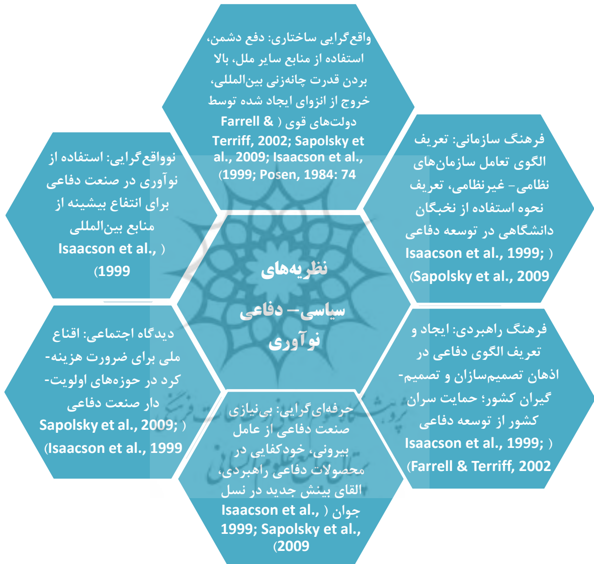
شکل ۲: نظریه‌های سیاسی - دفاعی نوآوری