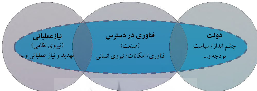
شکل ۳: ابعاد و مؤلفه‌های اصلی نوآوری دفاعی (Finn & Lakhmi, 2010: 21)

پیشینی در موضوع مورد پژوهش به صورت عام، الگویی کلی و نسبتاً جامع که ابعاد کلیدی و بازیگران نوآوری دفاعی را مشخص می‌سازد، مورد نظر این پژوهش بوده است: