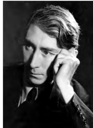
تصویر ۱. هربرت رید

اواخر دههٔ ۱۹۳۰ جستجوی عمیق در مورد زیبایی‌شناسی ضد خودکامگی که تاکید بر اخلاق فردی جایگاه والایی داشت در بریتانیا مطرح شد، همزمان آنارشیست‌ها شروع به نقد زیبایی‌شناسی مارکسیستی که تحت رهبری اتحاد جماهیر شوروی تدوین شده بود کردند. دههٔ ۱۹۳۰ حزب کمونیسم در اروپا و آمریکای شمالی سبک منحصر به فرد رئالیسم سوسیالیستی ۱۸ را به خدمت گرفت؛ سبکی که تولیدات آثار هنری در جهت اشاعهٔ ایدئولوژی مدون شده توسط دستگاه قدرتمند حزب بود. آن‌ها ادعا داشتند سبک هنریشان در ضدیت با ارزش‌های زیبایی‌شناسانهٔ فاشیسم است؛ هرچند، از دیدگاه یک آنارشیست، اقتدارگرایی سیاسی، منطق درونی خودش را دارد. این استدلال هربرت رید در نقد نوآورانه‌اش آنارشیسم و شعر ۱۹ بود. با تأملی بر وضعیت هنر در آلمان نازی و اتحاد جماهیر شوروی، هربرت رید دریافت هر دو رژیم، تمامی سبوه‌های جامعه از جمله هنر را به خدمت کنترل مرکزی دولت درآورده‌اند، خصیصه‌ای که او به عنوان «توتالیتر» شناسایی کرد. ۲۰ کمونیست‌ها دستاوردهای سوسیالیسم دولتی را جشن گرفتند در حالی که هنر نازی آرمان‌های نژادپرستی ناسیونالیستی را گرامی می‌داشت. روش هر دو یکسان بود. هر دو جنبش، ایدئولوژی را به وسیله هنر و از طریق روش‌های از پیش تعیین شدهٔ «رئالیسم بلاغی، عاری از نوآوری، فاقد تخیل، چشم پوشی از ظرافت و تاکید بر بدیهیات» دیکته می‌کردند. ۲۱ سرکوب هرگونه استقلال هنری در جامعه نتیجه‌ای بود که خدمت هنر در راستای ایدئولوژی به ارمغان آورد. از این رو کمپین‌هایی وحشیانه علیه هنرمندان نافرمان بدون توجه به انگیزه‌هایشان در آلمان و روسیه صورت گرفت. نقطهٔ مقابل این رویکرد عملگرایانه در عرصه آفرینش هنری، یک نوآوری شعرگونه بود که تمامی فرم‌های ارتجاعی هنر را از بین برد.