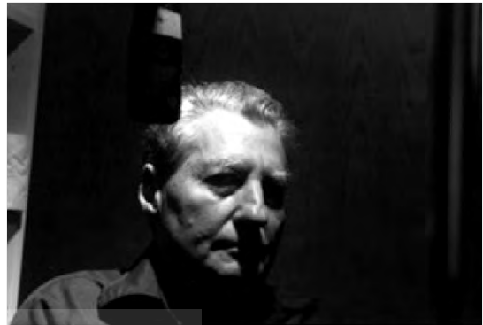
تصویر ۵. جکسون مک لو

ظاهراً زیبایی‌شناسی پچن و سیاست‌هایی که منعکس می‌کرد، مکملی بر فعالیت‌های دلینجر بود؛ اما کارایی اخلاقی این رویکرد قرار بود زیر سوال برود. سال ۱۹۴۵ جکسون مک لو (تصویر ۵) با منتشر کردن یک مقالهٔ قابل توجه در مجلهٔ مقاومت ۴۱ (که در دوران جنگ جهانی دوم با نام چرا؟ ۴۲ فعالیت می‌کرد)، مسیر جدیدی را ترسیم کرد.