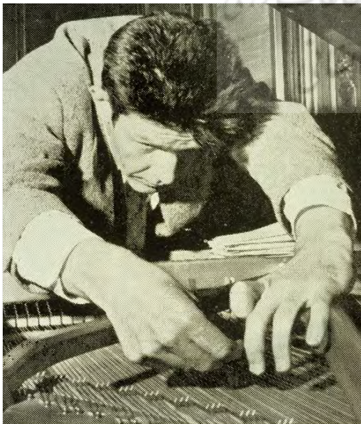
تصویر ۶ جان کیچ

نمونه واضح و روشن چنین کاری اجرای قطعه چهار دقیقه و سی و سه ثانیه ۵۹ اثر کیچ در آگوست ۱۹۵۲ است. این رویداد در «موریک» ۶۰ انجمنی از موسیقیدانان، مجسمه‌سازان، نویسندگان و نقاشان برگزار شد. جامعه‌ای که دعوت شده بودند تا در کلبه‌های تابستانی در مجاورت دهکده وودستاک، نیوورک، به صورت آزاد و رایگان زندگی و کار کنند. ۶۱ قطعه کیچ که به عنوان سونات سه موومانی برای پیانو معرفی شده بود توسط دیوید تودور اجرا شد. ۶۲ زمان اجرا - چهار دقیقه و سی و سه ثانیه به وسیله تاس ریختن مشخص شد. تودور پشت پیانو نشست، در کلاویه‌های پیانو را بست و برای مدتی در این وضعیت باقی ماند، سپس آن را باز کرد تا پایان موومان اول را نشان دهد. او این کار را دوبار دیگر انجام داد و سپس از صحنه خارج شد. سالن اجرا در جنگل قرار داشت و یک طرف آن رو به فضای باز بود که اجازه می‌داد صدای جیرجیرک، باد و نویزهای حاصل از پچ‌پچ و جابه‌جایی صندلی مخاطبان درهم آمیخته شوند. این محتوای آهنگسازی کیچ بود که حضور مخاطب آن را سرشار از معنا می‌کرد. ۶۳