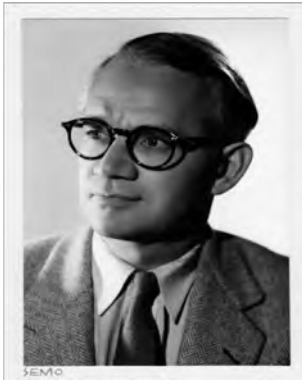
تصویر ۲. جورج وودکاک

در یک مقالهٔ کلیدی در مورد رادیکالیسم ادبی برای مجلهٔ ادبی-آنارشیستی انگلیسی، اکنون ۱۵ شاعر و مخالف جنگ جورج وودکاک (تصویر ۲) استدلال هربرت رید را توسعه داد؛ او اظهار کرد که اگر به خدمت درآوردن آثار بدیع در جهت اهداف سیاسی بن بست باشد، آفرینش هنر در غیاب چنین فشارهایی الزاماً رادیکال نیست. وودکاک نتیجه‌گیری کرد افراد زیادی در حکومت‌های دموکراتیک وجود دارند که از کار کردن برای بازار سرمایه‌داری راضی و خشنود هستند، آثار خودشان را مطابق با سلیقهٔ بورژوازی و موسسات فرهنگی تولید می‌کنند. ۱۶ آن‌ها ماهیت وجودی و خلاقیت خود را جهت سازش به خطر انداخته‌اند، توانایی رادیکال بودن که تنها سلاحشان محسوب می‌شود را در رابطه‌ای فرعی مطیع اوامر قدرت‌های موجود کرده‌اند. وودکاک با برداشت از نقد رید در مورد سرکوب به وسیلهٔ رژیم‌های توتالیتر، نتیجه می‌گیرد مقیاس اندازه‌گیری رادیکالیسم استقلال است. «نویسنده آزاد با بکارگیری تواناییش می‌تواند نماینده یک نیروی انقلابی باشد.» او افزود: «کسی که حاضر است در مورد هر موضوعی بنویسد، موظف است براساس یک درک صادقانه از واقعیت علیه بی‌عدالتی و دروغ عمل کند، حتی اگر او برای هدفی خاص همچون تسریع تغییرات اجتماعی ننویسد.»