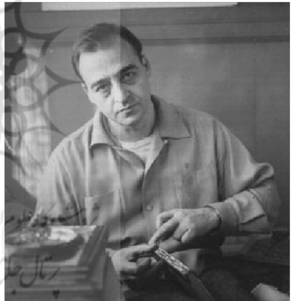
تصویر ۳. کنت پچن

خویشاوندی هستند، شکار می‌شود. نکته قابل توجه این است که هنر تجاری‌سازی شده، دروغ و فریبکاری را بر نویسنده و خواننده تحمیل می‌کند. ۳۹ پس از رفع موانع، شیوه نگارش منحصر به فرد پچن با چه چیز ارتباط برقرار می‌کند؟ بیشتر از هر چیز با جهان اخلاقی رک و بی‌پرده او. رمان مجلهٔ آلبیون مهتاب مملو از اعتراضات گله‌مند علیه جنگ و خشونت است که به طور مستقیم خطاب به خوانندگان می‌گوید: «ما باید چه کنیم، به کجا مراجعه کنیم؟ نفرت زیادی در این جهان وجود دارد. من حاضرم برای متوقف شدن جنگ هزار مایل سینه‌خیز بروم.» ۴۰ پچن متن و صدای نویسنده را به عنوان اجزایی جدا نشونده عرضه می‌دارد و تلاش می‌کند از نوآوری‌های فرمالی همچون تغییرات چاپی برای تاکید، روایت‌های خودمختار در صفحه‌ای یکسان و در یک نمونه، گنجاندن نقاشی مردی حلق‌آویز شده در گفتمانی بین شکنجه‌گران که پیرامون جنون اخلاقی شکنجه کردن بحث می‌کنند، استفاده کند. ۴۱