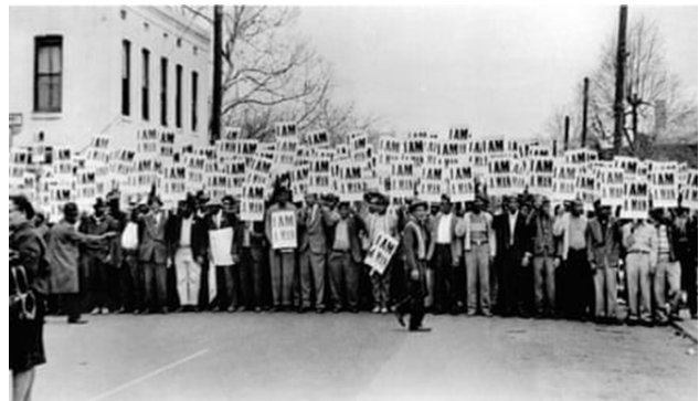
تصویر ۴۲. اعتصاب رفته‌گران در ممفیس، ۱۹۶۸، ۲۵