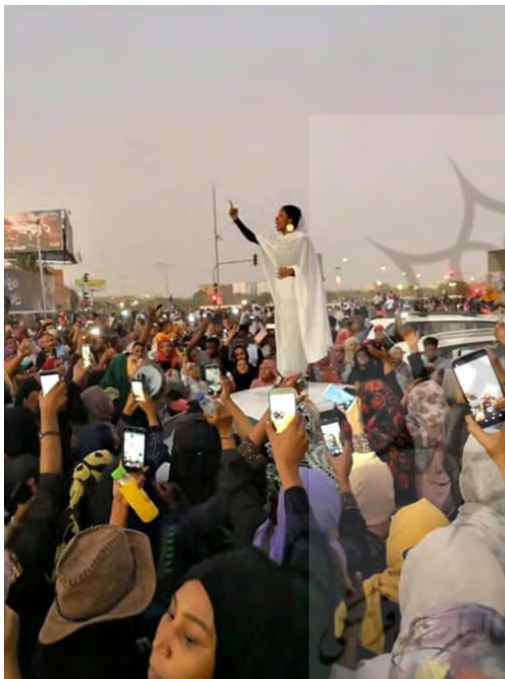
تصویر ۴۱. علا صلاح نماد سودان جدید می‌شود، ۲۰۱۹. ۶۱

زنان نقش قدرتمند و مشهودی در اعتراضات داشتند. برای هارون، این تصویر پیامی در درون خود داشت که زنان می‌توانند رهبری کنند. صلاح به سخنرانی در سازمان ملل ادامه داد و یکی از مدعیان جایزه صلح نوبل شد.