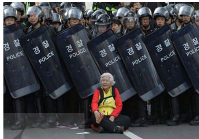
تصویر ۳۹. زنی سرعت پلیس ضد شورش سئول را کند می‌کند، ۲۰۱۵.

یاد کردند، چترها به نماد قدرتمند جنبش استقلال تبدیل شدند که توسط معترضان حمل می‌شدند. همچنین در اینستالیشن‌های هنری و میم‌های بی‌شماری نیز از چتر در همین مفهوم استفاده می‌شد (تصویر شماره ۴۰).