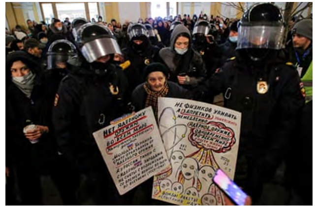
تصویر ۴۵. یک زن روسی از اوکراین دفاع میکند، ۲۰۲۲ ۷۵

صلح» بره‌های اعتراضی دست‌ساز خود را در دست گرفته است در حالی که انبوهی از هواداران را میتوان در پس زمینه مشاهده کرد.