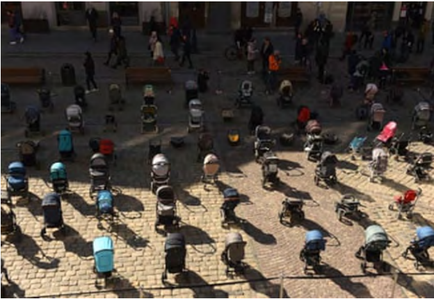
تصویر ۳۷. کالسکه‌ها در شهر لویو، ۲۰۲۲، عکاس: یوری دی‌اچیشین ۶۲

برآورد رسمی بیش از ۳۰۰ کودک است (تصویر شماره ۳۷).