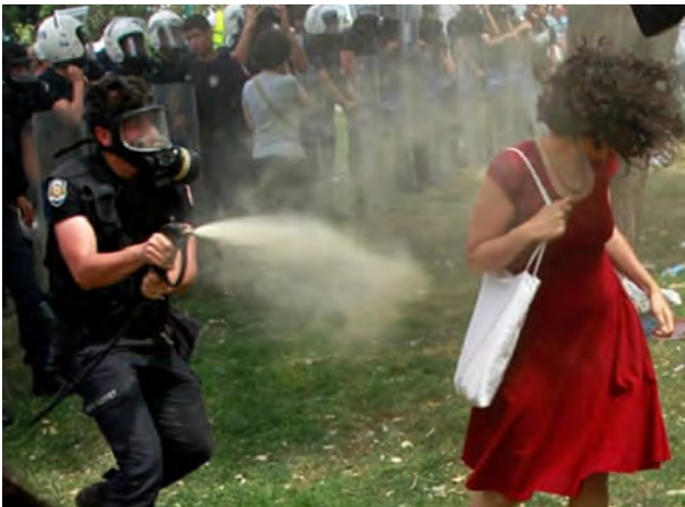
تصویر ۵. بانوی سرخ پوش در پارک گزی، ۲۰۱۳، عکاس: عثمان اورسال ۱۱ ، روبرتز

جنبش تبدیل شد. تصاویری از «بانوی سرخ پوش» بر روی پوسترها و گرافیک‌های آنلاین ظاهر شد و اعتراضات را در سراسر کشور برانگیخت.