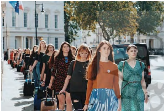
تصویر ۱۶. راهپیمایی زنان ایرلندی برای حقوق سقط جنین، ۲۰۱۶، عکاس: الستار مور ۳۴

افرادى که مى‌پرسند آیا اعتراض به نتیجه‌ای مى‌رسد، اثر پروانه‌ای را نمى‌بینند: غریبه‌هایی در این اعتراضات ملاقات مى‌شوند، جزئیات را عوض یا به نوعی بهتر کرده و کمپین راه‌اندازی مى‌کنند. این دقیقاً همان چیزی است که اینجا اتفاق افتاده است. کمپین حقوق سقط جنین با نمایندگان مجلس ملاقات کرد. در ادامه پرونده‌های حقوقی را راه‌اندازی کرد. برای اهداف طرفدار انتخاب پول جمع‌آوری کردند، تظاهرات برگزار کرد و رای دهندگان ایرلندی را در خارج از کشور بسیج کردند. لیتل می‌گوید من خودم را در این عکس نمی‌بینم. بلکه زنان جوانی را می‌بینم که عصبانی و آماده بازپس‌گیری قدرت هستند. ما غیرقابل توقف به نظر می‌رسیم و این ما بودیم!