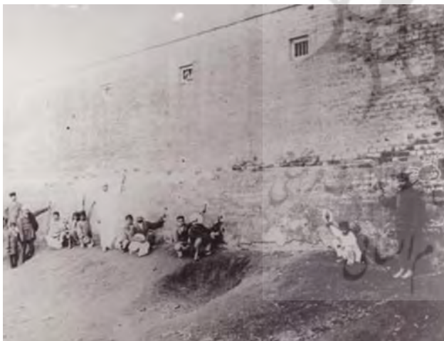
تصویر ۱۴. عواقب قتل عام آمریتسار، ۱۹۱۹ ۲۲

به عقیده کریستوفر پینی، مورخ هنر، کار ویرکار لحظه بسیار مهمی در تاریخ عکاسی است. در قرن نوزدهم از عکاسی به عنوان ابزاری برای قدرت سیاسی یا مسائل علمی استفاده می‌شد، اما در قرن بیستم عکاسانی مانند ویرکار شروع به چالش کشیدن ساختارهای قدرت اطراف خود به کمک عکاسی کردند. پینی می‌گوید: ویرکار بدون شک تصاویرش را در بردارنده مبارزه با ظلم استعماری می‌داند. او بین ویرکار و مردمان امروزی که از هر صحنه‌ای عکاسی می‌کنند، پیوندی به وجود می‌آورد که نتیجه مستندنگاری آنها از تخلفات قدرتمندان است.