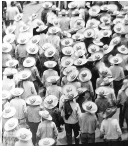
تصویر ۱۷. اول ماه مه در مکزیک، ۱۹۲۶، عکاس: تینا مودوتی ۳۵

«داستان ندیمه»، اثر مارگارت اتوود ۳۸ است که به یک برنامه تلویزیونی تبدیل شد و در آن درباره رژیم‌های تئوکراتیک صحبت شد که آزادی‌های اولیه زنان را سلب می‌کند. آیا می‌توان تصور کرد که هنوز این نوع نگرش وجود داشته باشد؟ در سال‌های اخیر، شنل قرمزی‌ها و کلاه سفیدهایی که توسط خدمتکاران پوشیده می‌شوند، به نوعی نماد آشنا در اعتراضات مربوط به مسائل زنان در سراسر جهان تبدیل شده است. زنانی که در تصویر شماره ۲۰ خارج از ساختمان کنگره آمریکا ایستاده‌اند، علیه لایحه‌ای تظاهرات می‌کنند که به دنبال کاهش هزینه‌های ارائه‌دهنده مراقبت‌های بهداشتی جنسی بودند.