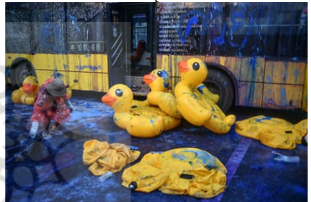
تصویر ۲۵. اعتراضات اردک لاستیکی تایلندی، ۲۰۲۰ ۴۶

این عکس مبهم (تصویر شماره ۲۶) توسط شومی توماتسو، عکاس ژاپنی، چهره‌ای نامفهوم و ناشناس را نشان می‌دهد که در اعتراض به جنگ ویتنام در حال پرتاب سنگ است. توماتسو به خاطر موضوعاتش که شامل تغییرات گسترده در ژاپن پس از جنگ، آسیب‌های طولانی بمباران اتمی هیروشیما و ناکازاکی و نیز ترکیب بندی‌های غیرمعمول که الهام بخش یک نسل از عکاسان در ژاپن بود، شهرت دارد.