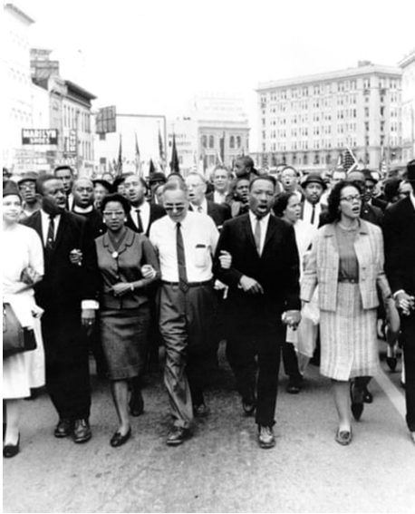
تصویر ۱۹. مارتین لوتر کینگ و راهپیمایی مونته‌گومری، ۱۹۶۵ ۳۷

شهرت آن‌ها در سرتاسر جهان شد، اما عواقب بدی برای هر دو داشت. با این حال، کارلوس پشیمان نبود: من یک تعهد اخلاقی داشتم که کاری کنم. اخلاق نیرویی بسیار بزرگتر از قوانین و مقرراتی بود که آن‌ها داشتند.