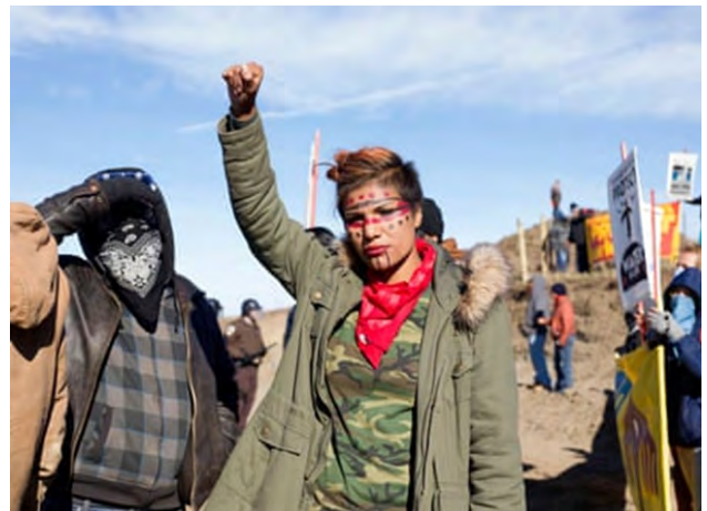
تصویر ۲۴. منطقه استندینگ راک در مقابل خط لوله دسترسی داکوتا، ۲۰۱۶،