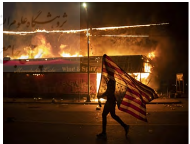
تصویر ۲۲. عواقب قتل جورج فلویید، ۲۰۲۰، عکاس: خولیو کورتز ۴۲ ، آسوشیتد پرس

خولیو کورتز تصویر شماره ۲۲ را قبل از نیمه شب ۲۸ مه ۲۰۲۰، یعنی سومین روز اعتراضات پس از قتل جورج فلویید در مینیاپولیس ثبت کرد. آنچه که به عنوان نماد در این عکس مشاهده می‌شود این است که هیچگاه نباید پرچم را وارونه به نمایش درآورد. مگر اینکه بیانگر نوعی ناراحتی شدید برای زندگی یا دارایی باشد. این عکس حس عمیق خشم و بی‌عدالتی را منتقل می‌کند. که به جنبش توده‌ای اعتراضات ضد نژادپرستی در سراسر جهان دامن می‌زند.