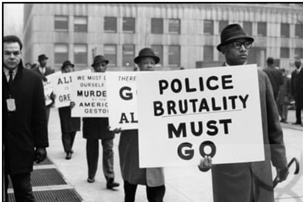
تصویر ۴۷. مسلمانان سیاه‌پوست در برابر خشونت پلیس، ایستادگی می‌کنند، ۱۹۶۳، عکاس: گوردون پارکس ۷۷

یعنی اقدام پلیس لس آنجلس در تیراندازی به هفت مرد سیاه‌پوست غیرمسلح در خارج از مسجد ملت اسلام. تصویر شماره ۴۷، بخشی از عکس‌های سریالی او از مستند کردن جنبش مسلمانان سیاه‌پوست است. پس از اینکه چندین روزنامه‌نگار سفیدپوست نتوانستند با رهبران گروه ارتباط برقرار کنند، این کار به پارکس واگذار شد.