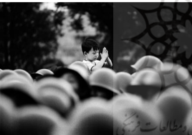
تصویر ۸. میدان سرخ، ۱۹۸۹، پسر خردسال ...، عکاس: داریو میتیدیری ۱۶

این عکس به نمادی ارزنده از بی‌گناهی معترضانی تبدیل می‌شود که در آن شب به شدت مورد سرکوب قرار گرفتند. میتیدیری که هرگز نام پسری را که در عکس قرار دارد یاد نگرفت، از عکس‌های خود در وقایع میدان تیان‌آن‌من به‌عنوان نمونه‌ای واقعی از اهمیت رسالتی که خبرنگاران عکاس انجام می‌دهند، نام میبرد. او آن را با وضعیت کنونی اوکراین مقایسه می‌کند: ما پروپاگاندای روسی را می‌بینیم، اما بقیه جهان به