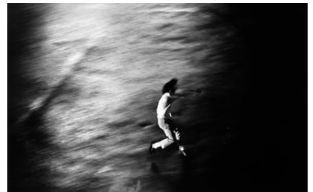
تصویر ۲۶. اعتراض، توکیو، ۱۹۶۹، عکاس: شومی توماتسو ۴۷

این عکس مبهم (تصویر شماره ۲۶) توسط شومی توماتسو، عکاس ژاپنی، چهره‌ای نامفهوم و ناشناس را نشان می‌دهد که در اعتراض به جنگ ویتنام در حال پرتاب سنگ است. توماتسو به خاطر موضوعاتش که شامل تغییرات گسترده در ژاپن پس از جنگ، آسیب‌های طولانی بمباران اتمی هیروشیما و ناکازاکی و نیز ترکیب بندی‌های غیرمعمول که الهام بخش یک نسل از عکاسان در ژاپن بود، شهرت دارد.