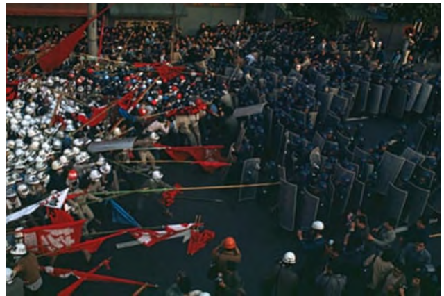
تصویر ۲۸. دانشجویان و کشاورزان ژاپن در برابر فرودگاه جدید، ۱۹۷۱

مراسم مت‌گالا در نیویورک به خاطر ارائه لباس‌های عجیب و غریب و مهمانان ثروتمند معروف است. طبق گزارش‌ها قیمت بلیط آن حدود ۳۵۰۰۰ دلار است. در سال ۲۰۲۱، اوکازویو، نماینده دموکرات کنگره با لباسی که توسط طراح و فعال مدنی، آرورا جیمز طراحی شده و روی پشت آن نوشته شده بود «بر ثروتمندان مالیات ببندید» جنجال ایجاد کرد. منتقدان او را به ریاکاری متهم کردند. اما این نماینده معتقد بود که این کار ارزشمند است، زیرا بحث مطالبه‌گرانه‌ای را در مورد اخذ مالیات از ثروتمندان در