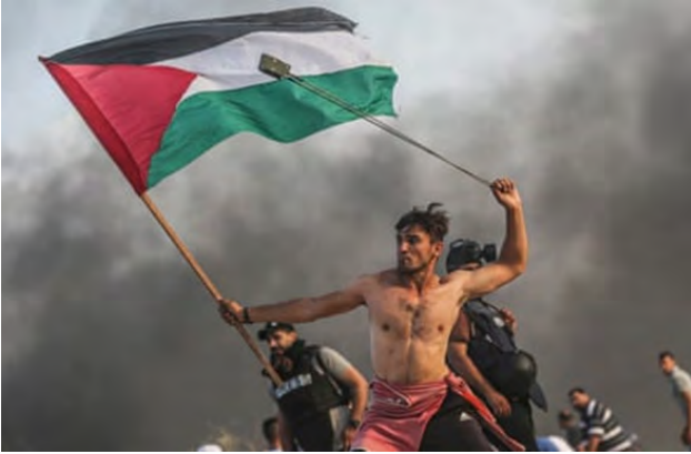
تصویر ۱۱. مقاومت در نوار غزه، ۲۰۱۸، عکاس: مصطفی حسونه ۲۲ ، گتی