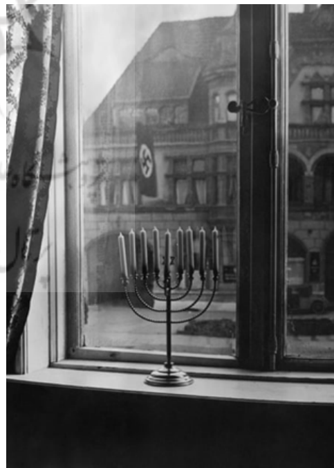
تصویر ۳۶. منورای سرکش، ۱۹۳۱، عکاس: راشل پوزنر ۶۱

در ۱۸ مارس ۲۰۲۲، ۲۳ روز پس از جنگ روسیه علیه اوکراین، ۱۰۹ کالسکه خالی در یکی از میدان‌های شهر لویو گذاشته شد که هر کدام نشان دهنده یک کودک کشته شده بود. امروز