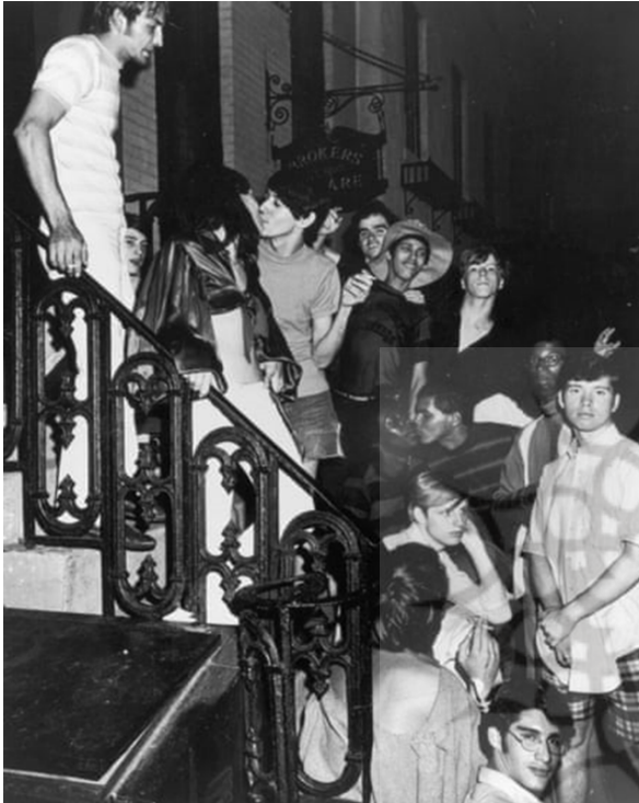
تصویر ۲۳. پس از حمله به استون وال، ۱۹۶۹

۲۳ جوانانی را نشان می‌دهد که پس از حمله به مسافرخانه و پلمپ آن، در بیرون مسافرخانه جمع شده بودند. عکس فضای جشنی را به تصویر می‌کشد که همجنس‌گرایان و ترنس‌ها از تسلیم شدن در برابر ظلم و ستم دولت خودداری کردند. اولین راهپیمایی با شکوه همجنس‌گرایان یک سال بعد برای بزرگداشت این رویداد برگزار شد.