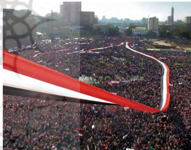
تصویر ۱۵. جمعه پیروزی در میدان تحریر، ۲۰۱۱، عکاس: لارا بلدی ۳۳

عکس، در میان مردم و در پایین آپارتمان عکاسی می‌کرد. اما در ۱۸ فوریه که خواست این منظره را از بالا ببیند. یک هفته از سرنگونی مبارک می‌گذشت، بنابراین آن روز، جمعه پیروزی نام گرفت. یک روز آفتابی زیبا بود، او ادامه می‌دهد: هنگامی که مردم را در میدان تماشا می‌کرد، دو مرد جوان در کنار او ظاهر شدند. آن‌ها به تازگی یک عدل عظیم پارچه از بازار پارچه خریده بودند، «حدود ۱۰۰ متر پرچم مصر؛ دو طرف پارچه را گرفتند و انداختند پایین. در زمان کوتاهی در میان جمعیت راه باز کرد. به محض رسیدن به میدان، مردم آن را گرفتند. دقایقی بعد به پارچه‌های دیگر گره خورد و بلادی عکس را گرفت: همه چیز خیلی سریع اتفاق افتاد. برای او با نگاهی به گذشته این عکس نشان‌دهنده نقطه عطفی در قیام، پیروزی، اوج انقلاب، قبل از ظهور واقعیت و آغاز شکافها و تفاوت‌های اجتماعی است. وقایع ۱۰ سال گذشته به او یاد داده است که تغییر با قیام نمی‌شود. آنچه قبل و بعد از آن اتفاق می‌افتد به همان اندازه یا بیشتر از آن مهم است. انقلاب یک فرآیند مستمر است.