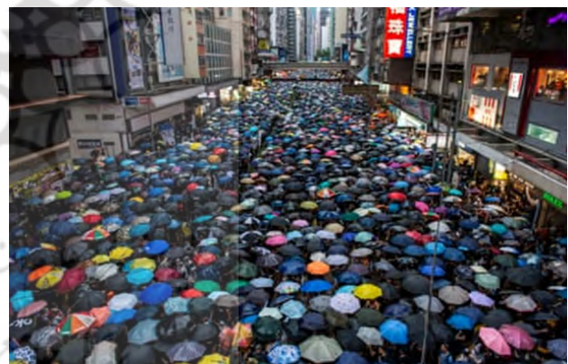
تصویر ۴۰. جنبش چترهنگ کنگ، ۲۰۱۹. ۶۶

لانا هارون، عکاس تصویر شماره ۴۱ می‌گوید «ما به دنبال آزادی و رویاهایمان بودیم. به دنبال سودانی جدید بودیم. در ابتدا، نیروهای وفادار به رییس جمهور عمر البشیر ۶۷ معترضان را با خشونت سرکوب کردند. اما سپس برخی از اعضای ارتش شروع به دفاع از معترضین کردند و فضای امنی را در خارج از کاخ ریاست جمهوری ایجاد کردند. مردم از سراسر سودان به آنجا سفر کردند. عکاس هر روز آنجا بود و عکس می‌گرفت. «این حس کردن خود تاریخ بود.» یک روز، متوجه شد که مردم به سمت شخصیتی هجوم می‌آورند که در حال خطاب به جمعیت بود. جوانی ۲۲ ساله به نام علا صلاح ۶۸ . هارون چهار عکس از آن صحنه گرفت و بهترین عکس را به صورت