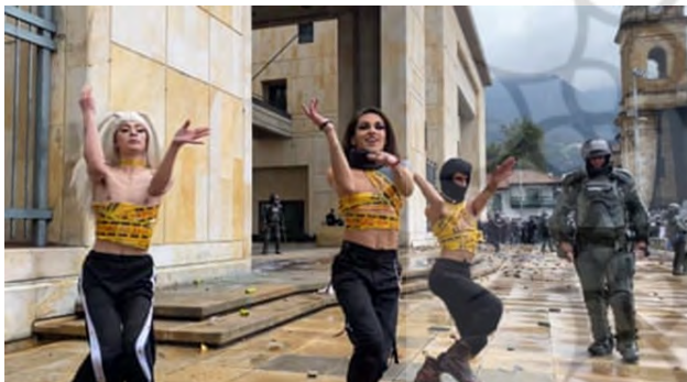
تصویر ۳۴. کلمبیایی‌ها به دنبال تغییر هستند، ۲۰۲۱، عکاس: کارن مونتانو ۵۶

در تصویر شماره ۳۴، سه نفر چند متر دورتر از اسما، پلیس ضدشورش بدنام کلمبیا در حال رقصیدن بودند. آن فعال در ادامه می‌گوید: در آن لحظه ترس زیادی در چشمان دوستانم دیدم. من نیز آن را احساس کردم، البته در ادامه همه چیز خوب پیش رفت، اما می‌توانست فاجعه‌بار باشد. رقصنده‌ها برای دقایقی ادامه دادند و توسط دیگر معترضان تشویق شدند. در ابتدا، پلیس مطمئن نبود که چه کاری باید انجام دهد، اما لحظاتی بعد، این اقدام به هرج و مرج تبدیل شد: مواد منفجره، سنگ و سلاح. پس ما مجبور شدیم فرار کنیم. تأثیر اعتراض برای جامعه دگرباشان در کلمبیا حماسی بود. این لحظه‌ای از توانمندی و قدرت ما بود. اگر در آینده کتاب‌های تاریخی وجود داشته باشد، مطمئناً در آن‌ها خواهیم بود.