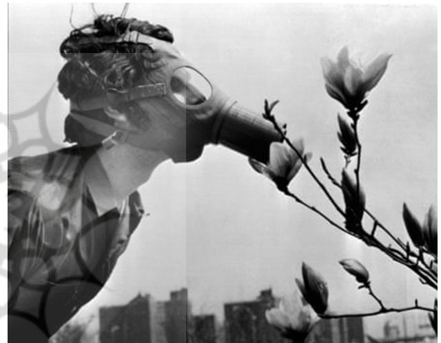
تصویر ۲۹. اولین روز زمین