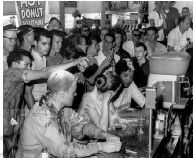
تصویر ۳۶. مقاومت در پیشخوان ناهار وول ورث، ۱۹۶۳، عکاس: فرد بلک ول ۶۵ . آسوشیتد پرس

از به قدرت رسیدن هیتلر - زمانی که همسرش با شجاعت منورای خود را در پشت پنجره، رو به ساختمانی که با پرچم‌های نازی تزئین شده بود، روشن کرد. پوزنرها دو سال بعد از آلمان فرار کردند (تصویر شماره ۳۶).