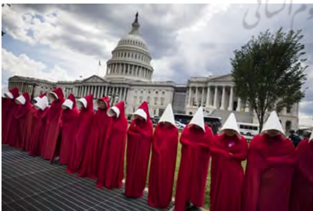
تصویر ۲۰. خدمتکاران به واشنگتن می‌روند، ۲۰۱۷ ۳۹

در ۲۵ مارس ۱۹۶۵، مارتین لوتر کینگ، پس از راهپیمایی پنج روزه که در سلما آغاز شد، هزاران معترض حقوق مدنی را به سمت کنگره در مونته‌گومری رهبری کرد. ۲۵۰۰۰ نفر در سراسر راهپیمایی ۸۰ کیلومتری شرکت کردند و خواستار حق رای شدند. مونتا اسلیت به عنوان عکاس مجله آبنوس این رویداد مهم را پوشش داد (تصویر شماره ۱۹).