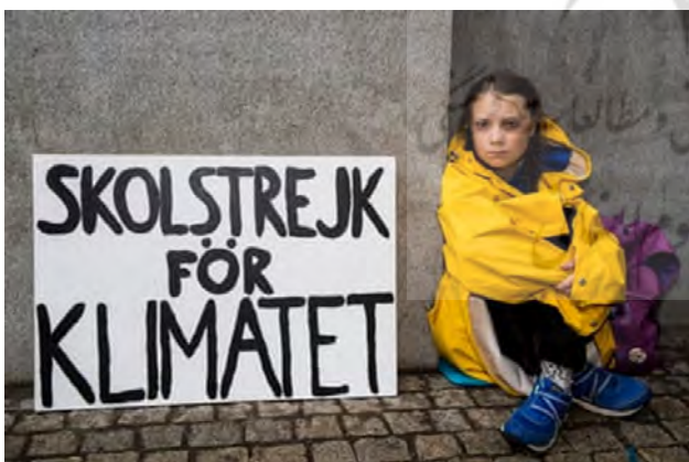
تصویر ۴۴. گرتا تونبرگ اعتصاب می‌کند، ۲۰۱۸، عکاس: مایکل کامپانلا ۲۳ ، گاردین

آب و هوایی سازمان ملل در نیویورک، تونبرگ رهبران جهان را به دلیل شکست آن‌ها در ایجاد هرگونه تغییر معنادار محکوم کرد. تونبرگ درباره واکنش مردم می‌گوید: درست همانند یک فیلم تخیلی و غیرواقعی بود که نمی‌توانست خوب باشد. اما همچنین بسیار امیدوارکننده است؛ زیرا نشان می‌دهد که غیرمنتظره‌ترین چیزها می‌توانند در مدت زمان بسیار کوتاهی اتفاق بیفتند. تونبرگ در مورد اینکه چرا جوانان چنین نقش مهمی در اعتراضات آب و هوایی ایفا کرده‌اند، می‌گوید: فکر کنم به صورت طبیعی در ذهن ما شورش قرار دارد. اما باید قبول کرد این بچه‌ها هستند که در این دنیا زندگی می‌کنند و عواقب آن را خیلی بیشتر تجربه می‌کنند. تونبرگ پس از استراحت یک ساله از آموزش و تمرکز بر فعالیت‌های آب و هوایی، در آستانه ورود به سال آخر مدرسه است و اعتراض خود را با حذف کلاس‌های هر جمعه ادامه می‌دهد. او با نگاهی به عکس خود می‌گوید که هنوز بنر را دارد، اما اکنون آن را در خانه نگه می‌دارد. وی به شوخی می‌گوید: بارانی زردی که از پدرش قرض گرفته بود همچنان متعلق به پدرش است، اما من هنوز آن را می‌دزدم. از تونبرگ پرسیدند که اگر می‌توانست به دختری که در عکس است چیزی بگوید، چه می‌گفت؟ او با خنده می‌گوید: احتمالاً می‌گویم: قلاب بافی و بافتن را زودتر شروع کن، چونکه واقعاً سرگرم‌کننده است و متمرکز می‌کند. اما احتمالاً این پاسخی نیست که شما می‌خواهید (تصویر شماره ۴۴)!