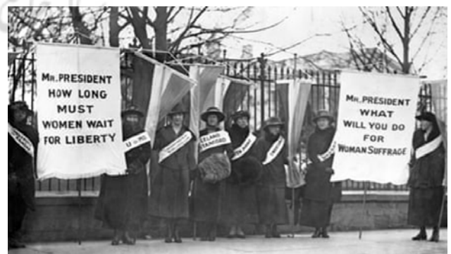
تصویر ۴۶. حق رای در کاخ سفید، ۱۹۱۷

در ۱۰ ژانویه ۱۹۱۷، ده‌ها تن از زنانی که خواهان حق رای بودند بی‌سر و صدا در مقابل دروازه‌های کاخ سفید جمع شدند. آن‌ها اولین گروهی بودند که در محل اقامت ریاست جمهوری به تظاهرات پرداختند. آن‌ها که نگهبانان خاموش نامیده می‌شوند، بره‌هایی در دست داشتند که از رئیس‌جمهور وودرو ویلسون ۷۶ می‌خواستند از اصلاحیه قانون اساسی که به زنان حق رای می‌دهد، حمایت کند. دو هزار معترض به اعتصاب پیوستند، که تا ۴ ژوئن ۱۹۱۹ ادامه یافت. زمانی که در نهایت اصلاحیه نوزدهم تصویب شد، بسیاری از آن‌ها دستگیر و زندانی شدند؛ گزارش‌های مربوط به بدرفتاری با زندانیان، نقش کلیدی در جلب حمایت عمومی از حق رای زنان داشت (تصویر شماره ۴۶).