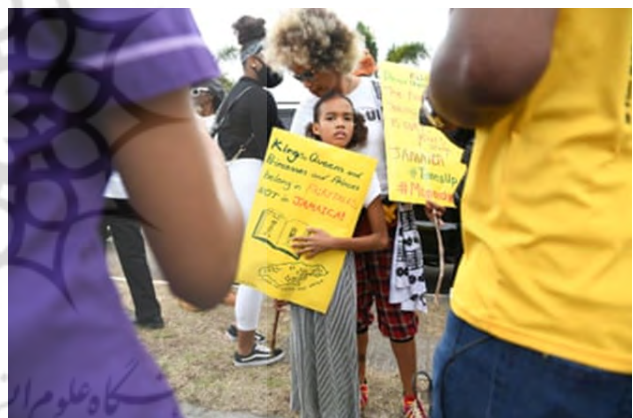
تصویر ۴۳. خانواده سلطنتی در جامائیکا، ۲۰۲۲، عکاس: ریکاردو ماکین ۲۶ ، گتی

شاهزاده ویلیام ۲۶ و کیت میدلتون در اوایل سال ۲۰۲۲ سفری ناموفق به کارائیب داشتند، جایی که معترضان خواستار غرامت، عذرخواهی رسمی و قطع روابط با بریتانیا بودند. در حین این دیدار، جامائیکا طرحی را در دست بررسی قرار داد که در آن بر کنار گذاشتن پادشاه یا ملکه بریتانیا به عنوان رئیس کشور خودشان تاکید شده بود (تصویر شماره ۴۳).