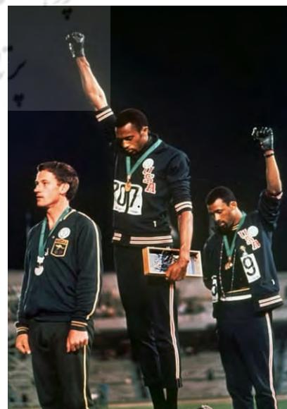
تصویر ۱۸. قدرت سیاه روی سکوی المپیک، ۱۹۶۸، عکاس: آسوشیتد پرس ۳۶

عکاس مگنوم، تظاهراتی را در مرکز کیف که به برکناری ویکتور یانو کوویچ ۴۰ ، رئیس‌جمهور طرفدار روسیه انجامید، پوشش داد.