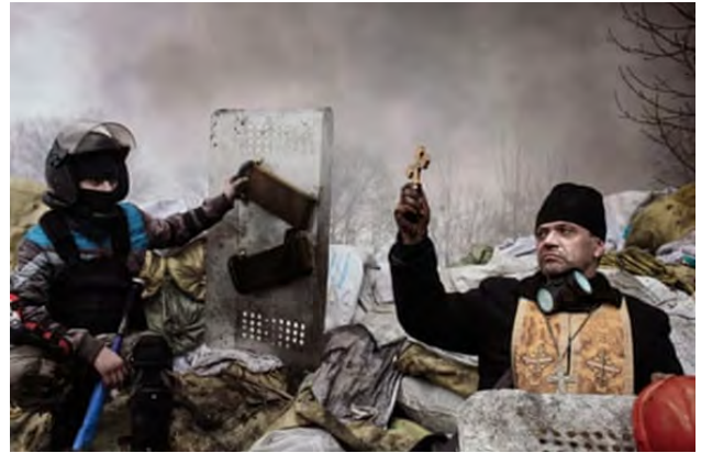
تصویر ۲۱. تقدیس معترضان، ۲۰۱۴، عکاس: ژروم سسینی ۴۱ /آژانس مگنوم

او وقایع را با مجموعه‌ای از تصاویر فوق‌العاده دراماتیک و ناراحت‌کننده ثبت کرد. در تصویر شماره ۲۱، یک کشیش ارتدوکس، معترضان را بر روی یک سنگر برکت می‌دهد.