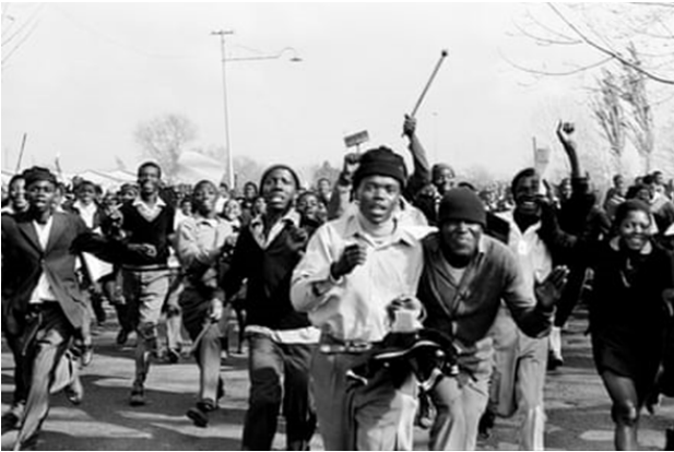
تصویر ۲۷. قیام دانش آموزی شیرهای جوان سووتو، ۱۹۷۶ ۴۸

در ۱۶ ژوئن ۱۹۷۶، هزاران دانش آموز سیاه‌پوست از شهرستان سووتو در ژوهانسبورگ آفریقای جنوبی، در اعتراض به فرمانی که همه مدارس سیاه‌پوست باید به زبان آفریکانسی تدریس کنند، چیزی که دزموند توتو ۴۹ آن را «زبان ستمگر» نامید، به خیابان‌ها آمدند و اعتراض کردند. بچه‌ها در ابتدا برای عکس گرفتن مردد بودند. پیتر ماگوبان، عکاس متولد ژوهانسبورگ، آن‌ها را متقاعد کرد. او به دانش آموزان گفت: مبارزه بدون مستندات، مبارزه نیست. این تصاویر زمانی حیاتی خواهند بود که واکنش وحشیانه پلیس - حداقل ۱۷۶ نفر کشته شدند - را پوشش داده و در سراسر جهان پخش شود. تصویر شماره ۲۷ موفق شد خشم مردم و در ادامه آن جنبش ضد آپرتاید را به وجود بیاورد.