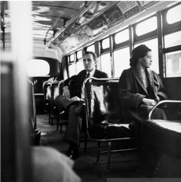
تصویر ۷. رزا پارکس روی صندلی اتوبوس می‌نشیند. ۱۹۵۶ ۱۵