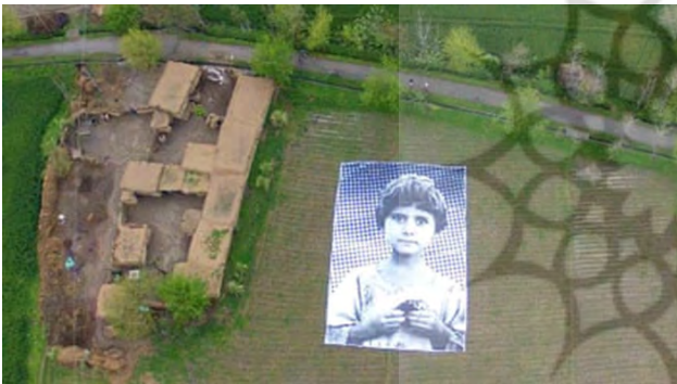
تصویر ۳۱. عکس از گتی، ۲۰۱۴، Notabugsplat

گروهی از فعالان هنرمند تصویری وسیع از کودکی در یک مزرعه پاکستانی ترسیم کردند تا بلکه وجدان اپراتورهای هواپیماهای بدون سرنشین آمریکایی را که مرز با افغانستان را از بالا تماشا می‌کردند، بیدار کنند. این پرتره اثر نور بهرام ۵۲ است که در وزیرستان شمالی کار می‌کرد، منطقه‌ای که هدف حملات هواپیماهای بدون سرنشین قرار گرفت. دختر به تصویر کشیده شده، والدین خود را در سال ۲۰۱۰ از دست داده است (تصویر شماره ۳۱).