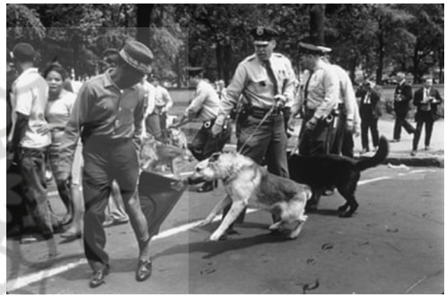
تصویر ۴. حمله سگ‌های پلیس به تظاهرکنندگان حقوق مدنی در بیرمنگام، ۱۹۶۳، ، آلاباما

موفقیت بزرگ این گروه یاد می‌شود. پس از اجرای بعدی آن‌ها سه عضو از جمله تولوکونیکوا تحت تعقیب قرار گرفتند و به این ترتیب آن‌ها دیگر ناشناس نبودند. با این وجود و در حالی که پوتین کنترل سخت‌گیرانه‌ای را بر قدرت خود دارد، این گروه همچنان مصمم است که صدای مقاومت باشد. در پی تهاجم به اوکراین، خطرات رخنمایی قدرت دولت افزایش یافته است. تولوکونیکوا می‌گوید: فعالیت اعتراضی در روسیه به طور فزاینده‌ای خطرناک می‌شود. شما به خاطر اینکه جنگ را جنگ نامیدید، نه «عملیات نظامی ویژه»، با ۱۵ سال زندان روبرو خواهید شد. اما هنوز مردم اعتراض می‌کنند. نه به این دلیل که می‌خواهند قهرمان شوند، بلکه به این دلیل که نمی‌توانند به خودشان دروغ بگویند.