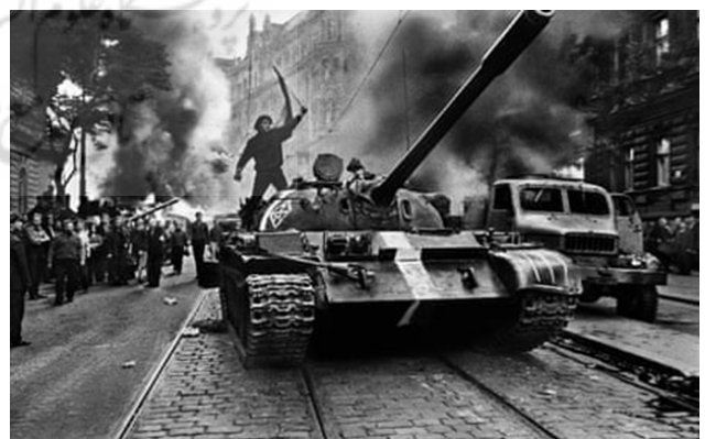
تصویر ۳۰. تانک‌های شوروی وارد پراگ شدند، ۱۹۶۸، جوزف کودلکا ۵۱ ، آژانس مگنوم

بهار پراگ در ۵ ژانویه ۱۹۶۸ آغاز شد، زمانی که الکساندر دوبچک ۵۲ رهبری حزب کمونیست چکسلواکی را به دست گرفت. او با اصلاحات خود حزبش را از مسکو دور کرده و نوید سوسیالیسم با چهره انسانی را می‌داد. هفت ماه بعد، تانک-