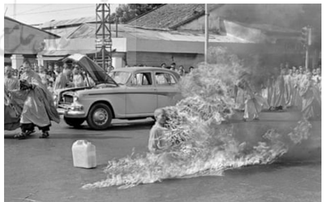
تصویر ۱۰. خودسوزی تیچ کوانگ دوک، ۱۹۶۳، عکاس: مالکولم براون ۲۰ ، آسوشیتد پرس

ابوعمر در میان ده‌ها هزار فلسطینی که در تظاهرات هفتگی نوار غزه از سال ۲۰۱۸ شرکت می‌کردند، حضور داشت. از جمله خواسته‌های آن‌ها پایان محاصره و بازگشت آوارگان فلسطینی بود. تصویر شماره ۱۱ مرد جوان با پرچم فلسطین و یک تیرکمان در سراسر جهان دیده شد و آن را با نقاشی مشهور «رهبری آزادی مردم» اثر اوژن دلاکروا ۱۹ در سال ۱۸۳۰ مقایسه کردند. ابوعمر بعداً در تظاهرات دیگری مورد اصابت گلوله قرار گرفت و مجروح شد.