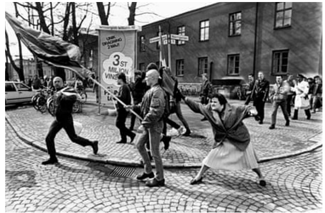
تصویر ۳۳. زنی با کیف دستی، عکاس: هانس رونسون ۵۴ ، ۱۹۸۵

مقابل افرادی که علیه آن لابی می‌کنند به وجود آورد (تصویر شماره ۳۳).