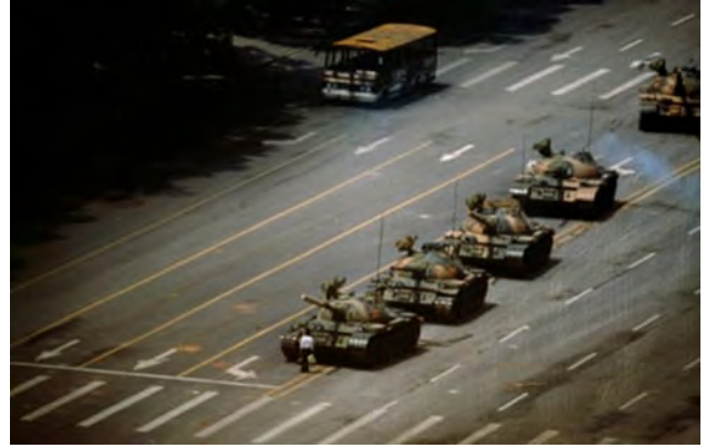
تصویر ۹. مرد تانکی، ۱۹۸۹