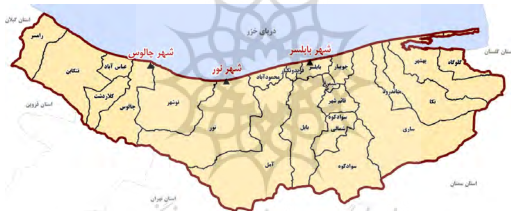
شکل ۱. موقعیت شهرهای مطالعه شده در سطح استان مازندران

سه شهر بابلسر، چالوس و نور از استان مازندران که در نوار ساحلی دریای خزر و موقعیت ممتاز گردشگری برای گسترش اقامتگاه‌های موقت و خانه‌های دوم قرار گرفته‌اند، به عنوان محدوده مکانی این مقاله بررسی شدند (شکل ۱).