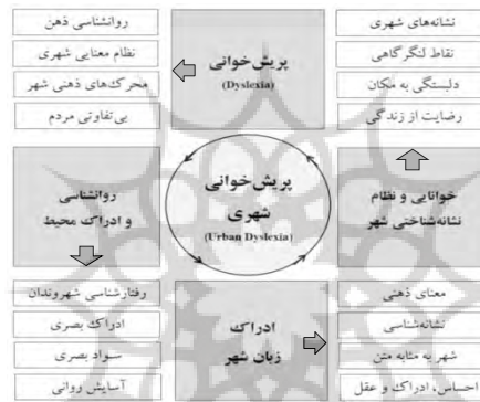
شکل ۱. چارچوب مفهومی (مفاهیم اصلی و فرعی پژوهش)

۱۳۸۸، ۱۰۷). از سوی دیگر انسان مهمترین عامل معنادهنده به مکان است. نوعی ارتباط میان انسان و مکان حاکم است که ادوارد رلف ۱۶ در اثر خود «مکان و بی‌مکانی ۱۷ » از آن به‌عنوان «روح مکان» یاد می‌کند؛ این تعبیر نشان‌دهنده آن است که ادراکات ما از فضا، در ذهن مکانی دارند که در مواجهه با مکان واقعی بیرونی تداعی شده و سبب برانگیختن حس آشنایی با مکان می‌شوند و لذا مکان، زمانی شناخته می‌شود که تصاویر ذهنی اولیه به‌نوعی خود ما را تداعی کنند (براتی و کاکاوند، ۱۳۹۲، ۲۵). همچنین، دل‌بستگی به مکان و ادراک آن، دو مؤلفه مجزا اما کاملاً هم‌بسته هستند. محتویات معنایی مربوط به ادراک محیط، با توجه به سطوح مختلف تعلق خاطر و شناسایی محیط توصیف می‌شوند؛ لذا معنای مکان برخاسته از تعلق خاطر نسبت به آن است (Rollero & De Piccoli, 2010). انسان موجودی اجتماعی است؛ مواردی مانند نیاز به تعلق، مقایسه با دیگران و هم‌ذات‌پنداری ۱۸ با آن‌ها در رفتارهای مختلف انسانی مشاهده می‌شود. بنابراین، ارتباط با محیط شهری نشان‌دهنده برخی معانی اجتماعی محیط است. به‌علاوه تعاملات اجتماعی که در محیط شهری اتفاق می‌افتد، خود عامل تجربیاتی است که بر رفاه فرد تأثیر گذاشته و معیار رضایت از زندگی تلقی می‌شود (Staats et al. , 2016). لذا پریش‌خوانی شهری می‌تواند منجر به نارضایتی از زندگی در شهر گردد.