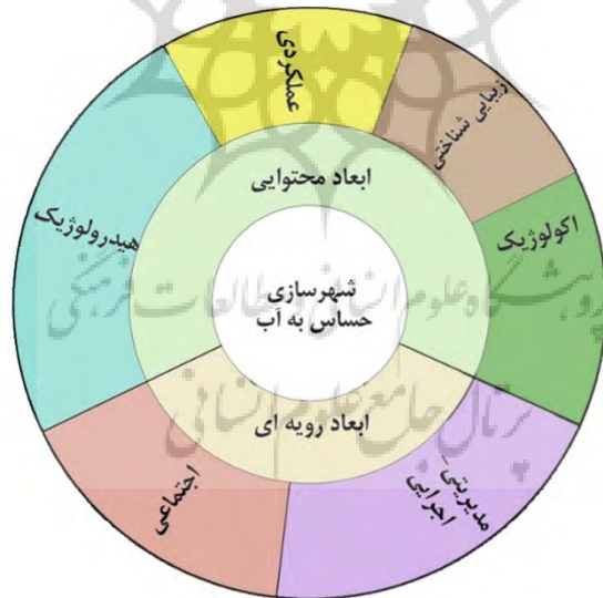
شکل ۲. چارچوب مفهومی شهرسازی حساس به آب

بنابر آنچه بررسی شد، می‌توان مفاهیم مرتبط با شهرسازی حساس به آب را در قالب دو بعد محتوایی و روبه‌ای و شش مولفه هیدرولوژیک، عملکردی، زیبایی‌شناختی، اکولوژیک، اجتماعی و مدیریتی - اجرایی، دسته‌بندی نمود. توضیحات هر مولفه پس از شکل ۲ ارائه شده است.