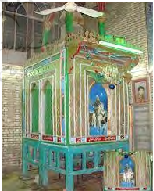
تصویر ۳. شیدونه.