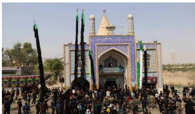
تصویر ۱. علم‌گردانی در خوزستان.

شیدونه، نوعی حجله است که از گذشته برای عزاداری‌های مربوط به جوانان ناکام، اجرا می‌شده است. در خوزستان این مراسم، به‌عنوان حجله حضرت قاسم (ع) تلقی شده و از احترام و ارادات بالایی بین مردم برخوردار است. «شیدونه سازه‌ای چهارگوش، طاق‌دار و از جنس چوب است که با ابعاد مختلفی ساخته می‌شود. دیواره‌های شیدونه به صورت مشبک و معمولاً به رنگ سبز است. در قسمتی از دیواره نقاشی‌هایی از تمثیل ائمه (ع) یا صحنه‌هایی از وقایع عاشورا کشیده شده است. شیدونه‌ها به عنوان‌های مختلفی از امامان و فرزندان آن‌ها مانند شیدونه حضرت علی (ع) شیدونه علی‌اصغر (ع)، شیدونه حضرت قاسم (ع)، شیدونه حضرت زینب (ع)، نامگذاری شده‌اند. هرکدام از شیدونه‌ها مختص به یک محله است و هر ساله ایام محرم در جای مشخصی در همان محله نصب شده و با شمع و حنا زینت می‌یابد. مردم نیز ندورات خود را که شامل خرما، حلوا، نان و خرما، حلواکنجی (حلوی کنجد) و غیره است برای پذیرایی از هیئت‌های عزاداری و مردم در آن قرار می‌دهند. شیدونه‌ها در شهر دزفول در نزدیکی مساجد و محله‌های قدیمی همچون مسجد جامع