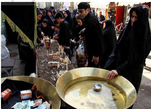
تصویر ۶. شمع پایلاماخ و آب متبرک.