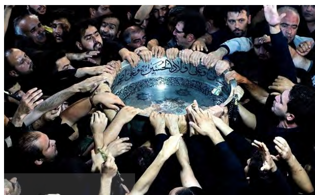
تصویر ۴. مراسم طشت گذاری

جدول ۴ اشاره به آیین‌هایی دارد که مشابه آن در استان دیگر وجود ندارد.