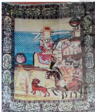
تصویر ۱: قالیچه دستبافت با موضوع واقعه کربلا، یزد، ۱۳۵×۱۰۵ سانتی‌متر (خشکنایی ۱۳۷۸، ۹۴)