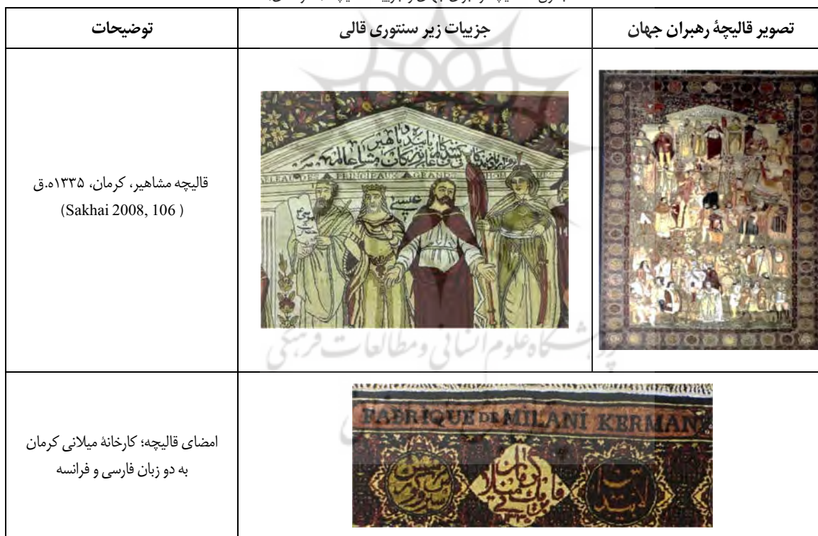
جدول ۱: قالیچه رهبران جهان و جزئیات قالیچه (نگارندگان)

در ردیف اول، از راست به چپ، عمر خلیفه ثانی، حضرت محمد (ص)، حضرت عیسی (ع)، حضرت سلیمان و حضرت موسی (ع) قرار گرفته‌اند. حضرت محمد (ص) بر روی لباس خویش، علامت ماه یا قمر دارد؛ حضرت عیسی (ع) با شنلی ارغوانی و دستانی که به سوی مخاطب کشیده شده مشاهده می‌شود؛ حضرت سلیمان دست خویش را بالا برده و حضرت موسی (ع)، ده فرمان را به دست گرفته است. در زمینه دو متن، کلامی مشاهده می‌شود. در کنار حضرت عیسی (ع)، نام ایشان و به جای متن ده فرمان، نام حضرت موسی (ع) نوشته شده است. در سنتوری‌ای که این بزرگان زیر آن قرار گرفته‌اند، نوشته شده است: «برقرار باد زندگانی کنندگان عالم و پاینده باد بزرگان مشاهیر عالم» (جدول ۱). زمینه و حاشیه‌های قالی، مملو از گل است و به سبک قالی‌های کرمان کار شده است. با توجه به آن‌که در قالیچه به بررسی جایگاه پیامبران ادیان توحیدی پرداخته می‌شود، نیاز است جایگاه این ادیان در دوره قاجار و ارتباط آنان با قالی و قالی‌بافی در این دوره مشخص گردد.