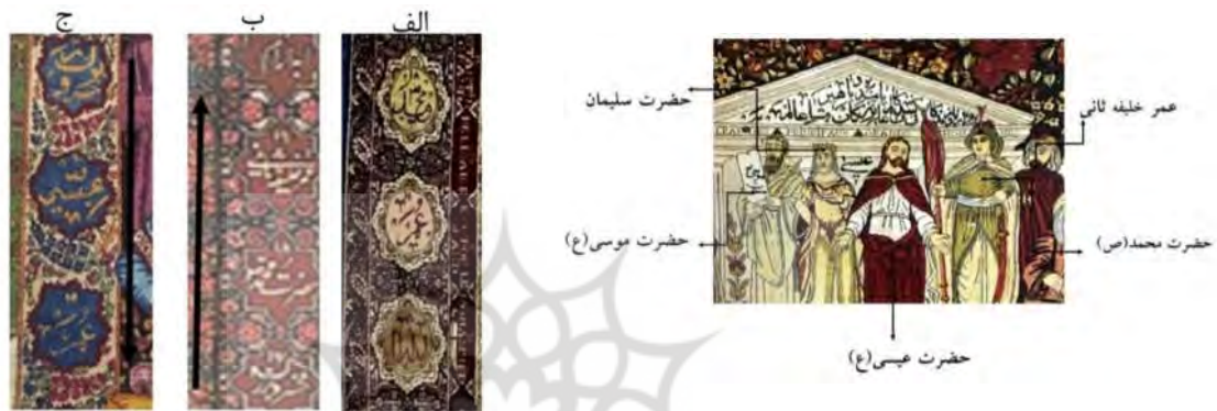
تصویر ۴: پیکره‌های قرارگرفته در ردیف نخست قالی (نگارندگان) (تصویر ۵: الف) جزئیاتی از حاشیه کارخانه میلانی؛ ب) جزئیاتی از قالیچه محفوظ در موزه فرش تهران؛ ج) جزئیاتی از قالیچه محفوظ در کاخ نیاوران (نگارندگان)

در زیر سنتوری معبد در ردیف نخست، حضرت محمد(ص)، حضرت عیسی(ع)، حضرت سلیمان و حضرت موسی(ع) قرار گرفته‌اند. شماره‌های آنها ۱، ۲، ۱۸ است و نام حضرت عیسی(ع) در حاشیه نیامده است (تصویر ۵، الف). بنابراین، شماره‌ای به وی اختصاص داده نشده است. ولیکن به‌رغم نام وی در حاشیه، از نظر بصری حضرت عیسی از جایگاه ویژه‌ای برخوردار است و نام وی و حضرت موسی در زمینه نیز تکرار شده است. در صورتی که در بیش‌تر قالیچه‌های بافته‌شده در این دوران، یا پیامبر اکرم(ص) حذف شده است مانند قالیچه‌های موزه فرش و قالیچه محفوظ در کاخ نیاوران (تصویر ۵، ج؛ جدول ۲ نمونه ۲) یا آن‌که تصویر و نام حضرت عیسی(ع) وجود ندارد (تصویر ۵، ب و جدول ۲، نمونه ۱) و در این دوره، معدود قالیچه‌هایی از جمله قالیچه کارخانه میلانی وجود دارد که هر سه پیامبر توحیدی در آن بافته شده باشند.