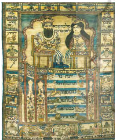
تصویر ۲: ملکه صبا و حضرت سلیمان، بافت کاشان، مربوط به اواسط قرن ۱۳ ه. ق. (Felton 2002, 58)

و در پایین حاشیه‌ی بزرگ‌تر به زبان فارسی بافته شده است. قالیچه شامل سه حاشیه‌ی اصلی است. اگر جهت خوانش از بیرون به درون درنظر گرفته شود، بیرونی‌ترین قسمت، حاشیه‌ی باریکی است پوشیده از نقوش ختایی. در این حاشیه، در بالا به فرانسوی نوشته شده است: «کارخانه‌ی میلانی کرمان» ۵ . قسمت دوم و حاشیه‌ی بزرگ‌تر شامل ۵۴ شمسه است که درون هریک از آن‌ها نام یکی از بزرگان جهان با عددی در کنار آن نوشته شده است. اعداد اختصاص یافته به پیامبران، (۱ موسی، ۲ سلیمان و ۱۸ حضرت محمد(ص) است و آخرین شماره یعنی ۵۴ به ناپلئون اختصاص دارد. حاشیه‌ی باریک دیگر، شامل ۵۵ کتیبه‌ی هم‌اندازه و دو کتیبه‌ی بزرگ است. درون کتیبه‌های کوچک، ک نام بزرگان به زبان فرانسوی بافته شده است. درون کتیبه‌ی بزرگ، نام کارخانه‌ی میلانی آمده است. در زمینه‌ی قالی، زیر سنتوری معابد یونانی، بزرگان جهان از موسی