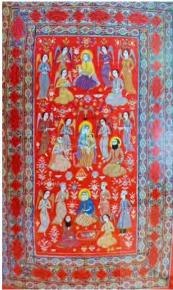
تصویر ۱: گلدوزی ۴ تشکیل شده از پشم و ابریشم، رشت، حضرت مریم و فرزندش، ۱۲۷۸ م. ق.، ۲/۴۳×۱/۶۷ متر (Sakhai 2008, 390)

نسی که به آنان داده شد، در کارگاه‌های هنری نیز نفوذ پیدا کرده و کالاهایی برای خویش تولید می‌کرد. از جمله این کالاها که ادعان گردیده است جنبه‌ی تعلیمی نیز داشته‌اند، منسوجاتی است با تصاویر حضرت مریم و حضرت عیسی (ع) (کشاوری و سامانیان ۱۳۸۶، ۹۲) (تصویر ۲). آنان اشاره می‌کنند که اکثر تصاویر استفاده‌شده در منسوجات که با آیین‌ها و شاعران دینی در ارتباط است، جنبه‌ی یادمانی، تعلیمی و اعجاز‌آمیز دارند که می‌تواند در حکم یک شمایل باشد.