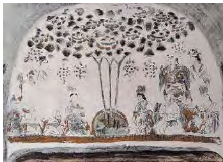
تصویر ۳: درخت سه‌تنه، مانویان، دیوارنگاره بزقلیق (کلیم کاپت ۱۳۹۶، ۱۸۳)