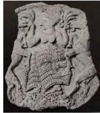
تصویر ۴: الهه باروری (آناهیتا) با برسم در دست، ۱۳۰۰ پ.م (Gray 1982, 73)