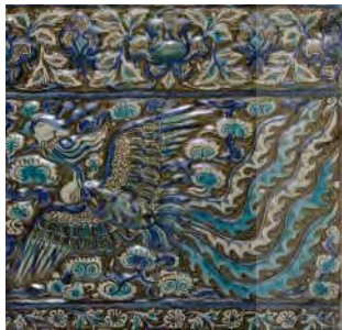
تصویر ۱۳: سیمرغ و نیلوفر، کاشی دوره ایلخانی، قرن ۷ ه.ق، محفوظ در موزه متروپولیتن (URL11)