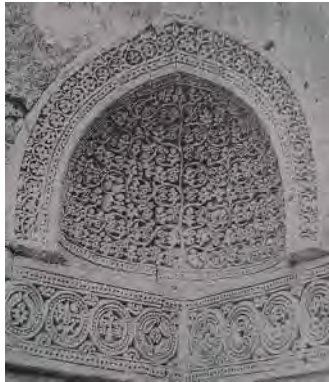
تصویر ۵: درخت طوبی در گچ‌بری سکنج شمالی امامزاده کرار، ۵۲۸ ه.ق (پوپ و اکرمین ۱۳۹۴، ۳۱۱)