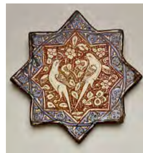
تصویر ۷: قرینه ختایی با بلبل، کاشی دوره ایلخانی، قرن ۸ ه. ق، محفوظ در موزه دالاس (URL2)