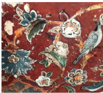
تصویر ۹: نقش ختایی و بلبل، دیوارنگاره کاخ هشت‌بهشت، دوره صفوی