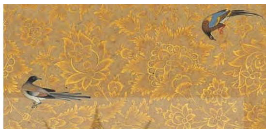
تصویر ۱۰: جزییات نشستن بلبلان بر گل‌های ختایی، حل کاری، مرقع گلشن، دوره قاجار، محفوظ در کاخ گلستان (نگارندگان)