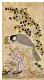
رقم معین مصور، سنه ۱۰۸۲ ه.ق، محفوظ در موزه دالاس (URL13)