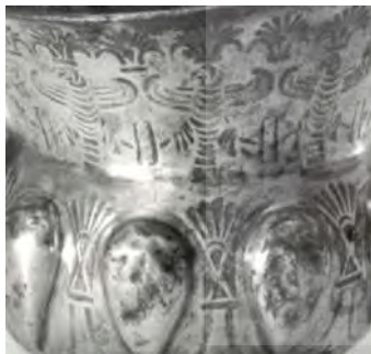
تصویر ۲: عقاب و درخت زندگی، گلدان نقره، دوره هخامنشی، محفوظاً در موزه متروپلیتن (URL1)

درخت سه‌تنه ۳ ، درخت مقدس نزد مانویان است (تصویر ۳). دیوارنگاره‌های بزقلیق گروهی از نیوشایان را نشان داده که در برابر درخت به نیایش ایستاده‌اند. بخش پایینی تنه، آوندی‌شکل و پوشیده است و بخشی از آن در پشت اورنگی از نوع صندلی دسته‌دار پنهان شده است. این درخت احتمالاً «درخت زندگی» است که عموماً نماد سرزمین نور است. بنا به کتاب مانوی کوان (غولان)، سرزمین نور شامل نواحی خاور، باختر و شمال است و از سوی جنوب با سرزمین تاریکی هم‌مرز است. سه تنه درخت ممکن است نمایانگر سه بخش سرزمین نور باشد و آن‌گاه مرز پایینی باید به منزله نوعی برج و بارو یا دیوار باشد. پیوند میان کتاب کوان با نوشته‌های یهودی خنوخ و کتاب یهودی غولان مکشوف در مران، راهی برای تفسیر این نگاره می‌گشاید. در آن‌جا درخت سه‌تنه معرف نوح و سه فرزند اوست که از توفان می‌گریزند. این تفسیر باعث می‌شود که درخت یادشده را درخت زندگی ببنداریم. اورنگ و درخت، نشانه و نماد انسان‌هایی‌اند که دینوران بر آن‌ها نماز می‌برند. درحقیقت، از مانی و عیسی غالباً با صفت «شجره الحیات» یاد می‌شود. در نوشته‌های مانی از اسقف هیپو نقل شده است: «آنگاه تخمه‌ای که از ماده جدا می‌شود، از هوای محیط می‌گذرد و به زمین می‌افتد، دانه‌ها، سبزه‌ها و تمام ریشه‌های گیاهان و میوه‌ها از آن می‌روید، گیاهان بی‌شماری که جهان را می‌پوشاند بخشی از این جوهر الهی را در خود دارد» (Moon 1955, 44).