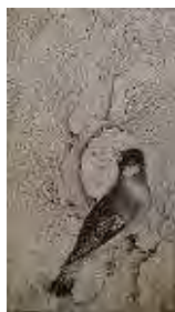
رقم محمدیوسف، احتمالاً اثر محمدیوسف، قرن ۱۱ ه.ق، محفوظ در مجموعه ساتبی (Sotheby 1997, 53)