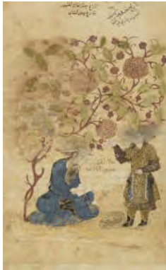
تصویر ۶: سرلوحة کتاب تاریخ جهانگشای جوینی، ۶۸۹ ه.ق، کتابخانه ملی پاریس (آزند ۱۳۸۸، ۲۰)