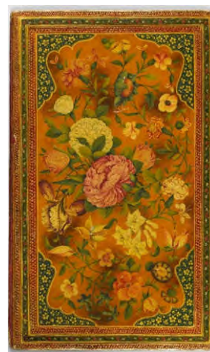
الگوی مقطع رویش نامشخص و مدور

جلد کتاب، دوره قاجار، رقم محمدجواد، سال ۱۲۵۹ ه.ق، محفوظ در گالری فریر (URL8)