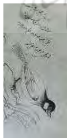
رقم رضا عباسی، سنه ۱۰۲۸ ه.ق، محفوظ در مجموعه فریر (خزایی ۱۳۶۸، ۲۶۱)

در داستان پریان «بلبل سرگشته»، پدر، پسر را با همدستی نامادری می‌کشد (مهندی ۱۳۸۶، ۳۴۳). نامادری پسر را می‌پزد. خواهر قهرمان، موضوع را دانسته و از دستپخت نامادری نمی‌خورد؛ در عوض، استخوان‌های برادر را زیر درخت گل دفن می‌کند. پس از مدتی، از میان درخت گل، بلبلی بیرون می‌آید و چنین می‌خواند: «منم منم بلبل سرگشته، از کوه کمر برگشته، پدر نامرد مرا کشته، زن پدر نابکار مرا خورده، خواهر دلسوز مرا با آب و گلاب شسته و پای درخت گل چال کرده» (مختاریان ۱۳۸۹، ۱۱۵). یکی از پرکاربردترین ترکیبات در ادبیات ایران استفاده از گل و بلبل در اشعار است که رویکردی عاشقانه دارد. در جدول (۴) به این تقابل اشاره شده است.