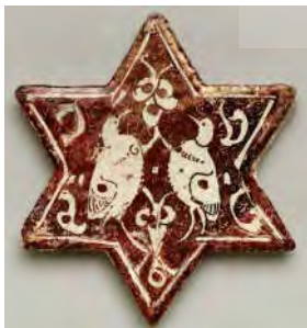
تصویر ۱۴: تقارن مرغ و گل، کاشی سلجوقی، قرن ۵ ه.ق، محفوظ در موزه دالاس (URL12)

واژه سیمرغ در پهلوی «سین مورو» و در اوستا به صورت «مرغوسن» یا «سائنامرغای» آمده است که جزء نخستین آن به معنای مرغ و جزء دوم آن با اندکی دگرگونی در پهلوی به صورت سین و در فارسی دری «سی» خوانده شده است. سیمرغ، مرغی است فراخ بال که بر درختی درمان بخش به نام ویسپویش یا هرویسپ تخمک که در بردارنده تخمه همه گیاهان است، آشیان دارد (تصاویر ۱۲ و ۱۳). سیمرغ در روایات اسلامی عنقا و در متون ادبی سیرنگ نامیده می شود. در نزد سهروردی به صورت نمادین، پرنده ای بالدار به شکل بال های جبریل و در نزد غزالی و عطار به صورت سیمرغ است (شایگان ۱۳۷۱، ۲۷۶).