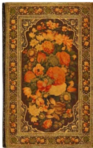
الگوی مقطع رویش نامشخص و متراکم

قاب آیینه، دوره قاجار، رقم نجفعلی، تاریخ نامعلوم، محفوظ در موزه هاروارد (URL9)