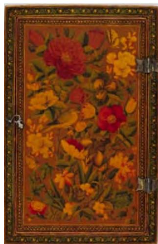
الگوی مقطع رویش مشخص

جدول ۲: الگوهای گلشن در آثار لاک‌ی قاجار (نگارندگان)