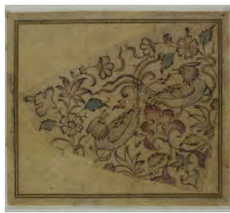
تصویر ۸: ترکیب قرینه ختایی با بلبل، قلم‌گیری، دوره تیموری، محفوظ در مجموعه دیز، موزه برلین (URL3)