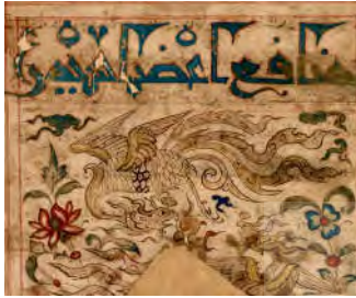
تصویر ۱۲: منافع اعضاء سیمرغ، دوره خوارزمشاهیان یا اتابکان مغول، تبریز، قرن ۷ ه.ق، محفوظ در موزه دالاس (URL10)