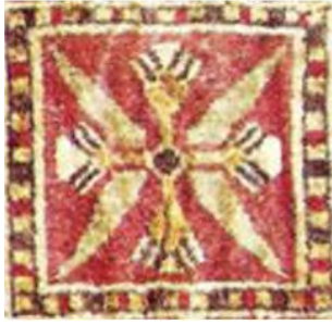
تصویر ۱۱: جزئیات فرش پازیریک، دوره هخامنشی، محفوظ در موزه ارمیتاژ (پوپ و اکرم، ج. ۱۵: ۲۶۸)