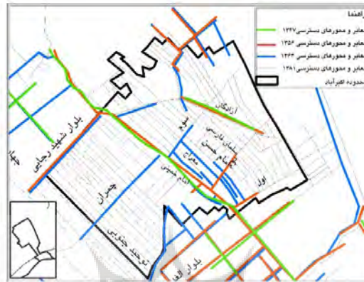
نقشه شماره ۴: مقایسه تغییرات فضاهای شهری در اکبرآباد از سال ۱۳۵۶ تا ۱۳۸۱

بلکه به منظور پشتیبانی و مستندسازی روایت‌ها برای تأکید بر پویایی درونی گروه اجتماعی-معیشتی تولید لباس در ارتباط متقابل با فضای غیررسمی شهری بازار امام حسن مجتبی است. اسناد بررسی شده دو قسمت است: نخست ارتباط فضا و معیشت که در تاریخ شکل‌گیری فضای شهری بازار امام حسن مجتبی در اکبرآباد آشکار شده و دوم مستندسازی بازار متمایز پایدار گروه شغلی تولیدکنندگان لباس در نسیم‌شهر که از طریق مقایسه آمار سرشماری ۱۳۸۱ کارگاه‌ها (Statistical Center Of Iran, 2002) و اطلاعات اتاق اصناف شهرستان