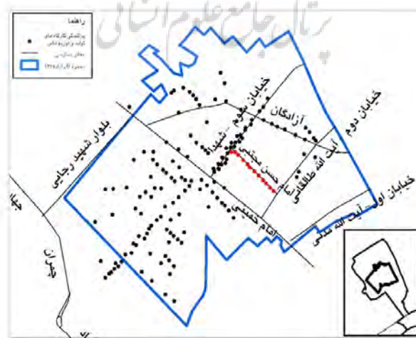
نقشه شماره ۵: توزیع فضایی کارگاه‌های زنجیره تولید لباس و موقعیت بازار امام حسن (۱۳۸۱)

همچنین براساس آمار اتاق اصناف و اداره صمت شهرستان بهارستان