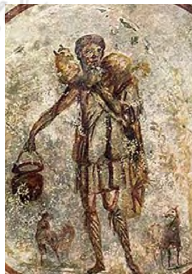
تصویر ۱. تصویر از شبان خوب از کتاب Monuments of Medieval Art ، صفحه ۷، اوایل قرن سوم میلادی.

هنر آغازین مسیحی در گوردخمه‌ها به شیوه‌ی هلنی-رومی کار شده است؛ حتی در آن از شمایل پیشامسیحی استفاده شده است که البته تفسیری مسیحی برای آن قائل‌اند. مثلاً در گوردخمه دومیتیل ۲۸ تصویر چنگ‌نواز برگرفته از اساطیر پیشامسیحی به چشم می‌خورد که نمایانگر اورفئوس ۲۹ در حال نواختن چنگ برای بازخوانی معشوق خود ائورودیکه ۳۰ از جهان فروردین است اما تفسیر مسیحی آن اشاره به رستاخیز مسیح دارد (Calkins, 1985: 8). در این تصویر مسیح فاقد ریش ترسیم شده است، همان‌گونه که در آثار یونانی-رومی مصور می‌شد. مسیحیان رومی الگویی جز آثار رومی و یونانی نداشتند و ناچار به پیروی از آنها بودند. این شیوه با کتاب مقدس در هماهنگی بود زیرا در کتاب مقدس خدا فرمود: «انسان را شبیه خود بسازیم تا بر حیوانات زمین و ماهیان دریا و پرندگان آسمان فرمانروایی کند» (پیدایش ۱-۲۷: ۲۶). مسیح و انسان باید به گونه‌ای ایدئال با تناسب دقیق رسم شوند زیرا مسیح به عقیده آنان تجسد پروردگار است و انسان تقلیدی است از پروردگار و واجد زیبایی. تقلید از طبیعت نیز برای مسیحیان منع نشده است زیرا طبیعت به‌عنوان مخلوق خداوند مورد تکریم بوده است. لذا این شیوه در هماهنگی کامل با اندیشه عیسوی قرار داشت.