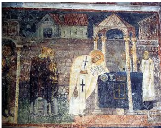
تصویر ۳. دیوارنگاره کلیسای جامع سانتاسوفیا ۱۳ ، در اوهرید مقدونیه ۱۴ شمالی.

دور خود دارد بر صلیب کشیده شده است. بر سر او هلال تقدس نمایان است. همچنین صلیب مزین به تصویر افراد مقدس است. در بخش فوقانی صلیب ظاهراً افرادی یا فرشتگانی که از تقدس بیشتری برخوردار هستند در آسمان قرار گرفته‌اند. افرادی که در میانه صلیب رسم شده‌اند افرادی مقدس هستند اما بر زمین قرار دارند که احتمالاً قدیسان و حواریون مسیحی می‌باشند. در بخش تحتانی صلیب نیز چند پیکر در سمت راست و در اندازه‌های کوچک و با هلال مقدس قرار دارند.