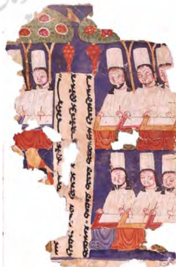
تصویر ۵. کاتبان مانوی مکشوف در ترکستان چین، عصر ساسانی.