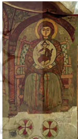
تصویر ۴. مصر شهر باویط Bawit، صومعه آنتونی مقدس ۱۳ میلادی.

در این تصویر (۴) حضرت مریم نشسته بر تختی چوبین و ساده، عیسی کودک را در آغوش دارد. دو طرف مریم مقدس (MP (Meter Theou نوشته شده است که به معنای مادر خدا است. با آنکه این تصویر مربوط به قرن ۱۳ م. است به شکل قابل ملاحظه‌ای از طبیعت‌گرایی فاصله گرفته و به نقوشی انتزاعی نزدیک شده است. مسیح کودک به صورت انسانی بالغ با اندازه‌ای کوچک ترسیم شده و کل پیکر او در هلالی تخم‌مرغی شکل قرار گرفته است. عیسی و مریم هر دو با هلال تقدس مصور شده‌اند. حضرت عیسی دست راست خود را به نشان نام خود بالا برده است. چشمان هر دو نقش یادآور برخی نقاشی‌های برجای مانده از مانویان است که با چشمان گشوده و خیره به مقابل، ارتباطی روحانی با ناظر برقرار می‌کنند. در این تصویر حالات اشرافیت معمول آثار آن