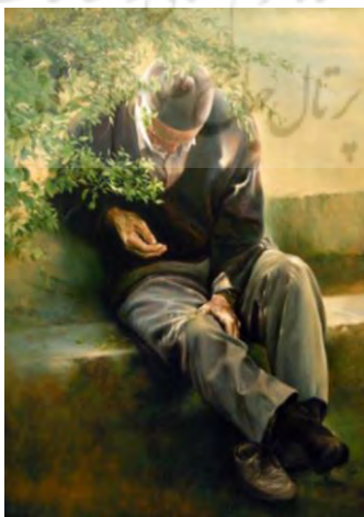
تصویر ۱- پیرمرد خوابیده در طبیعت، اثر عباس کاتوزیان، دوره معاصر.

و در داستان رامونا (مجموعه توشای پرنده غریب زاگرس): «آگه مرد بودم از دیوار بالا می‌کشیدم و تو کوچه می‌پریدم و می‌رفتم به شهر. برای یه مرد همه‌جا برای خوابیدن جای هس، یه مرد میتونه هر جا که دلش میخواد بره، مرد آزاده، مته زن اسیر نیس، ما اسیریم سیندخت، ما برده به دنیا آمدیم و برده می‌میریم. آگه زن نبودم یه دقه هم تو این گورستان نمی‌ماندم» (یاقوتی، ۱۳۷۴: ۲۳). تصویر شماره (۱) نیز یکی از نقاشی‌های عباس کاتوزیان است که می‌توان واقع‌گرایی مربوط به زندگی روزمره، پیوند طبیعت و انسان را مشاهده کرد.