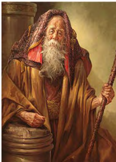
تصویر ۴- چهره پردازی پیرمرد. اثر عباس کاتوزیان، دوره معاصر. منبع: (نگارنده)

توصیف صحنه دعوی پدر و مادر یونس در داستان کوتاه قرنطینه (مجموعه تنهاتر از ماه): هنگامی که پا به درون حیاط گذاشت که طبل دعوا از صدا افتاده بود و مادرش با لب شکافته و خون چکان، دندان شکسته‌اش را کف دست گرفته و آن را تماشا می‌کرد. انبوهی از موهای مشکی سرش هم به شاخ و برگ بوته نیلوفر کبود پیچیده بود. ناخن مادر گونه‌های پدرش را چنگ زده و به خون انداخته بود. انگار گربه به آن چهره‌ی زردرنگ و پلاسیده ناخن کشیده بود. پیراهن مندرس پدر تا پایین جرخورده و در جستجوی دگمه‌های کنده‌شده کف حیاط را می‌کاوید. خواهرانش با چشمان وحشت‌زده، موهای آشفته، لباس‌های کهنه و پاره، چهره‌های زردرنگ در گوشه‌ای می‌لرزیدند و صداهای نامفهومی که به خرخر جانوری سربریده شبیه بود از گلو بیرون می‌دادند. / سفره‌ی خالی نان در وسط حیاط پرتاب‌شده و کوزه شکسته آب در کنارش متلاشی شده بود (یاقوتی، ۱۳۹۰: ۶۳). پرداختن به زندگی روستاییان علاوه بر ادبیات ناتورالیستی در نقاشی نیز دیده می‌شود. اثر زیر که یک مرد روستایی را ترسیم کرده است از آثار ناتورالیستی عباس کاتوزیان است.