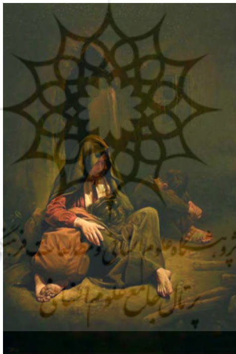
تصویر ۲: نقاشی مادر و فرزندان، از عباس کاتوزیان، دوره معاصر.

سیرنگ بی‌اعتنا به تهدیدها و دشنام‌های او، چاقوی تیز را از جیب بیرون آورد، تیغ‌اش را گشود و چند لحظه بعد فریاد جگرخراشی از مختار برخاست و سیرنگ بیضه‌های او را گوشه‌ایی پرت کرد (یاقوتی، ۱۳۸۹: ۱۲۰). تصویر شماره (۲) نیز به‌عنوان یکی از نقاشی‌های ناتورالیستی عباس کاتوزیان، وضعیت طبقات فرودست جامعه را به تصویر کشیده است.