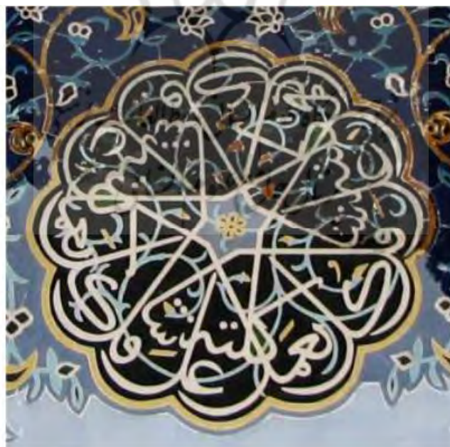
تصویر ۴- آیه ۸۴ سوره اسراء در قالب شمس. منبع: (مطمئن و همکاران: ۱۰۰)

تصویر ۳- نام پیامبران اولوالعزم و حضرت علی علیه السلام در زیر ایوان ورودی مسجد کبود تبریز. منبع: (مطمئن و همکاران: ۱۰۰) نام پیامبر اولوالعزم یکی از پر تکرارترین اسماء در قرآن است که در آثار و بناهای مذهبی متعددی استفاده شده است. علاوه بر اسماء پیامبران و صفات الهی بسیاری از مفاهیم و آیات قرآنی نیز در کتیبه‌های مسجد کبود تبریز به کار رفته است که به این مکان تقدس بیشتری بخشیده است. تصویر شماره (۴) بخش‌هایی از سوره اسرا را منعکس ساخته است.