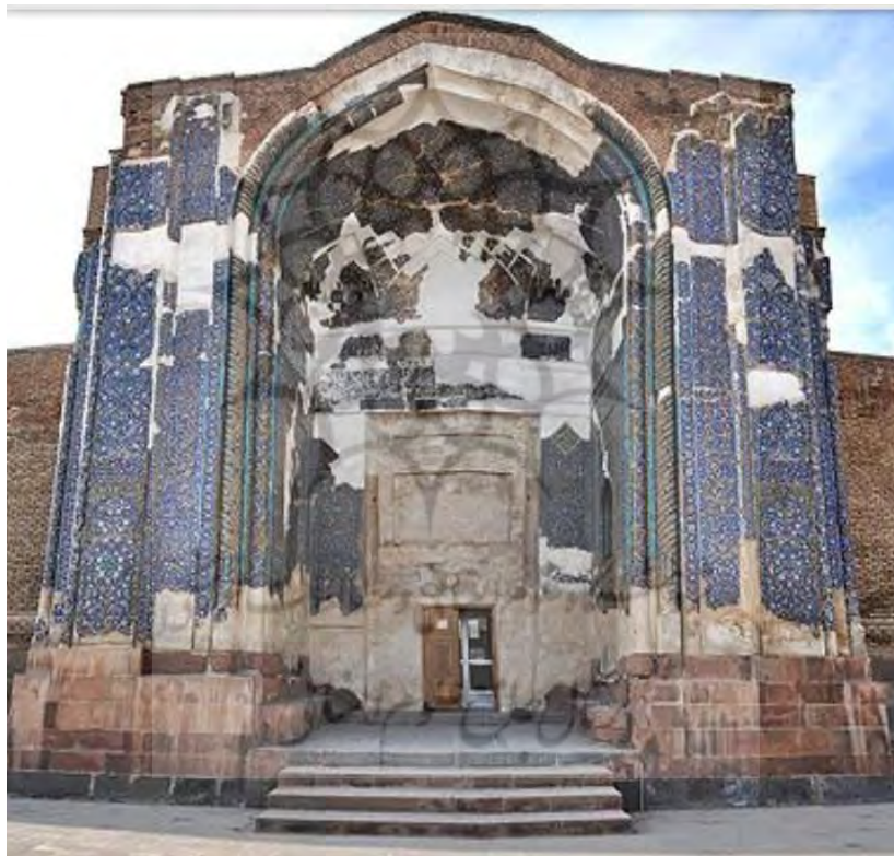
تصویر ۱- نمایی از مسجد کبود تبریز.

در این مسجد نقوش مختلفی از قبیل: نقش‌های گیاهی، هندسی و کتیبه‌ای در تزئینات کاشیکاری، مشاهده می‌شود. کتیبه‌های مسجد که عمدتاً با دو خط کوفی و ثلث کار شده‌اند با نگاره‌های اطراف خود ارتباط مستقیم داشته و به آن‌ها جنبه اعتدال و هماهنگ بخشیده‌اند. مسجد کبود تبریز در هنر و معماری اسلامی به‌خاطر کاشی‌کاری منحصر به فرد به فیروزه اسلام شهرت دارد. این بنا در اواخر دوره باشکوه تیموری و در دوره قراقویونلوها شکل می‌گیرد. تزئینات به‌کاررفته در آن که عمدتاً با کاشی معرق صورت گرفته است، فوق‌العاده باطراوت می‌باشند. این مسجد عضوی از زنجیره حیات شهر کهن بوده که بستری را برای مراودات و تعاملات اجتماعی فراهم می‌آورد. تصویر شماره (۱) نمایی از مسجد کبود تبریز را منعکس ساخته است.