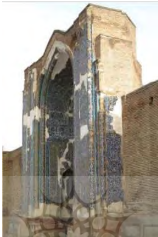
تصویر ۵- کتیبه‌های قرآنی در سردر مسجد کبود تبریز. منبع: (مطمئن و همکاران: ۱۰۰)

در تصویر شماره (۵) نیز اسماء و اذکار الهی، نام اولیاء مذهبی با خط ثلث و کوفی در کتیبه‌های سردر وردی مسجد کبود تبریز نقش بسته است.