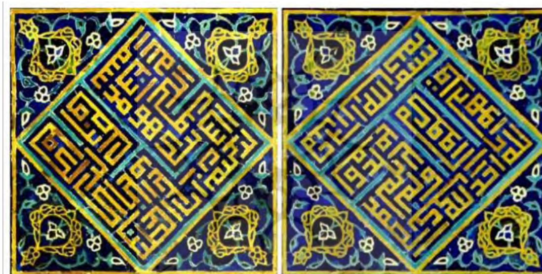
تصویر ۲- دو کتیبه بنایی متداخل در محل محراب گنبدخانه، مزین به الله و محمد. (مطمئن و همکاران: ۱۰۰)

کتیبه‌های مسجد کبود که عمدتاً با دو خط کوفی و ثلث کار شده‌اند با نگاره‌های اطراف خود ارتباط مستقیم داشته و به آن‌ها جنبه اعتدال و هماهنگ بخشیده‌اند. دو رنگ آبی لاجوردی (در زمینه کتیبه‌ها) و سفید (در نوشتن خط متن کتیبه رنگ غالب در تزئینات این مسجد می‌باشد که به لحاظ نمادین، این دو رنگ، با عقاید عرفا ارتباط مستقیم داشته و به نوعی نمودی از اعتقادات عرفا در تزئینات این مسجد به حساب می‌آیند. همچنین انتخاب انواع نقش شمشه‌ها و ذکر کلمات قصار عرفانی به عنوان مضامین این نقوش، نشان از تأثیر عرفان و تصوف در تصویرگری تزئینات این بنای بزرگ دوره قره‌قویونلوها دارد. از سوس دیگر بررسی مضمون این کتیبه‌ها حاکی از تأثیر قرآن و مفاهیم مذهبی است. همان‌گونه که در تصویر شماره ۲ مشخص است از اسماء و صفات الهی در تزئین استفاده شده است.