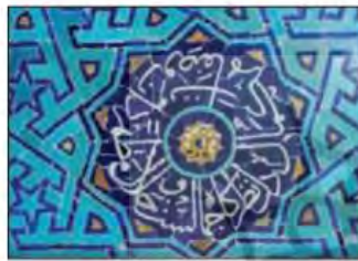
کاشی کاری مسجد جامع ارد.

آیا می‌توانید راه‌های دیگری برای کشیدن این ستاره هشت پر پیدا کنید؟