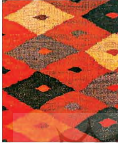
نمونی از گلیم تاهسون.

گلیم نقش‌دار بیافید: اغلب نقش‌های گلیم بر اساس طرح‌های منتهی و لوزی به‌وجود می‌آیند. متناسب با رنگ‌های نقش گلیم، مقداری کاموای رنگی تهیه کنید. یک قاب کهنه را به جای دار گلیم، جله‌بیچی کنید و با راهنمایی معلم خود نقش گلیم زیر را بیافید.