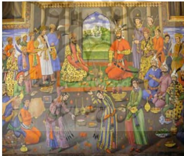
تصویر ۲: نگاره پذیرایی از همایون‌شاه در کاخ چهلستون، دوره صفوی.

حضور نوازندگان زن در این دوره حاکی از فعالیت زنان هنرمند در جامعه است. در تاریخ ایران پس از اسلام دوره صفوی هم به لحاظ دگرگونی‌های مهم سیاسی و فرهنگی نقطه عطفی محسوب می‌شود و در نگارگری صفوی نیز می‌توان حضور زنان هنرمند را مشاهده کرد. در دوره تیموری و صفوی هنرمندان زن در مراسم‌های درباری حضور داشته‌اند.