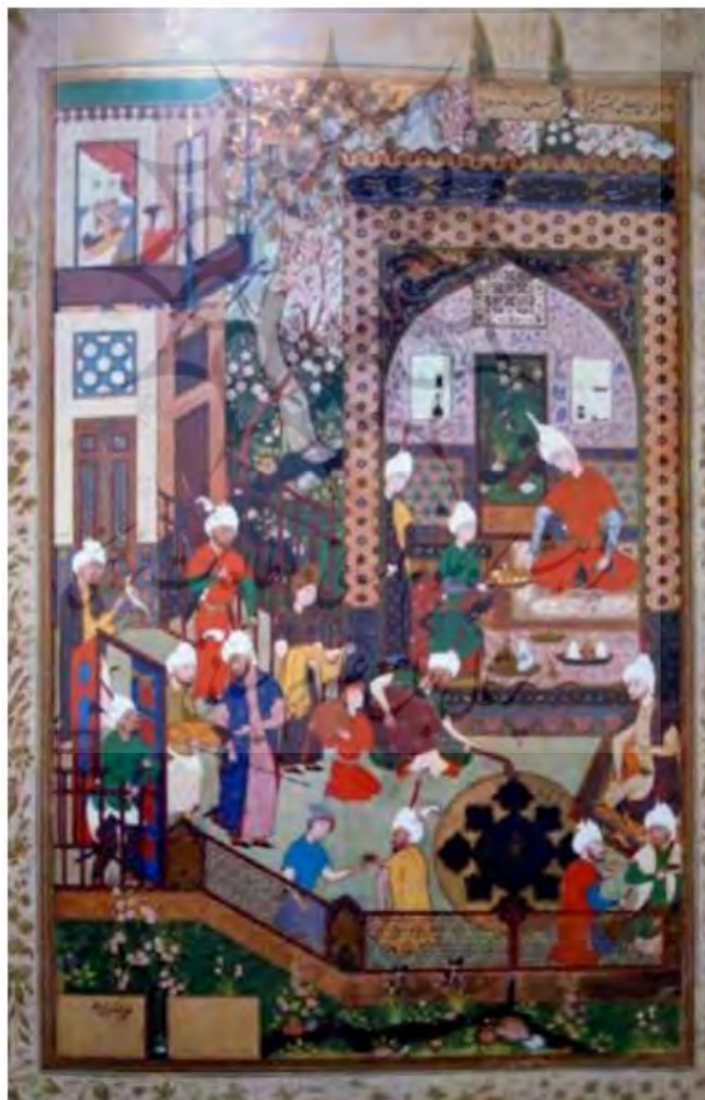
تصویر ۳- بارید در حضور خسرو، میرزاعلی. خمسه شاه طهماسبی (۹۴۶-۹۵۰ه.ق).