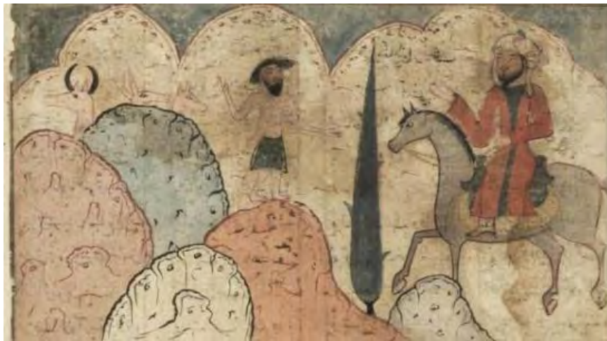
تصویر ۲: نگاره خبر دادن زید به مجنون از وفات شوهر لیلی، مکتب مغول. خمسه نظامی ۷۱۸ه.ق.