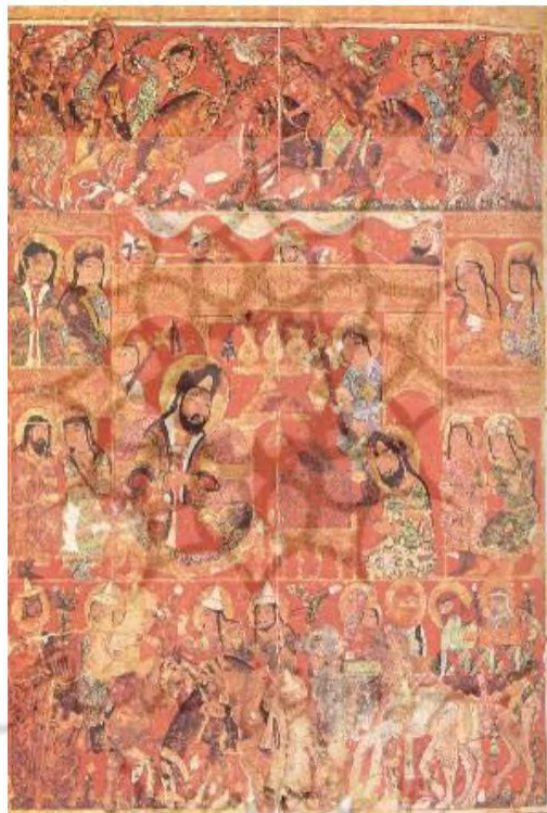
تصویر ۲: کتاب التریاق. مکتب سلجوقی. قرن ۷ ق. موزه متروپولین.

سیر و سلوک رنگی که وی توصیف می‌کند در حقیقت اشراق نورانی است که گام‌به‌گام از دمی برمی‌خیزد که در آن لطیفه مینوی انسان از نفس پست‌ترش رها می‌شود تا به آرامش و حیات جاودانگی قلب و روح او منتهی شود. نجم‌الدین کبری چندین مرتبه به این انوار رنگی همچون امری اشاره می‌کند که با بستن چشم می‌توان آن را دید، امری نزدیک به مشاهده یک هاله که به این صورت مورد تأمل قرار گرفته جزئی از یک مابعدالطبیعه نور خواهد بود. وی در کتاب خود، به تفصیل درباره معانی تأویلی رنگ‌ها می‌پردازد. در تصویر شماره ۲ می‌توان استفاده از هاله نور را در نگارگری اسلامی مشاهده کرد.