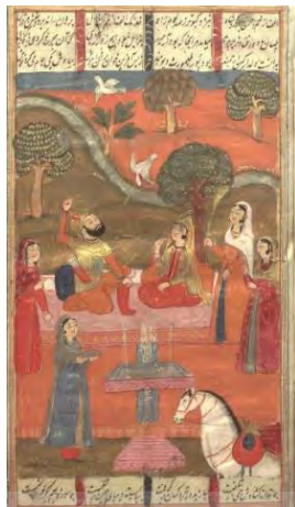
تصویر شماره ۵. نگاره جمشید شاه و سمن‌ناز (شاهنامه ۹۴۸ ه.ق، کتابخانه ملی).

اسطوره‌ای و اساس داستان‌ها، صورت جدیدی منطبق بر زمانه به آن‌ها ببخشند (غفوری، ۱۳۸۴). تصویر شماره (۵) نیز از داستان اسطوره‌ای جمشید به‌عنوان یکی از شاهان کیانی استفاده کرده است.