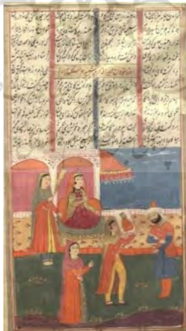
تصویر شماره ۳. نگاره اسکندر و قیدافه (شاهنامه ۹۴۸ ه.ق، کتابخانه ملی)

زندگی‌اش را خود انتخاب می‌کند برای به‌دست آوردنش تلاش می‌کند؛ اما تمام تلاش او به این ختم می‌شود. زمانی که رحمت زندانی است تمام همراهی و حمایت او شال‌گردنیست که برای رحمت بافته است؛ و آوردن باقلو‌هایی که بوی چربیش حتی تا چند روز بعد از خوردن رحمت را می‌آزارد. در ملاقاتش به‌جای اینکه حامی مردش باشد، آن‌قدر گریه می‌کند که به سسکه می‌افتد؛ و رحمت که یک‌دستش گرفتار دستبند نگهبان است، مجبور است با یک‌دست دیگر او را حمایت کند؛ و همین بر ناراحتی‌های دیگر رحمت می‌افزاید. «زنش در این حالت به یک کفتر بزرگ مهم‌اند که بی‌رحمانه اسیر صیادی مثل رحمت شده باشد». این زن زنانگی خود را تا حدی به نمایش می‌گذارد که بازجو هم از رحمت می‌خواهد آرامش کند؛ و حتی بعد از تمام‌شدن ملاقات بازجو با زن رحمت در اتاق ملاقات می‌ماند؛ و شب هنگامی که نگهبان بیرجندی و رحمت به دلیل این‌که بیرجندی کلید دستبند را گم کرده، در کنار هم می‌خوابند، بیرجندی به خود اجازه می‌دهد درباره‌ی زیبایی این زن اظهار نظر کند. رحمت اینجا احساس می‌کند که زنش شیء شده و زیر پای بیرجندی افتاده است. درحالی‌که زنش پیش‌ازین شیء شده بود. همان زمان که رحمت پیشنهاد جداشدن را می‌داد و او مخالفت نمی‌کند؛ و اظهار می‌کند که پدرش نیز همین را می‌خواهد؛ و همان زمان که به‌جای حمایت از مرد خود، خود را نیازمند حمایت مردی می‌داند؛ همان‌جاکه در صفحه سی‌وشش داستان، رحمت فکر می‌کند که اگر شروع به همکاری کند، این صورت زیبا شروع می‌کند به خندیدن. این صورت زیبا می‌خندد بدون آنکه فکر کند خندیدن او به چه بهایی برای دیگران تمام‌شده است. تصویر شماره (۳) در نگاره‌ی مربوط به دوره‌ی صفوی، شخصیت تاریخی قیداره را به‌عنوان زنی شجاع و برون‌گرا به تصویر کشیده است.