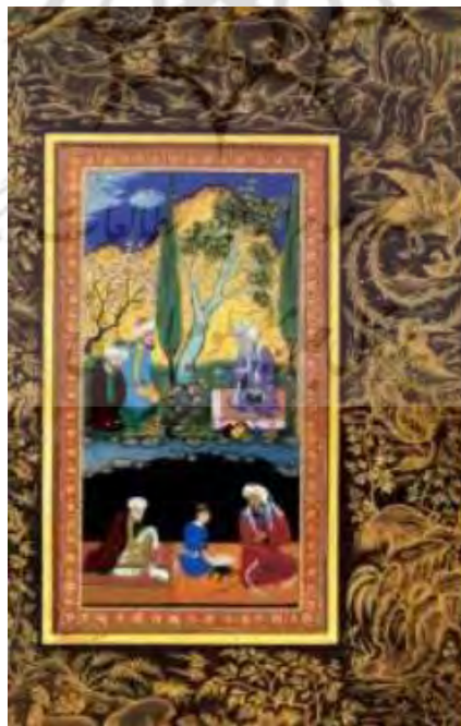
تصویر ۲: در محضر پیر، مرقع گلشن، ۱۶۰۵-۱۶۳۶/۱۰۱۴-۱۰۴۶، دوره صفوی، موزه کاخ گلستان.

هرچند در مکتب یونگ، سایه، نیمه تاریک ذهن ما است، لزوماً پلید نیست؛ زیرا در عین حال دارای صفاتی خوب و پسندیده، همچون درک واقعیت انگیزه خلاقیت است؛ اما به هر حال، نیمه‌ای است که معمولاً آن را پنهان می‌کنیم؛ نیمه‌ای انباشته از گناه آن که سرکوب، آن را سیاه‌تر و هولناک‌تر می‌نماید و بهترین راه شناخت آن و محفوظ ماندن از گزندش، رویارویی با آن است. در تصویر شماره (۲) افراد با حضور در محضر مرشد طریقت در تلاش برای شناخت ناخودآگاه خویش هستند.