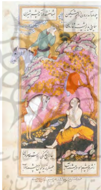
تصویر ۲- نگریستن خسرو آبتنی شیرین را، رضا عباسی، ۱۰۴۱ ه.ق. مأخذ: (رضا عباسی اصلاحگر سرکش)

دل به‌مثابه انسان؛ شواهد بسیاری در زبان فارسی وجود دارد که کاربرد دل را به‌جای انسان به‌طور مجازی می‌نمایاند، در زیر به نمونه‌هایی از آن اشاره می‌کنیم: حرفِ دل؛ در قالب مجاز جزء به‌کل، دل در نقش انسان به‌کاررفته که سخن می‌گوید. با دل گفتن؛ در قالب مجاز جزء به‌کل، دل در نقش انسان به‌کاررفته که با وی می‌توان سخن گفت. سخنی که از دل برون آید؛ در قالب مجاز جزء به‌کل، دل در نقش انسان به‌کاررفته که سخن می‌گوید. کجا خوش است آنجا که دل خوش است؛ در قالب مجاز جزء به‌کل، دل در نقش انسان به‌کاررفته که ویژگی لذت بردن به او نسبت داده شده است.