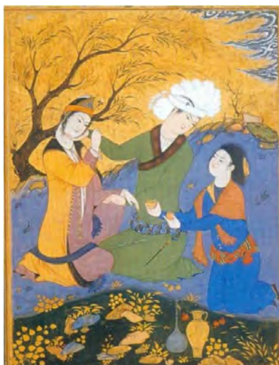
تصویر ۳- عشاق در صحراء، ۱۰۱۸ ه.ق. رضا عباسی. موزه هنری سیاتل.

تصویر بالا نیز با تکیه بر چشم و دست به عنوان جلوه‌گاه دل و عشق موفق به ایجاد نوعی چندمعنایی شده است.