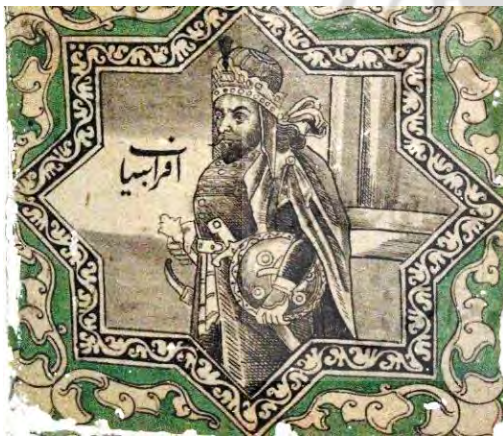
تصویر ۲۰. پهلوان شاهنامه (افراسیاب، پیشدادیان)،

ورود مظاهر دنیای غرب و ظهور ابزارهای جدید، چون تلفن و تلگراف، توسعه صنعت چاپ، پیدایش روزنامه، ورود تمبر، کارت پستال و شکوفایی عکاسی از موارد بسیار تأثیرگذار عصر ناصری بود که تا پایان دوره دوم حکومت قاجار ادامه یافت. او برخلاف جدش، برای اقتدار سلسله خود و نمایش خویش به‌عنوان یگانه قدرت پادشاهی بیشتر از فناوری‌های زمان خود سود برد (نوروزی، ۱۳۹۶: ۲۲۸ و ۲۳۱). بی‌تردید با رواج چاپ سنگی، عرصه جدیدی به وجود آمده است. چنین تصاویری در اغلب کتاب‌های چاپ سنگی و روزنامه‌ها، فراوان یافت می‌شود و متون قصه، تعزیه و غیره را شامل می‌گردد و تأثیر چنین شیوه‌ای در برخی دیوارنگاره‌ها مشاهده می‌شود (ستاری، ۱۳۸۲: ۴۷). از ویژگی‌های مهم تصاویر چاپ سنگی حاکمیت عنصر خط و حذف رنگ در آن‌هاست. به علت عدم توانایی استفاده از رنگ در چاپ سنگی، این آثار با مرکب مشکی بر روی کاغذ سفید و گاه آبی یا سبز چاپ می‌شدند و در مواردی نادر از مرکب‌های تک‌رنگ مثل آبی یا سبز استفاده می‌کردند (حسینی‌راد و خان‌سالار، ۱۳۸۴: ۸۴). این تأثیر و ویژگی‌ها به‌وضوح در کاشی نگاره‌های تکیه معاون‌الملک مشاهده می‌شود. تصویرسازی روزنامه‌های چاپ سنگی، کتاب‌های چاپ سنگی (تصویر ۱۹ و ۲۰)، سفرنامه‌ها و کتاب‌های خارجی، تصویرسازی تمبر و کارت پستال از مجموعه‌های تصویرسازی صنعت چاپ سنگی هستند که دیوارنگاره‌های تکیه معاون‌الملک از آن الهام گرفته‌اند و در این جستار بدان پرداخته نمی‌شود.