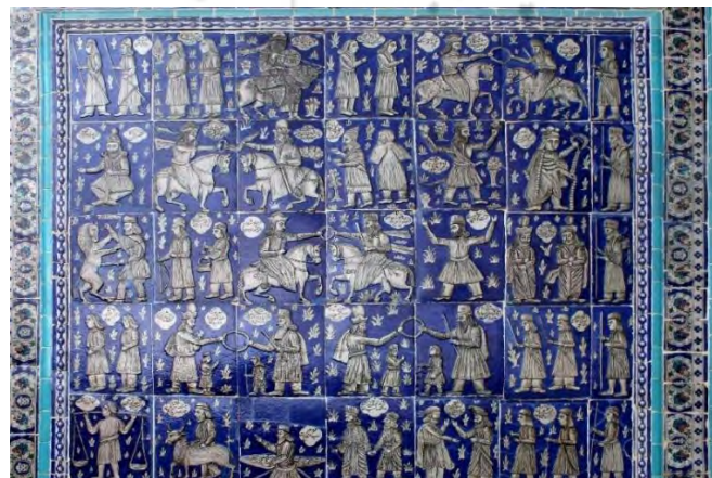
تصویر ۶. کاشی‌نگاره‌های لاجوردی رنگ با مضامین باستانی و اسطوره‌ای، بخش عباسیه، تکیه معاون‌الملک، کرمانشاه.

در تخت جمشید چه چیزی برای کاشی‌ساز و نقاش این نگاره (تصویر ۶) می‌تواند بهتر از ترکیب شکارگاه، که در همین شهر کرمانشاه بارها آن را از نزدیک دیده و در آن تأمل کرده است، الگوی مناسبی باشد؟ اگر به‌جای هر کدام از قطعات کاشی و پیکره‌های منقوش بر آن، پیکره گرازها، فیل‌ها، نیزار و انسان‌های در میان قایق شکارگاه را قرار دهیم (تصویر ۱۳)، این ترکیب را به‌خوبی تداعی می‌کند. این حجاری و حجاری‌های دیگر این منطقه، الگوی بسیار مناسبی برای تعداد زیادی از تصاویر و نگاره‌های روی کاشی‌های بخش عباسیه و حسینی بوده‌اند. این دید چندساحتی در نقاشی‌های قهوه‌خانه‌ای مشاهده می‌شود که ریشه آن را می‌توان در این حجاری‌ها جست‌وجو کرد.