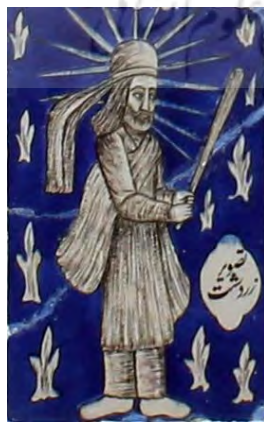
ت ۱۴. نقوش نمادهای ایرانی (زردشت)، بخش عباسیه، تکیه معاون الملک، کرمانشاه.