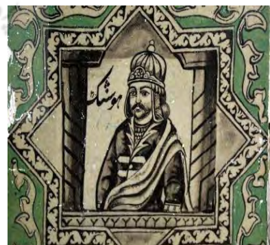
ت ۳. شاه اسطوره ای (هوشنگ، پیشدادیان). بخش زینبیه، تکیه معاون الملک، کرمانشاه.