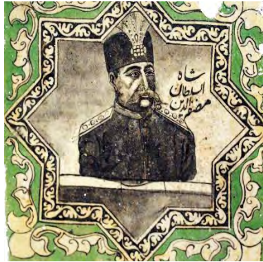
تصویر ۴۲. تأثیر از هنرهای کشورهای غربی (تمبر)، مظفرالدین شاه، بخش زینبیه در تکیه معاون الملک، کرمانشاه (مأخذ: آرشیو یوزباشی، ۱۳۹۹).