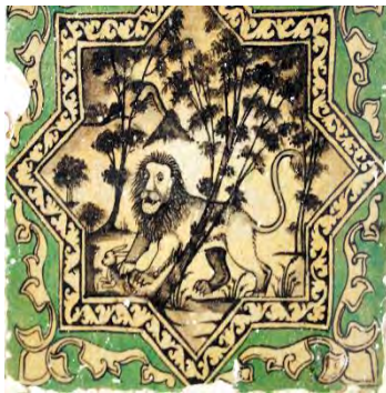
تصویر ۳۲. موضوع روزمره، حیات‌وحش، بخش زینبیه، تکیه معاون‌الملک، کرمانشاه.

یحیی ذکاء درباره موضوعات روزمره می‌گوید: چنان‌که در کاشی‌نگاره‌های این عصر طرح‌هایی می‌بینیم که از مناظر معماری (تصویر ۳۰ و ۳۱) و برخی مناظر طبیعی و حیات‌وحش (تصویر ۳۲) است. چه پیش‌ازین برای تزئین بناها از تصاویر ابنیه و منظره‌هایی از طبیعت و حیوانات استفاده نمی‌شد (ذکاء، ۱۳۷۶: ۶-۸). همچنین نقوش انسانی، جانوری، گل و گیاهان و غیره را نیز شامل می‌شود. نمایش گل‌ها (به‌خصوص رز و زنبق) شاخه و برگ و میوه‌ها، هم به‌عنوان موضوع اصلی و هم به‌عنوان موضوع مکمل به‌کار رفته است. در این تصاویر، مناظر روستایی و ساختمان‌هایی را می‌توان دید که اساساً از تصاویر وارداتی اروپاییان الهام گرفته و روایات بسیاری درباره آن‌ها وجود دارد.