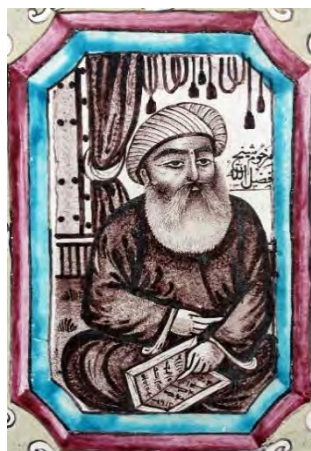
ت ۲۶. علما و شخصیت مذهبی، بخش حسینیة تکیه معاون‌الملک، کرمانشاه.