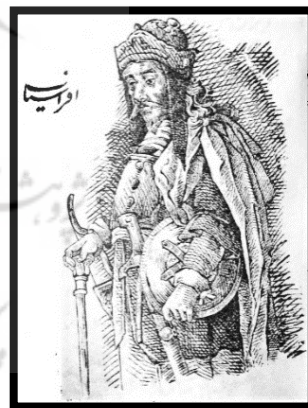
تصویر ۱۹. پهلوان شاهنامه (افراسیاب، پیشدادیان)،

کتاب نامه خسروان (میرزا قاجار، ۱۴۴۸ ق، ۱۱۹).