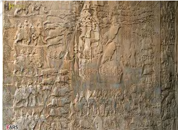
ت ۱۳. دیوارنگاره شکارگاه خسرو پرویز، نقش برجسته ساسانی، سمت چپ طاق بستان، کرمانشاه.