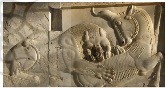
تصویر ۱۰. نقش مایه نبرد شیر و گاو، نقش برجسته، کاخ آپادانا، تخت جمشید، فارس، هخامنشی.