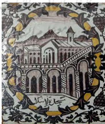
تصویر ۲۸. نقوش مذهبی (مسجدالاسلام)، بخش حسینیة تکیه معاون‌الملک، کرمانشاه.