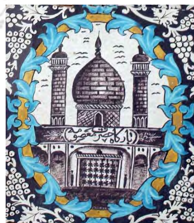
تصویر ۲۷. نقوش مذهبی (بارگاه حضرت معصومه (س))، بخش عباسیه، تکیه معاون‌الملک، کرمانشاه.