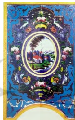
تصویر ۳۳. نقاشی پشت‌شیشه، اصفهان، آغاز سده ۱۳ ه.ش (ریاضی، ۱۳۹۵: ۸۵).