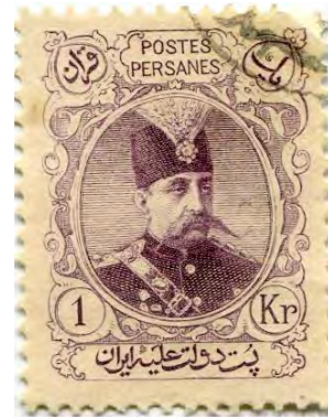
تصویر ۴۱. تمبر ۵ شاهی، سری تمام رخ مظفرالدین شاه، ۱۲۸۱ ه.ش، (مأخذ: کتابخانه و موزه ملی ملک، مجموعه تمبر، قاجاریه).