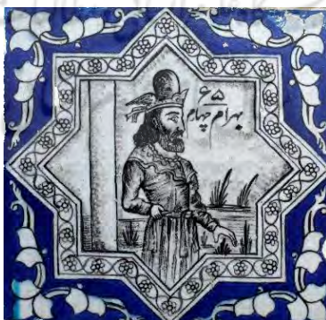
ت ۴. شاه ایران باستان (بهرام ۴، شاه ساسانی) بخش حسینیه، تکیه معاون الملک، کرمانشاه. (مأخذ: آرشیو یوزباشی، ۱۳۹۹).