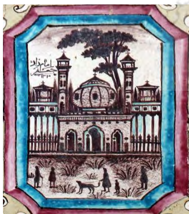
تصویر ۲۹. نقوش مذهبی (امامزاده جعفر (ع))، بخش حسینیة تکیه معاون‌الملک، کرمانشاه.

تصویر بناهای مذهبی مانند امامزاده‌ها و مساجد مختلف جهان اسلام از جمله نقوش مذهبی است که بر روی کاشی‌های اماکن مذهبی چون تکیه معاون‌الملک نقاشی شده است. این نقش‌ها تک رنگ بوده و عموماً در کادرهای بیضی (تصویر ۲۷ و ۲۸) یا کشکولی شکل (تصویر ۲۹) ترسیم شده است. این نقوش نشان‌دهنده اهمیت و ارزش بناهای مذهبی همچون مساجد و امامزادگان در بین مردم و حاکمیت قاجار بوده است و بیانگر اعتقادات و دلبستگی مردم به جریان‌های مذهبی در این عصر می‌باشد (پنجه‌باشی و فرهد، ۱۳۹۴: ۲۶). از جمله بناهای منقوش در این تکیه می‌توان به بیت‌المقدس، مسجد قبا، کربلای معلی، مسجدالاسلام، جنت‌المعلی، بارگاه رسول‌الله (ص)، طائف شریف، بارگاه حضرت سیدالشهدا (ع)، بارگاه حضرت معصومه (س)، بارگاه حضرت عباس (ع)، بارگاه شاهزاده عبدالعظیم (ع)، بارگاه امام رضا (ع)، بارگاه امام علی (ع)، امامزاده جعفر (ع) و غیره اشاره داشت (تصویر ۲۷، ۲۸ و ۲۹).