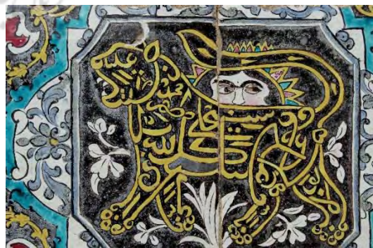
تصویر ۱. نقش‌مایه شیر و خورشید، خط نقاشی، کادر کشکولی،

بخش حسینییه، تکیه معاون‌الملک، کرمانشاه (مأخذ: آرشیو یوزباشی، ۱۳۹۹). دیوار بیرونی، تکیه معاون‌الملک، کرمانشاه (مأخذ: آرشیو یوزباشی، ۱۳۹۹).