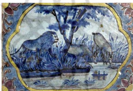
تصویر ۴۵. حیات وحش، بخش زینبیه در تکیه معاون‌الملک، کرمانشاه.