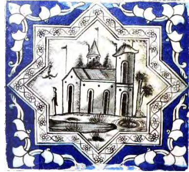
تصویر ۳۰. موضوع روزمره، مناظر معماری، بخش حسینیه تکیه معاون‌الملک، کرمانشاه.