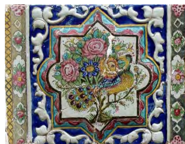
تصویر ۴۴. گل و پرنده، بخش بیرونی، تکیه معاون‌الملک، کرمانشاه.