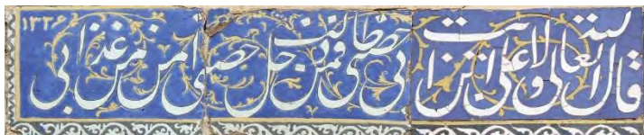
تصویر ۴۷. همگامی با خوشنویسی، کتیبه‌نگاری روایات (قال الله تعالى وَلَآئِهٖ عَلِيٌّ بَنُ أَبِي طَالِبٍ حِصْنِي فَمَنْ دَخَلَ حِصْنِي أَمِنَ مِنْ عَذَابِي)، دیوار بیرونی، تکیه معاون‌الملک، کرمانشاه (مأخذ: آرشیو یوزباشی، ۱۳۹۹).