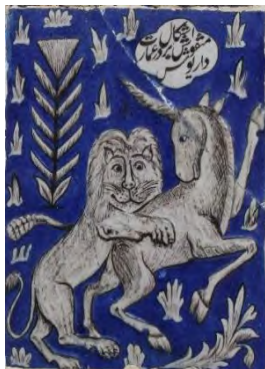
تصویر ۱۲. نبرد شیر و گاو، کاشی نگاری، بخش حسینی تکیه معاون الملک، کرمانشاه.