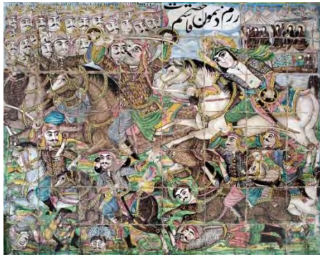
تصویر ۳۶. نقاشی خیالی‌نگاری، رزم نمودن حضرت قاسم (ع) بخش زینبیه، تکیه معاون‌الملک، کرمانشاه

قهوه‌خانه‌ای است، تابلوهایی مانند نبرد حضرت علی (ع) با مرحب سردار خیبریان، عصا انداختن حضرت موسی به قصر فرعون، صحنه مباحثه حضرت رضا (ع) و مکتب‌خانه فرزندان حضرت علی (ع) . همچنین تابلوهایی دیگری چون رزم حضرت قاسم (ع) با این سبک در تمام بخش‌های تکیه مشاهده شده است. کاشی‌نگاره «رزم نمودن حضرت قاسم (ع) » (تصویر ۴۶) با نقاشی «گذشتن سیاوش از آتش» (تصویر ۳۵). از لحاظ سبک نقاشی خیالی‌نگاری با یکدیگر شباهت دارند. شباهت در تصویر سیاوش و اسبش با تصویر حضرت قاسم (ع) و اسبش به‌وضوح نمایان است.