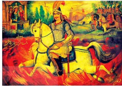
تصویر ۳۵. نقاشی خیالی‌نگاری، گذشتن سیاوش از آتش، شاهنامه فردوسی، حسن اسماعیل‌زاده (مأخذ: چلیپا و دیگران، ۱۳۸۹: ۷۰).