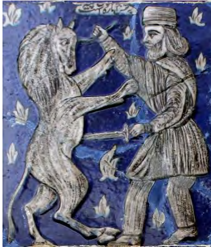
تصویر ۹. نقش مایه شیردال، کاشی نگاری، بخش عباسیه، تکیه معاون الملک، کرمانشاه.