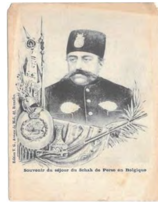
تصویر ۴۳. کارت پستال. مظفرالدین شاه قاجار، چاپ فرانسه، ۱۹۰۰ م