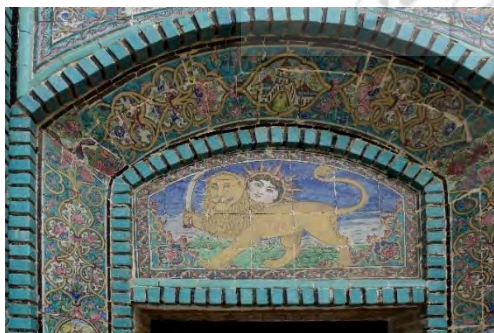
تصویر ۲. نقش‌مایه شیر و خورشید و شمشیر،

از بارزترین نمونه بهره‌مندی هنرمندان از جهان اساطیری، نقوشی است که به نمادهای ایزدی دلالت دارند یا نسبت داده می‌شوند که در این نسبت، با یکی از ایزدان پیوند خورده است؛ مانند نقش خورشید خانم و نقش شیر است. نماد شیر به‌عنوان سمبلی که نشانگر قدرت صاحب آن است، به‌شکل‌های مختلف در هنر ایران باستان آورده شده است. از جمله شکل افسانه‌ای آن، گریفین (شیردال) می‌باشد که در دروازه‌های تخت‌جمشید مدافعانه ایستاده است (افضل‌طوسی، ۱۳۸۴: ۳۰). نمونه آن در تکیه معاون‌الملک کرمانشاه، کتاب آثارالعجم و نقش برجسته هخامنشی دیده شده است (تصویر ۷، ۸ و ۹). از دیگر نقوش مرتبط با خورشید، نقش ترکیبی شیر و خورشید است. نماد شیر روی پرچم‌های حاکمان ایران از دوره اشکانی ادامه داشت تا در عهد فتحعلی‌شاه قاجار، دو پرچم یکی به نشان شمشیر ذوالفقار حضرت علی (ع) و دیگری نشان شیر و خورشید، به رسمیت شناخته می‌شد (خزایی، ۱۳۸۱: ۵۷) (تصویر ۱).