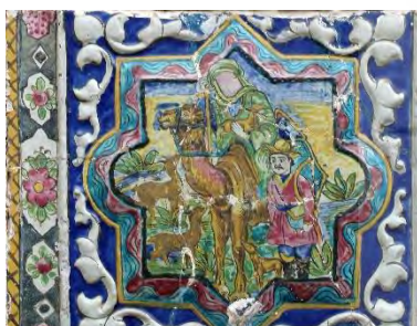
تصویر ۴۶. شفاعت (امام رضا (ع) ) آهوان نزد، شکارچی بخش بیرونی، تکیه معاون‌الملک، کرمانشاه.

ستاره ترسیم می‌شود. اغلب این کاشی‌ها تک رنگ و در زمینه سبز، آبی لاجوردی یا سیاه ترسیم شده‌اند. این نقش‌ها دارای اصالت بوده و ریشه در مذهب مسلمانان دارد (تصویر ۳۴). ۲) کادر ستاره ایرانی با دو زاویه منحنی : تصاویر گل و گیاه، گل و پرندگان (تصویر ۴۴)، گل و گلدان، کتیبه‌های اشعار، وقایع‌نگاری تاریخ ائمه مانند شفاعت (امام رضا (ع) ) آهوان نزد شکارچی در قسمت دیوارهای بیرونی تکیه (تصویر ۴۶). ۳) کادر کشکولی : تصاویر علما و شخصیت‌های مذهبی و روحانیون (به صورت نشسته یا نیم‌تنه) مانند مرحوم شیخ فضل‌الله (تصویر ۲۶)، کتیبه خط نقاشی، زندگی روزمره، مناظر و بناهای مختلف مانند کاخ‌های شاهی (قصر سلطان‌آباد شیراز) و امام‌زاده جعفر (ع) (تصویر ۲۹) و حیات وحش و میوه (بخش حسینی)، وقایع تاریخی ائمه و نقش‌مایه اساطیری پیش از اسلام: شیر و خورشید (تصویر ۱) (بخش بیرونی). ۴) کادر بیضی اسلیمی : تصاویر بزرگان حکومتی (سیاسی) و اشخاص محلی بصورت تمام قد (تصویر ۲۴ و ۲۵) (بخش حسینی و عباسیه)، بناها و مناظر (تصویر ۲۷ و ۲۸) (بخش زینبیه، عباسیه و حسینی و دیوارهای بیرونی)، روزمره و وقایع تاریخ ائمه (تصویر ۱۵) (بخش حسینی). ۵) کادر اسلیمی : گل و پرنده و شاهان ایران باستان و حاکمان دوره اسلامی (تصویر ۲۲) (بخش زینبیه) و کتیبه (بخش حسینی و عباسیه). ۶) کادر مستطیلی با زوایای منحنی : کتیبه (بخش بیرونی و زینبیه) و بناها و مناظر، حیات وحش (تصویر ۴۵)، علم و فناوری (تصویر ۳۹) (بخش زینبیه). ۷) سایر کادرهایی : چون هشت‌ضلعی مثل گل (بخش حسینی) و غیره.