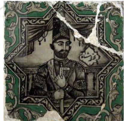
ت ۲۱. شخصیت شاهان عصر قاجار (محمد شاه)، ت ۲۲. شخصیت حاکمان دوره صفوی (شاه عباس)، ت ۲۳. شخصیت شاه مصر (فرعون)، بخش زینبیه، تکیه معاون‌الملک، کرمانشاه بخش زینبیه، تکیه معاون‌الملک، کرمانشاه (مأخذ: آرشیو یوزباشی، ۱۳۹۹). (مأخذ: آرشیو یوزباشی، ۱۳۹۹). (مأخذ: آرشیو یوزباشی، ۱۳۹۹).