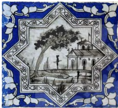
تصویر ۳۴. تصاویر با موضوعات روزمره، اقتباس از نقاشی پشت‌شیشه، بخش حسینیه تکیه معاون‌الملک، کرمانشاه.

منطقه گیلان، نوعی از قاب مخصوص شمایل وجود داشته است که به آن «لوا» ۵ می‌گفتند. نقاشی پشت‌شیشه توسط درویش حمل و از روی آن مرثی ائمه و داستان‌های دیگر نقل می‌شدند و یا برای تزئین اماکن مذهبی چون حسینیه و مراسم ایام محرم مورد استفاده قرار می‌گرفت. تصاویر نقاشی پشت‌شیشه از لحاظ مضامین شباهت زیادی با تصاویر اماکن متبرکه‌ای چون بقاع گیلان دارند و حتی در جاهایی این مضامین مشترک‌اند. احتمال می‌رود برخی از دیوارنگاره‌های اماکن مذهبی را نقاشان پشت‌شیشه (چون علی‌اکبر گیلانی، اسماعیل گیلانی و علی رشتی) که در اواخر عصر قاجار فعال بودند، کار کرده باشند و شاید از طرح‌های مشترکی استفاده کرده‌اند (اخویان، ۱۳۹۱: ۱۶۸-۱۷۱). برخی تصاویر دیوارنگاره‌های تکیه ۶ معاون‌الملک با موضوعات روزمره (تصویر ۳۴) از نقاشی پشت‌شیشه الهام گرفته‌اند (تصویر ۳۳).