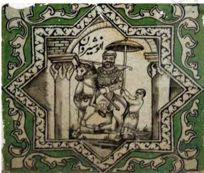
ت ۵. شاهان ایران باستان (انوشیروان، شاه ساسانی) بخش زینبیه، تکیه معاون الملک، کرمانشاه. (مأخذ: آرشیو یوزباشی، ۱۳۹۹).

هنرمندان دوره قاجار از تصاویر شاهان اساطیری و ایران باستان نیز تأثیر گرفته اند. حضور پادشاه در مراسم هایی که داستان های شاهنامه را از زبان نقالان گوش می داد، زمینه ای برای الگو گرفتن از این داستان ها جهت نمایش تصاویر او بر روی دیوارنگاره ها است. نقوش روی کاشی های تکیه معاون الملک شامل موضوعات کهن به ویژه تصاویر پادشاهان اسطوره ای و پهلوانی و پادشاهان واقعی ایران دوره ساسانی و قبل از آن را مطابق مندرجات شاهنامه فردوسی تشکیل می دهند که نام هر یک در کنار آن ها نوشته شده است. (۱) پادشاهان اسطوره ای : تصاویر این شاهان برگرفته از شاهان پیشدادی و کیانی دوره اساطیری شاهنامه است که عبارتند از: کیومرث، تهمورث، جمشید، ضحاک، هوشنگ و غیره (تصویر ۳؛ ۲) پهلوانان شاهنامه فردوسی : تصاویر این شاهان برگرفته از شاهان دوره پهلوانی - مانوی است که عبارتند از: تور، سلم، ایرج، توس، نوذر، کیقباد، کیکاووس، کیخسرو، فریدون، لهراسب، گشتاسب، گرشاسب، رستم اشکبوس، منوچهر، افراسیاب و غیره (تصویر ۲۰؛ ۳) شاهان ایران باستان : تصاویر این شاهان برگرفته از دوره تاریخی شاهنامه است که عبارتند از: اردشیر دوم، آذر میدخت، داراب، دارا، آرد دوم، اردوان دوم، فرهاد، تیرداد، اسکندر، بلاش، هرمز، بهرام، شاپور، نرسی، پوراندهخت، یزدگرد، انوشیروان (خسرو یکم)، بهرام چهارم و غیره (تصویر ۴ و ۵).