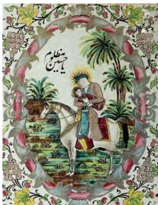
ت ۱۵. نقوش نمادهای ایرانی (درخت نخل) بخش عباسیه، تکیه معاون الملک، کرمانشاه.