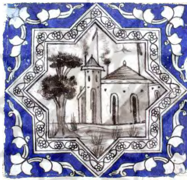
تصویر ۳۱. موضوع روزمره، مناظر معماری، بخش حسینیه تکیه معاون‌الملک، کرمانشاه.