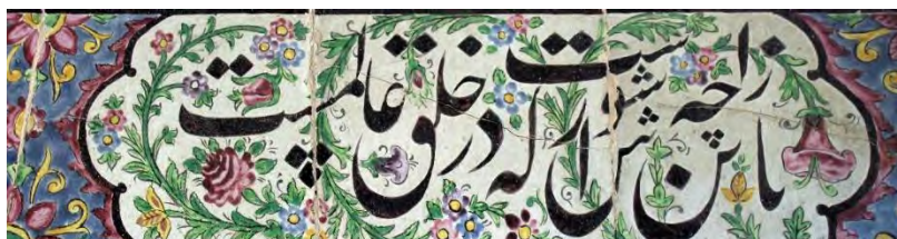
تصویر ۴۸. همگامی با خوشنویسی، کتیبه‌نگاری اشعار (باز این چه شورش است که در خلق عالمست)، تصویر ۴۹. همگامی با خوشنویسی، خط نقاشی، بخش زینبیه، تکیه معاون‌الملک، کرمانشاه (هو العلی الاعلی)، بخش زینبیه تکیه معاون‌الملک، کرمانشاه.