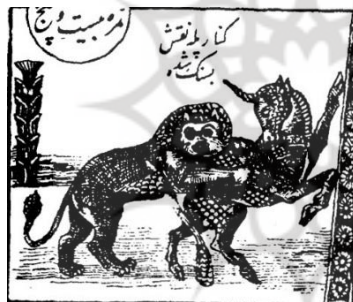
تصویر ۱۱. نبرد شیر و گاو، کتاب آثار العجم (مأخذ: فرصت حسینی شیرازی، ۱۳۱۴ ق: نمره ۲۵).