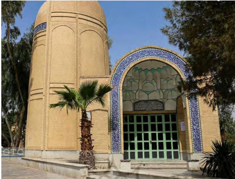
تصویر ۳: کاربرد رنگ سفید و آبی در معماری بقعه بانو امین، اصفهان، دوره معاصر.

در بقعه مبارکه بانو امین، فضای زیادی از کاشی‌ها به رنگ سفید اختصاص یافته است. این رنگ در جوار سایر رنگ‌ها، جلوه‌ای دیگر به رنگ‌ها بخشیده است. رنگ سفید در پوستره‌های گرافیکی معاصر نیز از جایگاه ویژه‌ای برخوردار است. این رنگ مانند حضورش در هنر معماری اسلامی نمادی از پاکی، نور، آرامش و آزادی است.