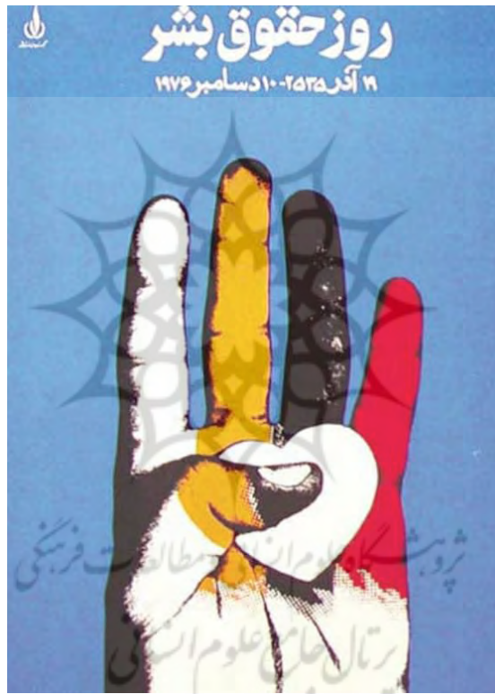
تصویر ۵: کاربرد رنگ آبی در پوستر ممیز ۱۳۵۵، دوره معاصر.

آبی معنای ایمان را می‌دهد و به فضای لایتناهی مربوط می‌شود و به آسمان اشاره می‌کند. آبی از نظر سمبولیک شبیه به آب آرام، خلق و خوی آرام، طبیعت زنانه و روشنی و درخشش یک کتاب خطی است. ادراک حسی آن طعمی شیرین دارد. محتوای عاطفی آن ملایمت است. مناسب‌ترین محیط برای ایجاد تفکر، مظهر ابدیت بی‌انتهای سنت و ارزش‌های پایدار، محیطی است که رنگ آبی می‌آفریند. پس چگونه می‌تواند جایش در بقعه مبارکه بانو امین خالی باشد؟ تمرکز پشم به رنگ آبی، به گونه‌ای است که همواره دورتر از محل واقعی خویش به نظر می‌رسد. و به این علت وقتی بر بقعه مبارکه بانو امین می‌نشیند، آدمی را با خود تا آسمان می‌کشاند. کاشی‌های این بقعه مبارکه، به وفور این رنگ را در خود جای داده‌اند، و به این واسطه جلوه زیادی به بقعه مبارکه بخشیده‌اند.