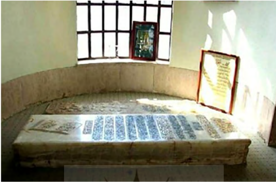
تصویر ۲: چشم‌اندازی از انعکاس نور مقبره بانو امین، اصفهان، دوره معاصر.

نور، عنصر برجسته معماری ایرانی و اسلامی در بقعه مبارکه بانو امین است و نه تنها به عنوان یک عنصر فیزیکی بلکه به عنوان یک سمبل عقل الهی و سمبول وجود می‌باشد. نور یک عنصر روحانی است که در سختی ماده نفوذ کرده و آن را تبدیل به یک صورت شریف می‌کند و آن را شایسته می‌سازد که محل استقرار روانی انسانی باشد که جوهر او نیز ریشه در عالم نور دارد، عالمی که جز عالم روح نیست.