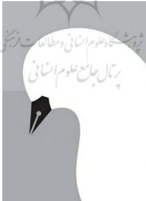
تصویر ۴: کاربرد رنگ سفید در پوستر بیان آزادی، از تورج صابری وند، دوره معاصر.

در بقعه مبارکه بانو امین، فضای زیادی از کاشی‌ها به رنگ سفید اختصاص یافته است. این رنگ در جوار سایر رنگ‌ها، جلوه‌ای دیگر به رنگ‌ها بخشیده است. رنگ سفید در پوستره‌های گرافیکی معاصر نیز از جایگاه ویژه‌ای برخوردار است. این رنگ مانند حضورش در هنر معماری اسلامی نمادی از پاکی، نور، آرامش و آزادی است.