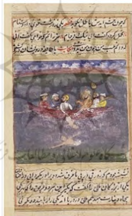
تصویر ۳: نگاره مربوط به مشورت کردن، در گلستان سعدی، نسخه موزه لندن.

همان گونه که در تصاویر بالا مشخص است هر دو ادیب ایرانی برای مقوله مشورت کردن و تفکر اهمیت به سزایی قائل بوده اند.