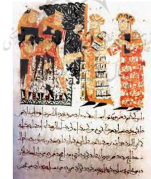
تصویر ۴-نگاره دوستی در قابوسنامه. منبع: (نصیری، ۱۳۹۵: ۴۲).

از مهم‌ترین آداب و مهارت‌های اجتماعی، مهارت دوست‌یابی و تداوم دوستی است. هر انسانی در مسیر زندگی اجتماعی خویش ناگزیر از یافتن دوست است و نوع دوستانی که برای خود برمی‌گزیند، چه بسا شخصیت او را در آینده شکل خواهد داد. «هم دوست‌یافتن هنر است و هم دوست نگه‌داشتن؛ هم دوستی‌های تعطیل شده و به هم خورده را دوباره پیوندزدن و برقرار ساختن» (محدثی، ۱۳۸۹: ۱۷۵). اهمیت این موضوع تا آن‌جا است که خداوند متعال در قرآن کریم از جمله حسرت‌های جهنمیان را همراهی با دوستان ناشایست بیان می‌دارد: «يَا وَيْلَتَى لَيْتَنِي لَمْ أَتَّخِذْ فُلَانًا خَلِيلًا» (فرقان/ ۲۸). تأثیر دوستان خوب در یکدیگر را سعدی در قالب شعری از زبان «گل خوشبوی» در دیباچه گلستان بیان می‌دارد (سعدی، ۱۳۷۷: ۵۱). عنصرالمعالی نیز در خصوص تأثیر دوست خوب، آن را به هم‌نشینی روغن کنجد با گل و بنفشه مثال می‌زند که به برکت این اختلاط و هم‌نشینی او هم نام گل به خود می‌گیرد: «صحبت جز با مردم نیک‌نام مکن که از صحبت نیکان، مرد نیک‌نام شود؛ چنان‌که روغن کنجد از آمیزش با گل و بنفشه که به گل و بنفشه‌اش باز می‌خوانند از اثر صحبت ایشان» (عنصرالمعالی، ۱۳۹۰: ۳۶). او پس از بیان لزوم دوست‌یابی، ویژگی‌های دوست خوب را نیز برمی‌شمرد: نیک‌نام، نیک‌اندیش و نیک‌آموز، شریک در غم و شادی، هم‌گف بودن، باخرد و دانا و بی‌طمع (همان، ۲۹ و ۱۴۰-۱۴۲). تصویر زیر مربوط به قابوسنامه به اصل دوست‌یابی اشاره کرده‌است.