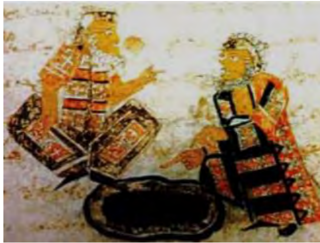
تصویر ۲. نگاره درباره اندیشه کردن در قابوس نامه. منبع: (نصیری، ۱۳۹۵: ۳۷)