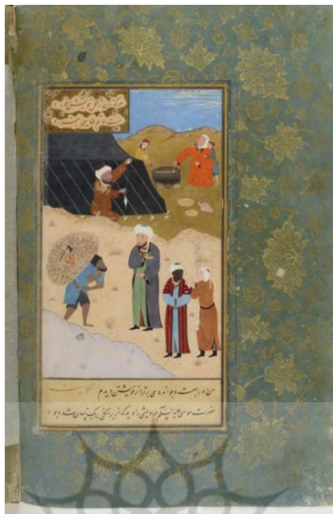
تصویر ۵: نگاره سبک زندگی در بوستان سعدی، نسخه چستربیتی لندن.

عنصرالمعالی که همیشه سعی داشته است فلسفه تربیتی هر مهارتی را بیان کند، به فلسفه انفاق از نگاه دینی به عنوان آزمایش الهی نسبت به صاحبان نعمت اشاره می‌کند. او معتقد است انفاق ابتدا موجب رشد و کمال در انفاق‌کننده می‌شود و بعد گشایشی برای نیازمند. «... و خدای تعالی تقدیر کرد تا گروهی درویش باشند و گروهی توانگر و توانا بود بدان که همه را توانگر کردی و لکن دو گروه از آن کرد تا منزلت و شرف بندگان پدید شود و برتران از فروتران پیدا شود... مردم صدقه ده پیوسته در امن خدای تعالی باشند... و چون تو با کسی خوبی کنی، بنگر که در وقت خوبی کردن هم چندان راحت که بدان کس رسد در دل تو خوشی و راحت پدید آمد» (عنصرالمعالی، ۱۳۹۰: ۲۲-۲۹). او با نگاهی انسانی و اخلاقی بر این باور است که انفاق نسبت به دشمن نیازمند هم جایز است؛ چراکه شاید این امر موجب مودت در دل دشمن گردد: «و اگر هم جنسی از تو را شغلی اوفتد، ناچار از بهر او بکوش، رنج تن و مال دریغ مدار؛ اگرچه دشمن و حاسد تو باشد...» (همان، ۴۰).