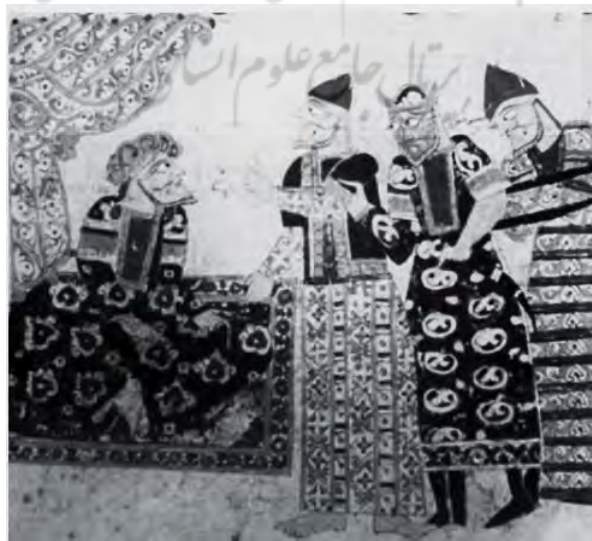
تصویر ۱: نگاره آیین و عقوبت عفو کردن در کتاب قابوسنامه. منبع: (نصیری، ۱۳۹۵: ۴۰)

او عبادت و بندگی را در سنین جوانی با ارزش می‌داند و معتقد است پیر چاره‌ای جز پناه‌بردن به کنج عبادت ندارد: «قحبه‌ی پیر از ناپکاری چه کند که توبه نکند و شحنه معزول از مردم آزاری. جوان گوشه‌نشین شیرمرد راه خداست/ که پیر خود نتواند ز گوشه‌ای برخوردار» (همان، ۱۹۰). عنصرالمعالی نیز طبق رسالتش در بیان فلسفه تربیتی برخی واجبات نظیر روزه می‌گوید: «و بدان که بزرگ‌ترین کاری در روزه آن است که چون نان روز به شب افکنی آن نان را که نصیب روز خود داشتی به نیازمندان دهی تا فایده رنج تو پدید آید» (عنصرالمعالی، ۱۳۹۰: ۱۹). او در جای دیگر نیز عالمانه می‌گوید صرف عبادت شرط نیست؛ بلکه اصل در عبادت «لزوم عبودیت محض» است (همان، ۲۳). «این قرائن نشان می‌دهد که روح و فرهنگ عنصرالمعالی آمیزه‌ای از فرهنگ ایرانی است که با فرهنگ اسلامی روزگار او چنان درهم تنیده شده است که تبیین حد و مرز آن دو ساده نیست» (سبزیان‌پور، ۱۳۹۲: ۵۴). در تصویر زیر که مربوط به نسخه مصور قابوسنامه است به موضوع عفو و بخشایش اشاره شده است.