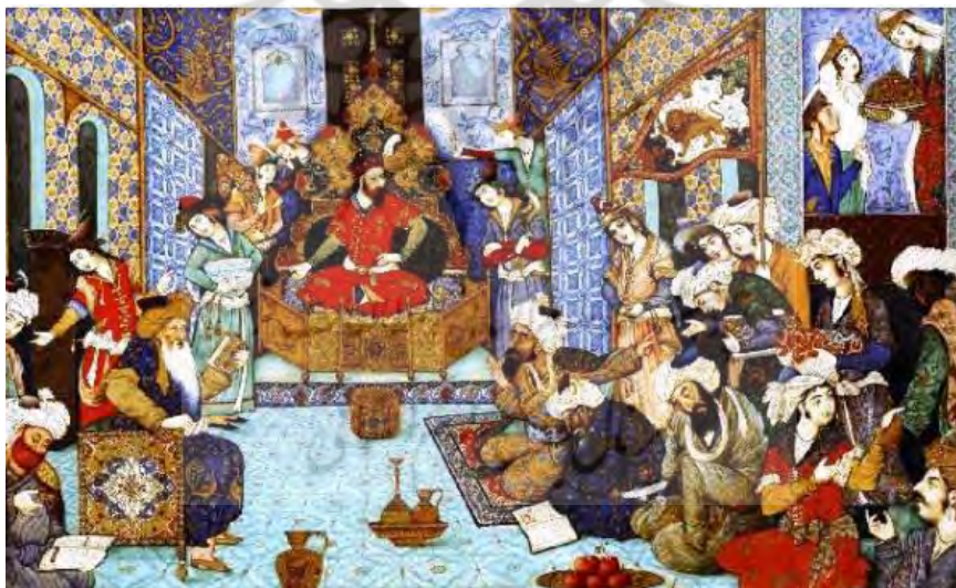
تصویر ۶: نگاره پادشاه در قابوسنامه.

عنصرالمعالی و سعدی به جهت اهمیت این امر، یکی از وظایف مهم حاکمان را تأمین معیشت لشکریان می‌دانند تا در زمان حادثه از بذل جان دریغ ندارند و صحنه را خالی نگذارند. «... لشکر خویش را همیشه دل خوش‌دار، اگر خواهی که جان از تو دریغ ندارند، تو نان از ایشان دریغ مدار» (عنصرالمعالی، ۱۳۹۰: ۲۲۶). سعدی نیز یکی از پادشاهان پیشین را حکایت می‌کند که در مملکت‌داری سستس داشت: «یکی از پادشاهان پیشین در رعایت مملکت سستی کردی و لشکر به‌سختی داشتی. لاجرم دشمنی صعب روی نمود، همه پشت دادند» (سعدی، ۱۳۷۷: ۶۸). البته عنصرالمعالی در سطوری مجزا برخی از آداب و مهارت‌های مهم نظامی و کارزار را بیان می‌دارد که در نوع خود قابل توجه است (عنصرالمعالی، ۱۳۹۰: ۲۲۶-۲۲۳). در تصویر زیر که مربوط به قابوسنامه است سلطان محمود غزنوی در کنار درباریان به تصویر کشیده شده است و نوعی گفتگو در مجلس جریان دارد.