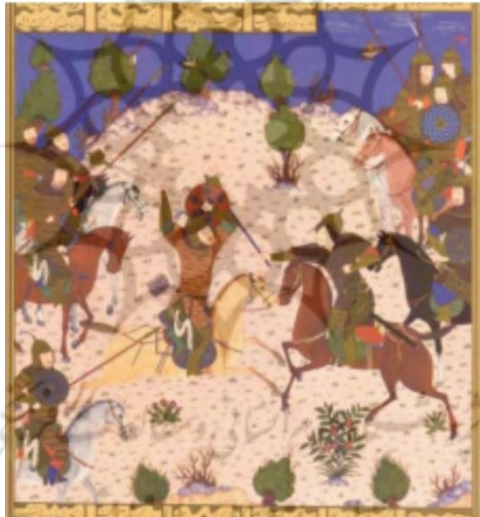
تصویر ۲: نبرد سهراب و رستم، شاهنامه بایسنقری، ۸۳۳ ه.ق. کتابخانه ملی ایران.

و سرانجام، رستم جسد پسر را در دیبای زرد پوشانده و در تابوتی تنگ و بسته گذاشته و جهانی را به زاری کور می‌کند. هرچند مرگ پسر، پدر را زار و ناتوان نموده‌است، ولی بعد از گذشت زمان رستم شکیبایی پیش می‌گیرد که هوشیار را چاره‌ای جز این نیست و هنجار دیگری جز این نمی‌شناسد: