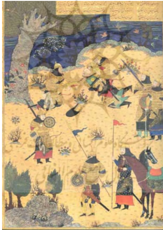
تصویر ۳: مرگ سیاوش، شاهنامه بایسنقری، ۸۳۳ ه.ق. هرات، منبع: کتابخانه ملی ایران.

از دیدگاه اسطوره‌شناسی، «سیاوش نماد یا خدای نباتی است؛ زیرا با مرگ او، از خورشید گیاهی می‌روید» (گریمال، ۱۳۷۸: ۲۳ / ۱). «عزیزترین پهلوان شاهنامه است» (اسلامی ندوشن، ۱۳۴۸: ۱۷۳). به سبب رهایی از دسیسه‌های پی‌درپی سودابه زن کاووس، داوطلبانه به همراهی رستم برای نابودی تورانیان پیمان‌شکن به بلخ می‌رود. پس از نبردی دلاورانه برای جلوگیری از خونریزی و کشتار، با قراردادن شرایطی، تورانیان را به صلح می‌خواند. افراسیاب که دلاوری‌های سپاه ایران را تجربه کرده، بدون چون و چرا شرایط سیاوش را می‌پذیرد. صلح بین ایران و توران محقق نمی‌شود، چراکه کیکاووس، صلح را دلیل بر ضعف می‌داند و می‌خواهد تمام اسیران و گروگان‌های تورانی کشته شوند. پا درمیانی رستم نیز کارساز نیست. رستم با حالتی قهرگونه، کاووس را ترک می‌کند و سیاوش را نیز در مرز ایران و توران تنها می‌گذارد. سیاوش نمی‌خواهد فرمان پدر را انجام دهد. پس به دنبال دعوت پیران‌ویسه، سردار خردمند تورانی به سرزمین دشمن پناه می‌برد. افراسیاب از آمدن او استقبال می‌کند و پس از مدتی فضیلت‌های سیاوش او را تحت تأثیر قرار می‌دهد و مهر سیاوش سبب می‌گردد تا افراسیاب، همگان را فراموش کند (اسلامی ندوشن، ۱۳۴۸: ۱۷۷-۱۷۶).