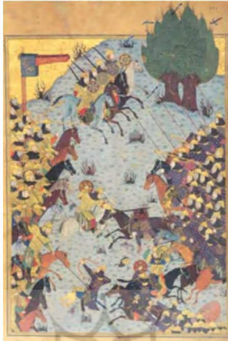
تصویر ۱: رزم کیخسرو و افراسیاب، شاهنامه بایسنقری.