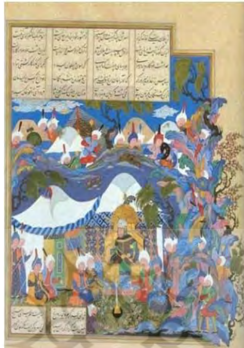
تصویر ۵: دیدار اسفندیار با رستم، شاهنامه بایسنقری، ۸۳۳ ه.ق. هرات.

رستم را به مهمانی دعوت می‌کنند و شکارگاهی را آماده می‌سازند که در آن شکارگاه چند چاه حفر نموده و ته چاه دشنه‌های تیزی قرار می‌دهند تا رستم به داخل یکی از این چاه‌ها بیفتد و بمیرد. رستم مهمانی برادرش را قبول می‌کند و بعد از مهمانی به شکار می‌روند و در نهایت رستم در داخل یکی از آن چاه‌های حفر شده توسط برادر روی دشنه‌ها می‌افتد و بدنش پاره‌پاره می‌شود. رستم از برادر درخواست تیری می‌کند که بدنش توسط ددان خورده نشود، شغاد هم قبول می‌کند و چند تیر و کمان به رستم می‌دهد و رستم بلافاصله تیری را به سوی برادرکش نابکار می‌زند و از برادر کین‌خواهی می‌کند و خود نیز چند لحظه بعد می‌میرد» (همان: ۳۸۸). می‌بینیم که او هم به مانند ایرج از فریب برادر آگاه نیست و فریب بدی‌ها و روباه صفتی او را می‌خورد. او از برادر خود شغاد- با رویی خرم استقبال می‌کند و او را از تخمه سام نیرم می‌داند. رستم برخلاف ایرج و اغریث، از جنگ پرهیزی ندارد. او پهلوانیست که در مقابل آشوب و نافرمانی سر فرود نمی‌آورد و جنگ را بهترین راه حل ممکن می‌داند.