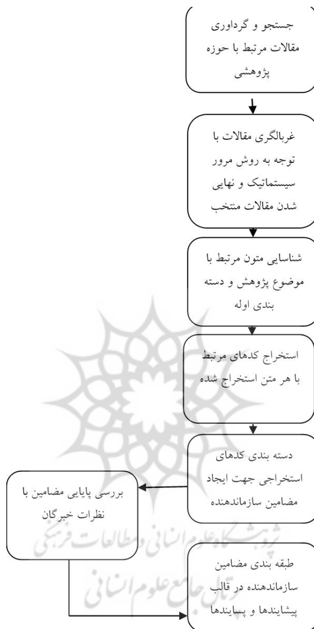
شکل ۲- روند انجام تحقیق