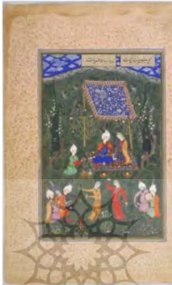
تصویر ۲: بزم عاشقان، دیوان حافظ، حدود ۹۳۲ ه.ق.

عملیات و روابط بینامتنی: حافظ به مثابه‌ی خواجه با نگاهی قلندری از هنجارگریزی‌های آگاهانه اهل معرفت سخن می‌گوید و باده‌نوشی این گروه را که اعتراضی نمادین به گفتمان مذهبی غالب وقت است، شرح می‌دهد. بنابراین، هر دو شاعر، در یک خط فکری حرکت کرده‌اند. مصراع دوم از حافظ براساس مصراع اول از خواجه سروده شده و شاعر شیرازی، با تغییر دادن دو واژه‌ی «خرقه و رهن»، واژه‌های «روی و سوی» را جایگزین کرده است. در این تأثیرپذیری، پنهان‌کاری تعمدی صورت گرفته و شاعر، هیچ نشانه‌ای مبنی بر اینکه مصراع را با رویکرد به شعر خواجه سروده، به دست نداده است. از این‌رو، می‌توان آن را از دید بینامتنی ژنتی، در شمار سرقت ادبی- هنری (مسخ و اغاره) آورد. منظور از مسخ و اغاره این است که «اثر دیگری را از لفظ و معنی بردارند و در آن به تقدیم و تأخیر کلمات و بسط عبارات یا نقل کردن به مردافات و امثال این امور، تصرف کنند». (همایی، ۱۳۸۹: ۲۲۷) حافظ نیز، چنین روشی را پیش گرفته است. در سطح محتوایی، دو شاعر با نگاهی قلندرانه به مقوله‌ی مرشدی و شیخی اشاره کرده‌اند. یکی از نموده‌های این باور، تظاهر به بی‌دینی و انجام اعمال خارج از عرف و شرع است. قلندرها با این روش، گفتمان قدرت دینی غالب را به چالش می‌کشند و سعی می‌کنند «با فنا کردن نفس خودپرست - که به ارزش‌گذاری‌های جامعه اهمیت می‌دهد- خود را از ریا و هرگونه تظاهر به زهد و تقوی برکنار دارند». (جلالی پندری، ۱۳۸۵: ۸۱) هدف اصلی شاعران از پرداختن به مبانی قلندری، ارائه‌ی بازتعریفی از نظام ارزش‌ها و ضدارزش‌ها و برهم‌زدن پیش‌انگاره‌های معمول و رایج است تا از این طریق، خوانشی نوین از واژگان و مفاهیم عمدتاً دینی و معرفت‌شناختی ارائه کنند. شاعران