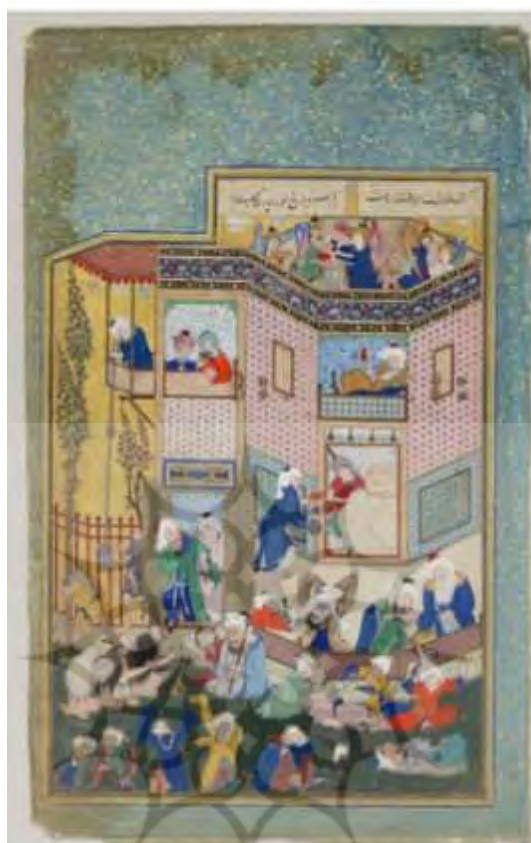
تصویر ۱: نگاره مستی لاهوتی و ناسوتی، دیوان حافظ سلطان محمد، حدود ۹۳۲ ه.ق.

البته باید اذعان داشت که نمونه ابیاتی که در پژوهش حاضر ذکر کردیم بدلیل بسامد بالایی که داشته، فقط تعدادی از مشابهات و وام‌گیری‌های این شاعر بزرگ می‌باشد.