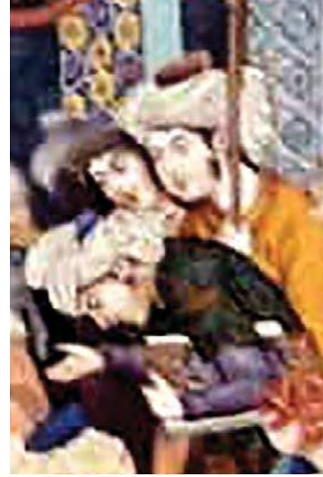
تصویر ۳: بخشی از نگاره دربار سلطان محمد غزنوی، هادی تجویدی

«فردوسی و پرده‌هایی از شاهنامه» جا گرفتن فردوسی و شیوه رنگ‌پردازی که به نظر کمی برجسته‌تر از دیگر نقش‌مایه‌ها به نظر می‌رسد را می‌توان به موقعیت و اهمیت باستان‌گرایی در دوره پهلوی و فردوسی به‌عنوان شاعر برجسته و ادبیات حماسی به‌عنوان ادبیات خاص دوره باستان‌گرایی مرتبط دانست. (تصویر ۱) همچنین در تعداد زیادی از نگاره‌های این گفتمان از جمله فرهادکوه‌کن و شیرین موضوعات تغزلی به چشم می‌خورد؛ نگارگران در خلق این آثار کاملاً به ادبیات فارسی وفادار بوده‌اند و تا حدودی از شیوه طبیعت‌گرایانه‌ای که بعد از کمال‌الملک پدیدار گشت و توسط هادی تجویدی در نگارگری به کار گرفته شد نیز بهره‌گرفتند. بعد از مشروطه هنرمندان به تدریج از به تصویر کشیدن موضوعات درباری به صورت کمال‌گرایانه و نگارگری سنتی فاصله گرفتند و به موضوعات درباری و غیر درباری در قالب رئالیسم با بهره‌گیری از پرسپکتیو، سایه‌روشن و چهره‌پردازی پرداختند که بیشتر در میان طبقه متوسط جدید مخاطب داشت. «به تدریج که شاه از مرکز گفتمان سیاسی خارج می‌شد از کانون عکاسی و نقاشی نیز خارج گردید». (مریدی، ۱۳۹۷: ۵۳) حتی زاویه دید نیز تغییر کرده و در بسیاری از تصاویر تصویر پادشاه که قبلاً سه رخ و از روبه‌رو بود با زاویه‌ای متفاوت و حتی درجایی پشت به دوربین نشان داده شده یا در برخی جاها رویدادی که در حال وقوع است از اهمیت بیشتری نسبت به شخص شاه نشان داده شده؛ بدین ترتیب واقع‌گرایی در نگارگری معاصر تا حدودی وارد گشت. (تصویر ۲) در نگارگری‌های گفتمان سنت‌گرای متجدد، برخلاف