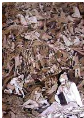
تصویر ۱. نگاره فردوسی و پرده‌هایی از شاهنامه، حسین بهزاد