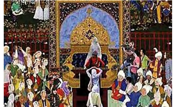
تصویر ۱۷. مجموعه ماکسیماتور، سودی شریفی