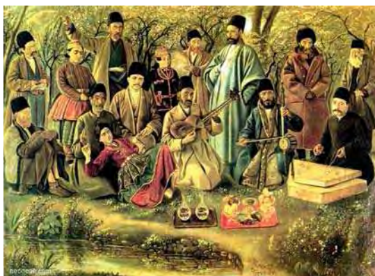
تصویر ۲. عمله طرب، کمال الملک، مأخذ: www.qajar.wordpress.com