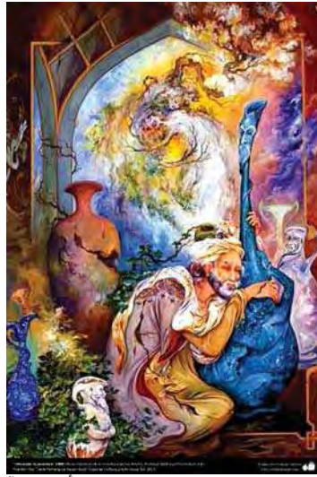
تصویر ۴: رباعیات خیام، محمود فرشچیان، مأخذ: www.fotografia.islamorientem.com