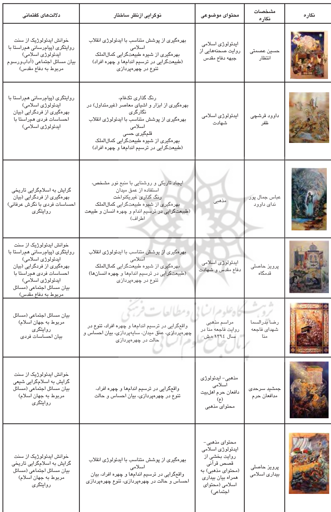
جدول ۳. نوگرایی نگارگری در گفتمان سنت‌گرای ایدئولوژیک، مأخذ: همان