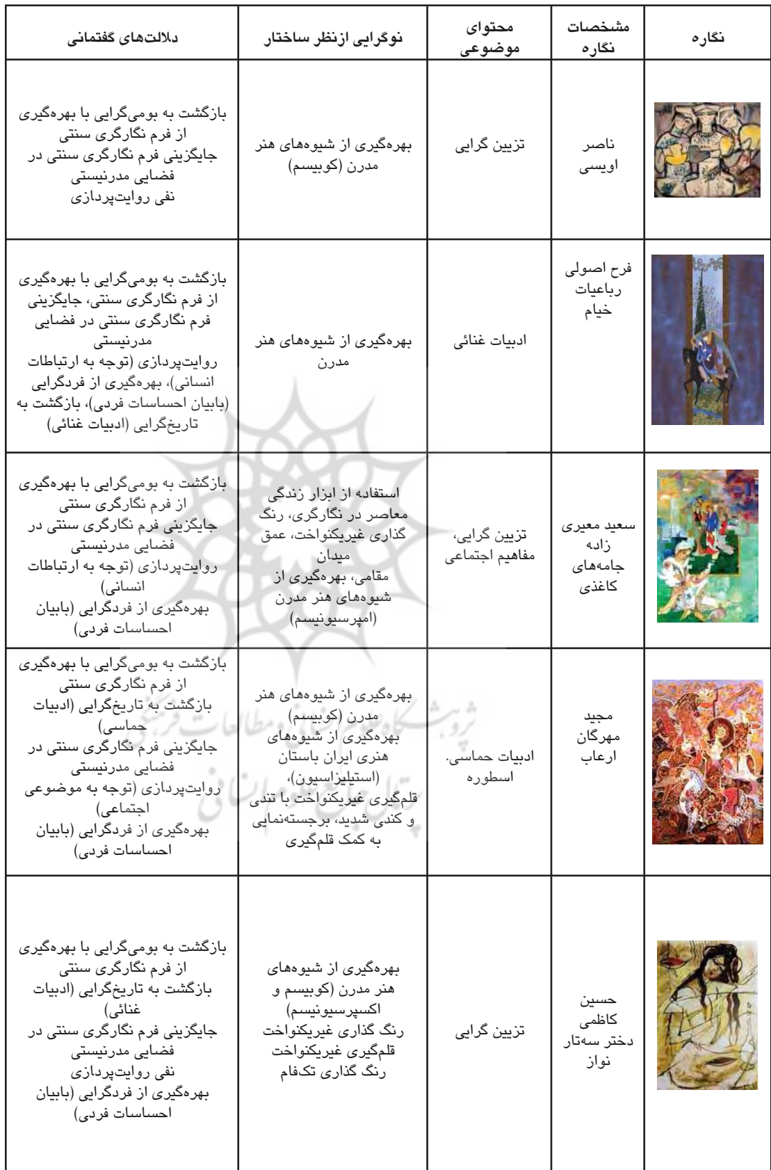
جدول ۲. نوگرایی نگارگری در گفتمان تجدد سنت‌گرا، مأخذ: همان