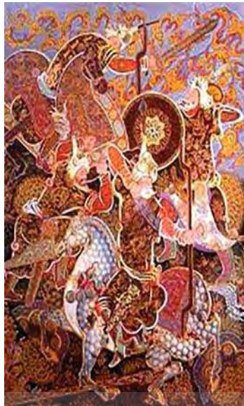
تصویر ۱۱. ارعاب، مجید مهرگان