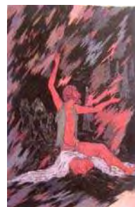
تصویر ۵. فقر نفت، حسین بهزاد، مأخذ: ناصری پور، ۱۳۸۳: ۲۲۳

هنرمند بیشتر متوجه عمق و معنای سوژه‌ها و مضامین است نه فقط ظواهر پر از نقش و نگار. «افتخاری، ۱۳۸۱: ۴۰» در تعدادی از آثار بهزاد نیز بازتاب معضلات جامعه ایران و دوره‌ای که هنرمند در آن می‌زیسته را به خوبی می‌توان مشاهده کرد. ۲ در چندین اثر با عناوین طلای سیاه، فقر نفت و صاحبان زر، بهزاد با رویکردی انتقادی به مسئله ملی شدن صنعت نفت پرداخته است. در نگاره‌ای با عنوان «فقر نفت» دکل‌های نفت در پس‌زمینه، نقش مردی بالباس مندرس در مرکز تصویر و زنان و مردانی نگران و هراسان در کنار دکل‌های نفت بخشی از وقایع تلخ جامعه خویش را بیانگر است که در آن برخلاف موضوعات موردعلاقه طبقه دربار در نگارگری سنتی به دغدغه‌های طبقه متوسط و فقیر جامعه پرداخته شده است. (تصویر ۵) علاوه بر آن بهزاد در مجموعه آثار با عنوان قحطی با طراحی‌های خطی متبحرانه و ایجاد تندی و کندی‌های حساب‌شده به بیان حالت و واقعیت تلخی که مردم طبقه متوسط و پایین جامعه به دنبال قحطی بزرگ سال ۱۲۹۵ هـ ش با آن مواجه هستند پرداخته است. (تصویر ۶) علاوه بر موضوعات فقر و قحطی در نگاره «شکست محور» حاج مصورالملکی، صحنه‌هایی از جنگ جهانی دوم را به تصویر کشیده که در سمت چپ روزولت استالین و چرچیل سوار بر اسب‌های آذربایجانی سوارند و هیتلر، موسولینی و هیرو هیتو نخست‌وزیر ژاپن در سمت راست قرار دارند. در این اثر متفقین بالباس ایرانیان و متحدین بالباس تورانیان دیده می‌شوند همچنین اشعاری از «شاهنامه» فردوسی نیز در حاشیه نگاشته شده است. (هاتفی، ۱۳۵۰) در تعدادی از آثار نیز بهزاد با دقت در حالت‌های فردی اشخاص به موضوعاتی برگرفته از آداب و رسوم اجتماعی پرداخته است.