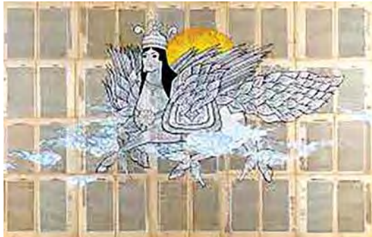
تصویر ۱۸. معراج، علاء ابتکار، مأخذ: کشمیرشکن، ۱۳۹۴: ۳۷۳