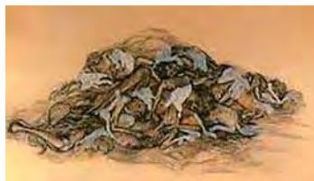
تصویر ۶. قحطی، حسین بهزاد