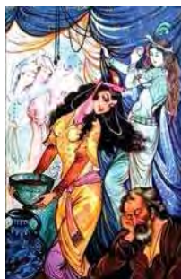
تصویر ۷. رباعیات خیام، محمد تجویدی