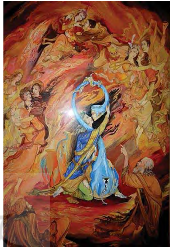
تصویر ۸. بوسه بر خاک، محمود فرشچیان، مأخذ: http://negarkhaneh.ir

و نشانه‌های غیر ایرانی، ترکیب‌بندی‌هایی تازه به‌ویژه در آثاری با موضوع اشعار خیام و حافظ را به وجود آورده است. در این میان می‌توان به مجموعه آثار محمد تجویدی اشاره کرد که فاقد ریزه‌کاری و دقت بود. (تصویر ۷) در نگارگری معاصر نمادهای حیوانی نیز جایگاه ویژه‌ای پیدا می‌کند. نمادهای حیوانی را بیشتر در آثار محمود فرشچیان می‌توان مشاهده کرد که به آن‌ها صفات انسانی داده شده است. علاوه بر محتوا، تحولات شیوه‌های اجرای نوگرایانه نیز در مسیر نوگرایی نگارگری در هر یک از گفتمان‌های نگارگری معاصر مؤثر واقع گردید. استفاده از عمق میدان از نوآوری‌هایی است که بعد از متداول شدن شیوه‌های نقاشی طبیعت‌گرایانه کمال‌الملک و شاگردانش، توسط حسین بهزاد و هادی تجویدی در نقاشی ایرانی به کار رفت. «نگاره دربار سلطان محمود غزنوی، هادی تجویدی از نخستین نمونه‌های ژرف‌نمای خطی در نگارگری معاصر محسوب می‌گردد. «به‌جز ژرف‌نمای خطی با نقطه‌گریز مشخص در آثاری چون «بوسه‌ای بر خاک» محمود فرشچیان «ژرف‌نمایی حسی یا جوی» به‌کاررفته است». (رضایی نبرد، ۱۳۹۴: ۱۲۰)، (تصویر ۸) برخلاف رنگ‌های خالص و درخشان نگارگری سنتی در