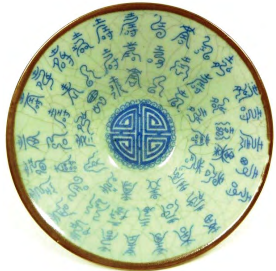
تصویر ۱. ظرف چینی به خط کانجی متعلق به امپراتور شوان دو از سلسله مینگ ۱۴۲۶-۱۴۳۵ م،