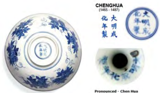
تصویر ۳. نمونه ظرف چینی متعلق به چنگ خوا ۱۴۶۵-۱۴۷۸ م،