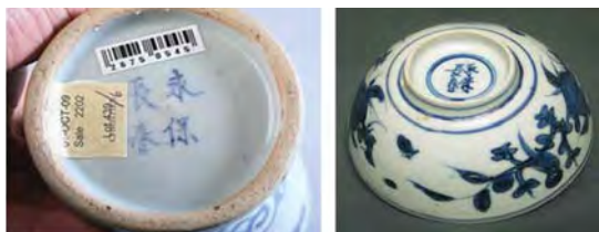
تصویر ۵. ظرف چینی با عبارت Eternal spring ۱۳۶۸ - ۱۶۴۴م،