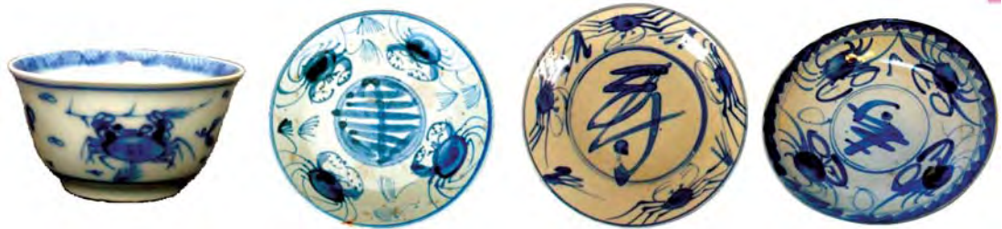
تصویر ۶. کاسه چینی از دوره مینگ با نقش خرچنگ ۱۳۸-۱۶۴۴م، مأخذ: www.pinterest.com