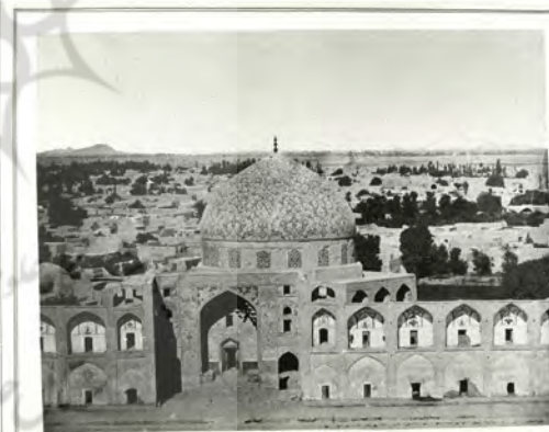
تصویر ۱. چارچوب مفهومی پژوهش.

- در زمینه تقسیم نقش‌ها و مسئولیت‌های سازمانی مرتبط با