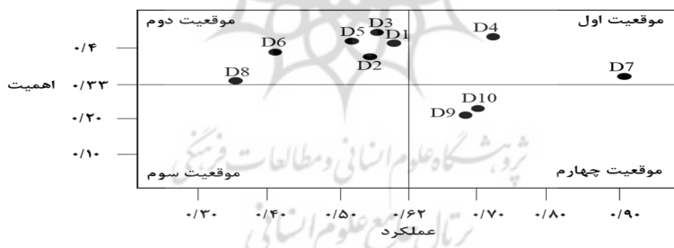
شکل ۴. جانمایی ابعاد همراستایی عملیاتی در ماتریس تحلیل اهمیت-عملکرد

شکل ۴، جایگاه هر یک از ابعاد همراستایی عملیاتی را در ماتریس تحلیل اهمیت-عملکرد نشان داده است.