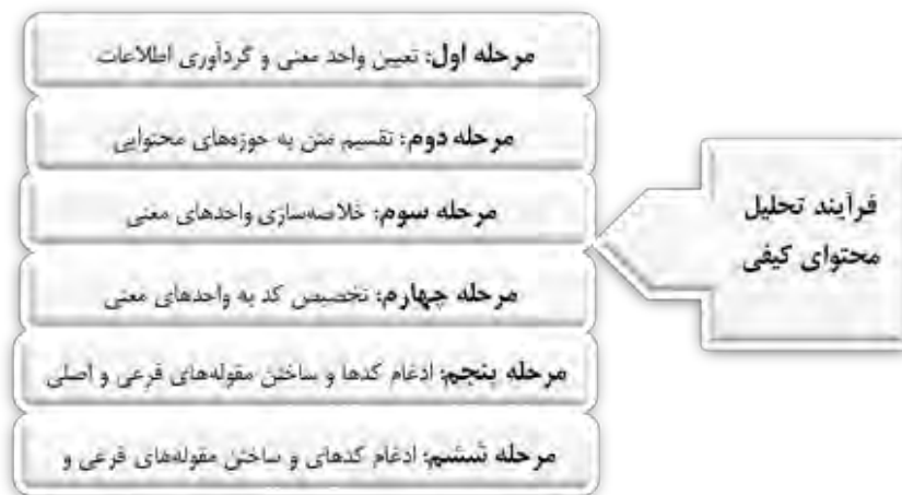
شکل ۲- مراحل انجام روش تحلیل محتوی