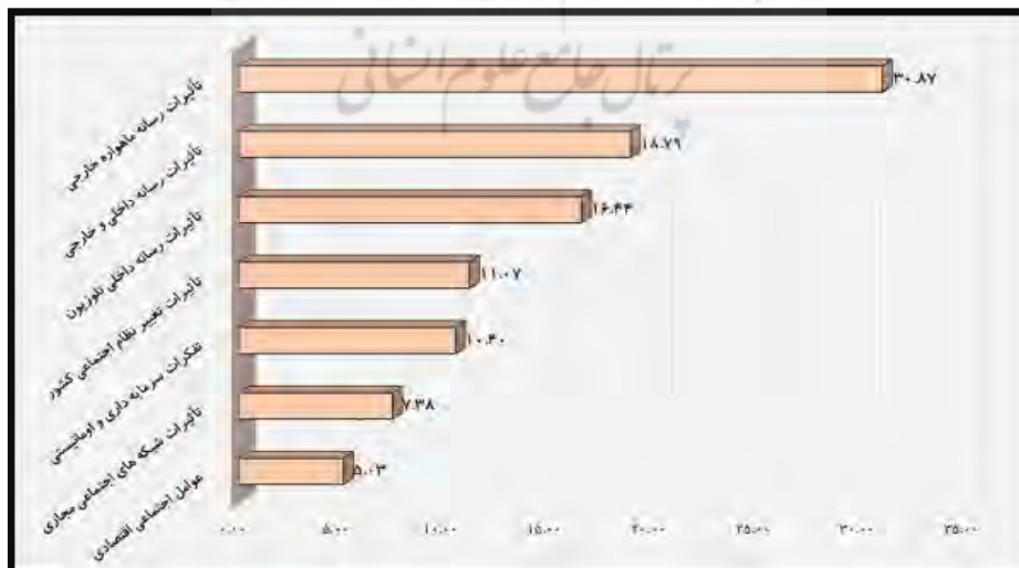
شکل ۳- نمودار اولویت‌بندی مقوله‌های انتخابی نهایی تأثیرگذار بر سبک زندگی ارزش‌های فرهنگی اجتماعی زنان (به درصد)

در ادامه به منظور نمایش واضح‌تر میزان تأثیرگذاری مقوله‌های اصلی بر ارزش‌های فرهنگی اجتماعی سبک زندگی زنان، ارقام مربوط به فراوانی به درصد تبدیل شده و در نمودار شکل ۳ نشان داده شده است.