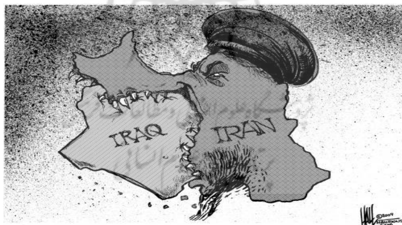
تصویر ۴. کاریکاتور رژیم بعث عراق مدعی منویات ایران در قبال عراق

در کاریکاتور چاپ‌شده در فضای مطبوعاتی و رسانه‌ای عراق، برخلاف کاریکاتورهای ایرانی که تصاویر طنز پردازانه داشته‌اند، صحنه دهشتناک بلعیده شدن عراق توسط ایران ملبس به لباس روحانیت ترسیم شده است. این نوع کاریکاتورها تلاش داشتند تا ایران را یک مهاجم بی‌رحم و ددمنش معرفی کنند.