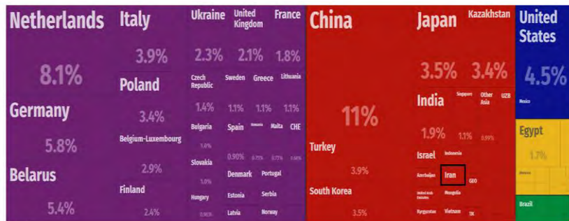
شکل ۱. جایگاه ایران در میان شرک‌های تجاری روسیه (۰.۳۸ درصد صادرات روسیه در سال