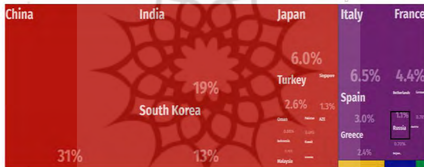
شکل ۲. جایگاه روسیه در میان شرک‌های تجاری ایران (۰.۷ درصد صادرات ایران در سال